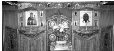
ЧЕБОКСАРСКИЕ РАЗРАБОТЧИКИ предложили построить в Автозаводском районе Тольятти венчальный храм