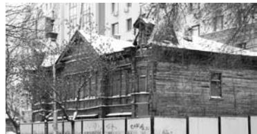
НАТАЛЬЯ ВОРОБЬЕВА спасла свое «Культурное наследие»