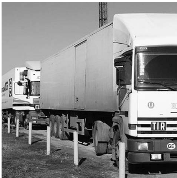
АВТОВАЗ СОЗДАЛ единую логистическую службу