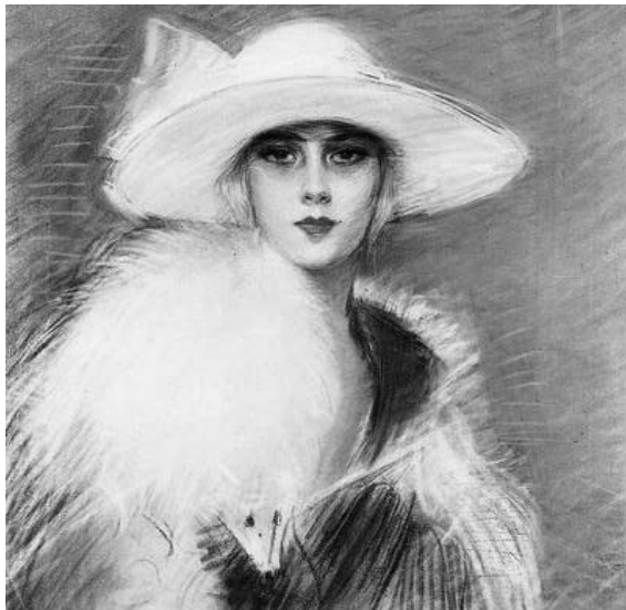
ВЫСТАВКА САМАРСКИХ авторов в Художественном салоне посвящена женщинам и их красоте