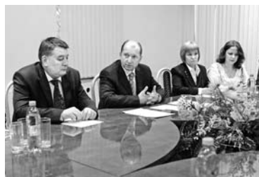
ВЛАДИМИР АРТЯКОВ сообщил медикам о планах регионального правительства по введению «подъемных» для медсестер

Вопрос о необходимости введения «подъемных» для медсестер и фельдшеров глава