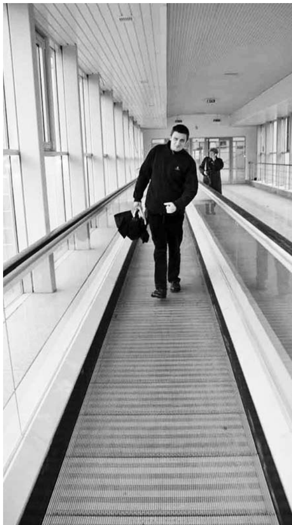
ПО ДАННЫМ СК, посетители «Парк Хауса» снова вынуждены пользоваться сломанным траволатором