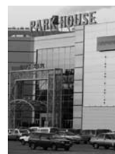
ТЦ «ПАРК ХАУС» управляет сразу несколько компаний