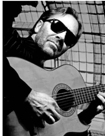
ЭЛ ДИ МЕОЛА выступит в Самаре 8 марта

8 марта Самарская государственная филармония приглашает на концерт американского гитариста Эла Ди Меолы и его группы. В мире музыки его по праву считают культовым исполнителем. А иначе и не скажешь о создателе собственного стиля, экспериментаторе-виртуозе, исполняющем музыку на стыке джаза и рока, босса-новы, цыганских напевов и танго. Обладатель 80 уникальных гитар, две из которых (джазовая и электрогитара) носят имя «Эл Ди Мео-