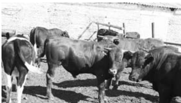
МОСКОВСКАЯ КОМПАНИЯ «РБИ» сливает свои самарские агроактивы