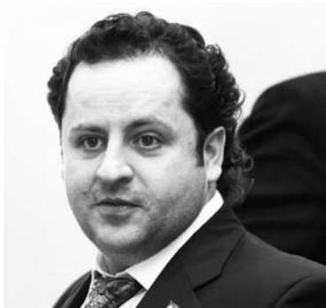
КОМПАНИЯ ВЛАДИМИРА ЯРКИНА в попытке сохранить 11,2 млн рублей пошла в апелляционный суд