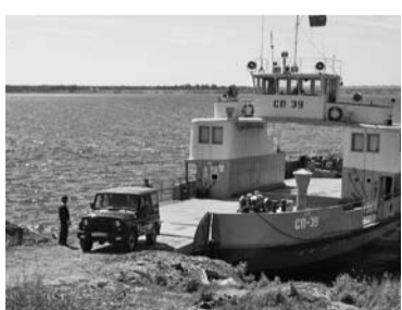
ПАРОМЫ «ТАТИЩЕВА» могут уплыть на погашение долгов перед кредиторами