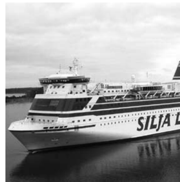
МЕЖДУ СТОЛИЦАМИ Скандинавии удобнее всего перемещаться на пароме