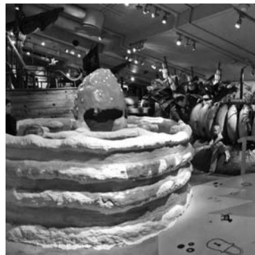
В ПАРКЕ «Юнибакен» можно встретить многих героев произведений известной писательницы Астрид Линдгрен