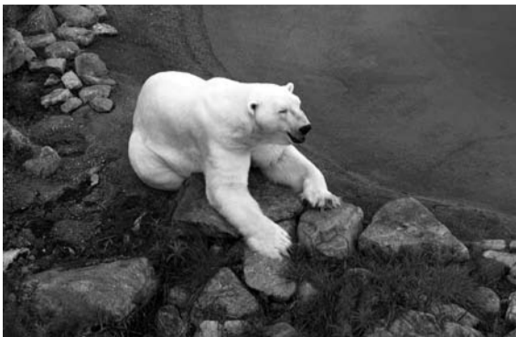
В ЗООПАРКЕ Рануа условия обитания животных максимально приближены к естественным