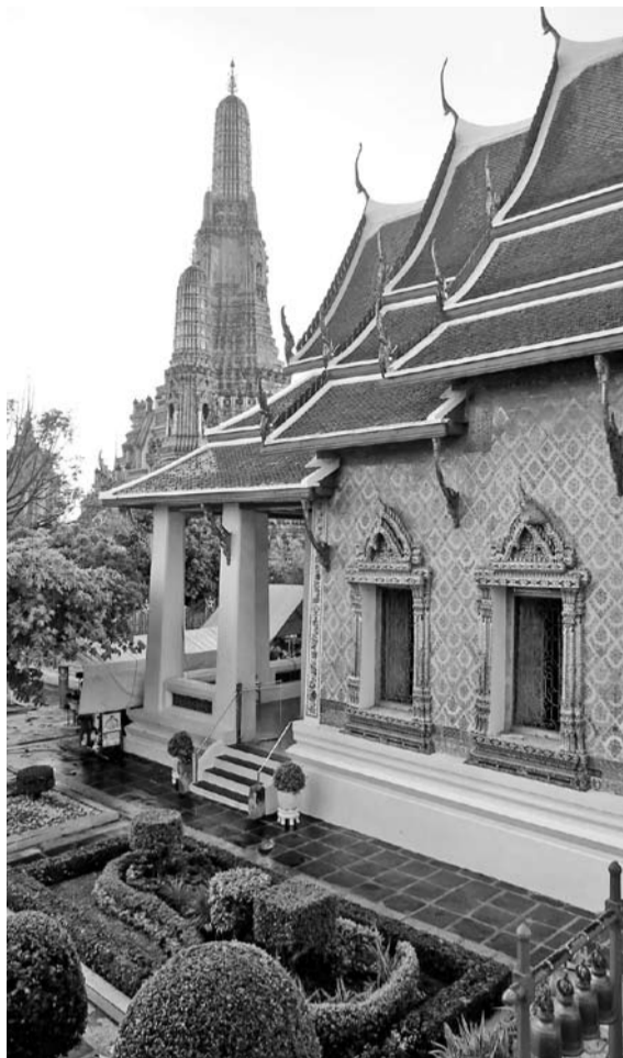
INDIGO PEARL 5* состоит из двух- и трехэтажных корпусов, а также вилл, расположенных в саду

В отеле Indigo Pearl 5* можно забронировать один из предлагаемых экологических маршрутов, в том числе велосипедную прогулку, путешествие на водопады или пешие экскурсии. Также в отеле располагается спа-центр, пакет услуг которого можно приобрести при бронировании номера. До конца марта действует специальное предложение, в рамках которого постояльцам предоставляется скидка на спа-процедуры до 50%.