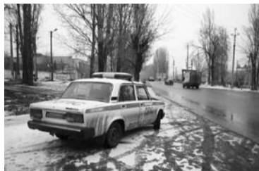
ПОЛИЦИЯ САМАРЫ почистила свои ряды от взяточников