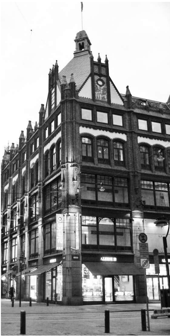
ЭКСКУРСИОННЫЕ ТУРЫ по Финляндии зачастую комбинируют с поездками в соседние скандинавские страны

Другой сказочный тур - «Муми-тролли, Карлсон и Пеппи Длинныйчулок». В эту программу, помимо экскурсии по Хельсинки, посещения аквапарка «Карибия» и Страны Муми-троллей, включено еще несколько поездок. Во-первых, туристы побывают в парке сказок «Юнибакен». В течение часа экскурсовод расскажет об истории парка и о том, что в нем можно увидеть. Затем можно будет погулять самостоятельно, зайти в гости к Пеппи и встретить других героев книг Астрид Линдгрен, например, Эмиля из Леннеберги или Петсона. Во-вторых, завершится путешествие экскурсией по Стокгольму. Кроме посещения Дворцовой площади и других достопримечательностей города, экскурсанты увидят Ратушу, известную многим как место проведения Нобелевских банкетов. В пакет услуг входит размещение в отелях на базе завтраков, входные билеты по программе, круиз на пароме Турку - Стокгольм - Хельсинки, услуги гида. Переезд до Хельсинки оплачивается дополнительно. Стоимость тура - от 68 тыс. рублей (отель 4*). ■