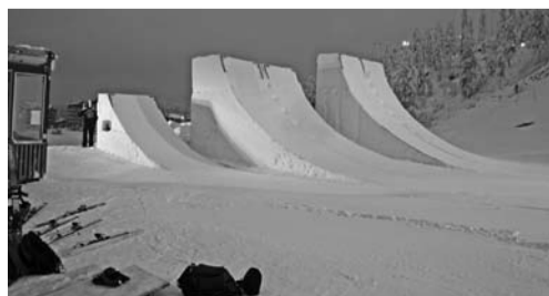
ГОРНОЛЫЖНЫЙ КУРОРТ Рука предоставляет возможности для катания лыжников любого уровня подготовки

Завершить горнолыжный сезон этого года можно на финском курорте Рука (компания PAC GROUP). Оборудованные склоны подойдут как для начинающих лыжников, так и для более опытных любителей активного отдыха. Кроме того, в Руке проложено более трехсот километров беговой лыжни и имеются специальные трассы для детей. Функционирует и фристайл-центр, а также парк развлечений Batterypark. Сноубордисты могут отправиться на трассы с хаф-пайпами, трамплинами, рейлами и специальными поворотами. В местной слаломной школе Ruka Ski School финские лыжники и инструкторы дадут при необходимости консультацию или несколько уроков катания. На весенние каникулы можно отправиться с заездом 24 марта: продолжительность тура 8 дней, стоимость - от 74 тыс. рублей на двоих. В пакет включены проживание в отеле на базе завтраков, групповые трансферы и авиаперелет Москва - Хельсинки - Куусамо - Хельсинки - Москва. Предлагаемое размещение - в отелях 4* Kuusamo Tropikki, Rantasipi Rukahovi, а также апартаментах Karhunvartija.