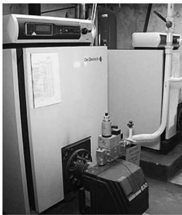
ОАО «НЕФТЕМАШ» надеется сократить расходы на теплоснабжение