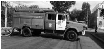
ЦЕНТР ПО ДЕЛАМ ПОЖАРНОЙ БЕЗОПАСНОСТИ закупит автоцистерн на 78,8 млн рублей