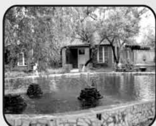
пансионат "Лада" тел. 8 (86148) 6-38-07

ООО "Соцкультбыт-АВТОВАЗ" приглашает для отдыха в санаторий-профилакторий "Алые паруса", на базы отдыха: