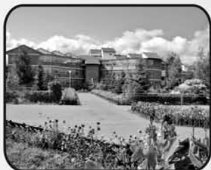
"Стрежень" тел. 8(8469)77-57-38