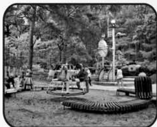
"Голубая гавань" тел. 89278910415