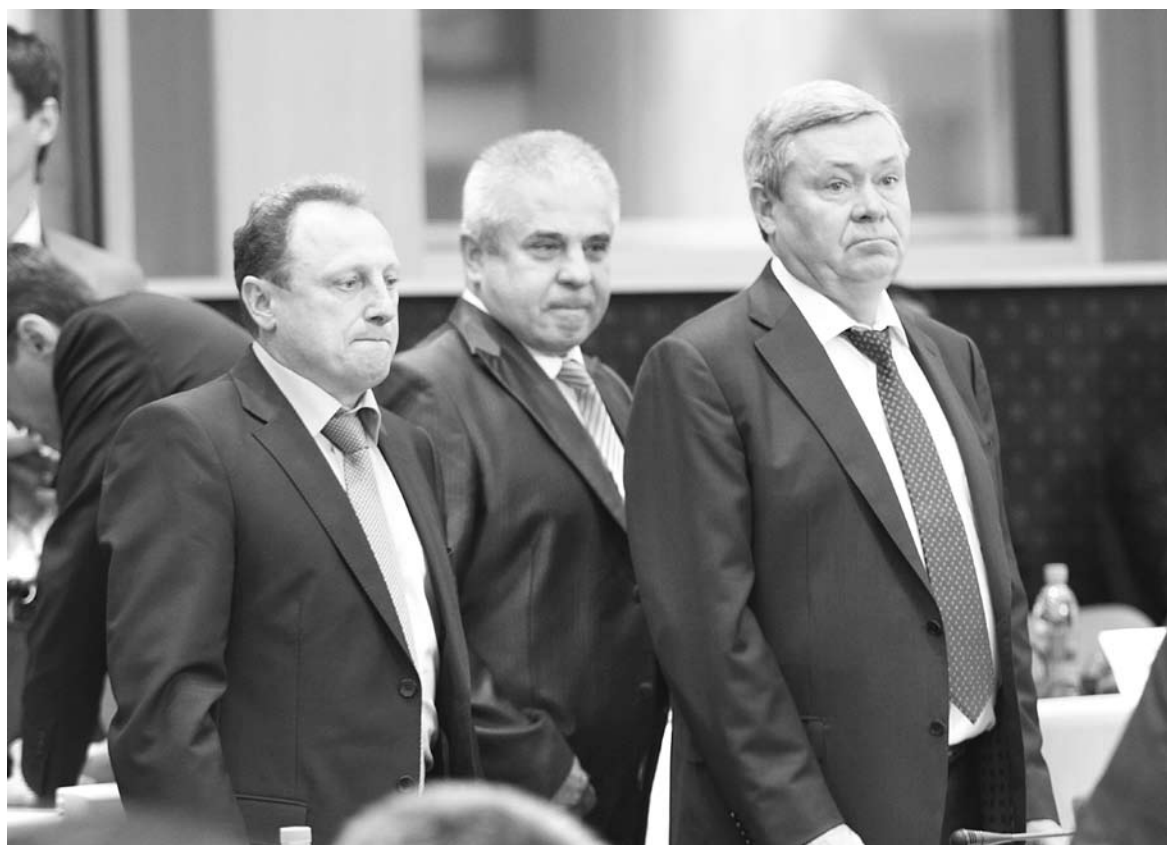
ПЕРЕД НАЧАЛОМ пленарного заседания лица врио вице-губернаторов были напряжены, но, похоже, некоторые наблюдатели уже знали, как разрешится интрига в их карьере