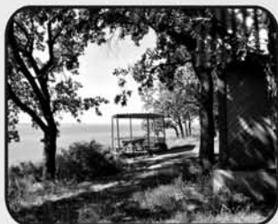
"Поршень" тел. 63-19-72