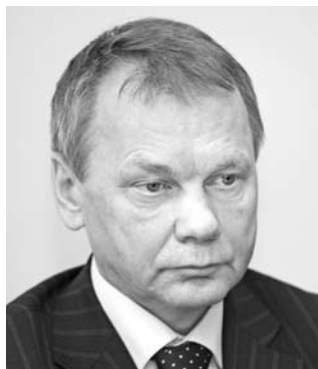
ИВАН БАБУШКИН, назначен и.о. министра промышленности и технологий Самарской области 7 октября 2011 года