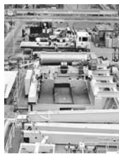
В МОРДОВИИ ликвидировали минпром за ненадобностью

При этом бюджетное финансирование отрасли осуществляется по остаточному принципу. Согласно данным на 2012 год, общий бюджет Мордовии составил 30 млрд рублей, а объединенному министерству было выделено только 10 млн рублей. По мнению председателя Союза работодателей Самарской об-