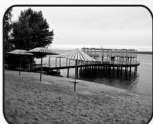
"Усинская" тел. 66-41-17