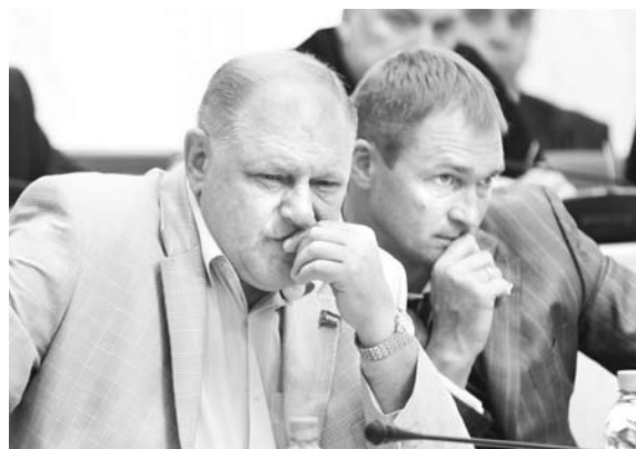
ВОПРОСЫ НОВЫМ министрам задавали не все депутаты...