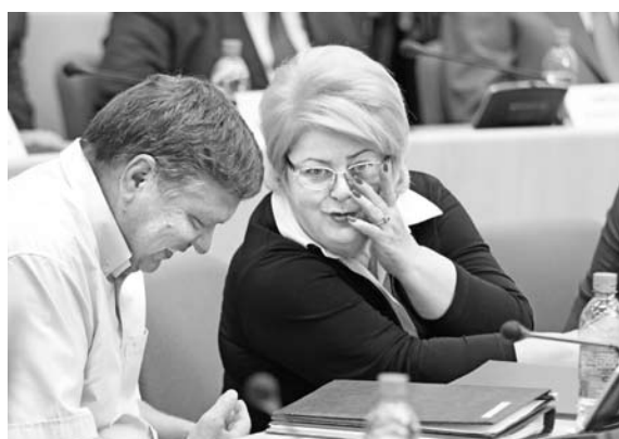
МНОГИЕ ПРЕДПОЧИТАЛИ загадочно молчать или делиться впечатлениями в тесном кругу