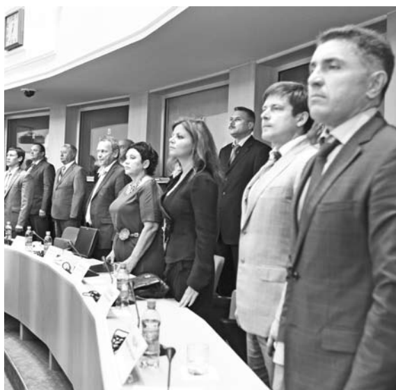
ГРУППЫ ВЛИЯНИЯ в новом правительстве Николая Меркушкина выделяются с большим натягом

Губернатор, комментируя кадровые назначения сразу после пленарного заседания губернской думы, подчеркнул, что исходил прежде всего из принципов «честности, порядочности и профессионализма представленных кандидатов». Этим же он объяснил свой выбор в пользу двух вице-губернаторов: Александра Нефедова и Алексея Бендусова. Первый возглавил областное правительство, второй – адми-