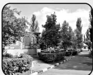
"Дружба" тел. 45-11-09