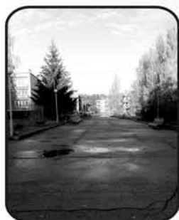
"Алые паруса" тел. 70-76-06