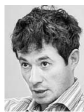
СЕНАТОР ВАДИМ МОШКОВИЧ

из-за конфликта на МЭЗе может пересмотреть свои планы в Самарской области