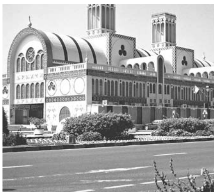
ЗНАМЕНИТЫЙ РЫНОК Blue Souk в Шардже. Здесь можно приобрести магниты на холодильник, холодильник и ковер, на котором он будет стоять

В Шардже, в лагуне Халид, работает крупный рынок Blue Souk, построенный в соответствии с исламскими канонами. В переводе его название означает «голубой рынок» (внутри рынка стены облицованы плиткой голубого цвета). Здание представляет собой два крыла, соединенных между собой тоннелями-галереями, похожими на мосты. В одном крыле продаются самые разнообразные товары, сувениры и электроника, в другом же расположены магазинчики, торгующие золотом, драгоценными камнями и ювелирными изделиями. Blue Souk включает в себя 600 магазинов (все они оснащены кондиционерами), а также обширную территорию для прогулок. В общем, на обычный рынок это место совсем не похоже. Скорее, это большой торговый центр. По широкой центральной лестнице или по одной из нескольких дополнительных лестниц можно подняться на верхние этажи с их многочисленными магазинами, расположенными вдоль узких проходов. Если нет времени или желания бродить по небольшим рынкам Шарджи, а хочется разом приобрести сувениры, одежду, золото и, например, ковер, то смело отправляйтесь сюда за покупками.