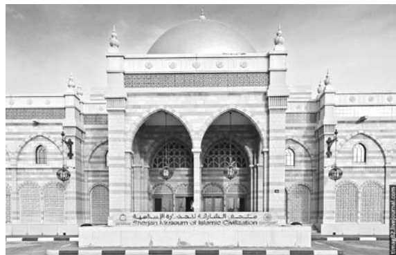
МУЗЕЙ Исламской цивилизации в Шардже