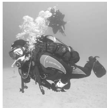
ИЗ ШАРДЖИ можно отправиться на экскурсию морского дна в эмират Фуджейра