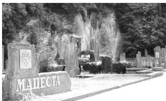
В СОЧИ в период с октября по май устанавливается комфортная температура для проведения лечебно-оздоровительных программ

С 15 октября в Сочи стартует ставшая уже традиционной программа «Открытый Юг». С этого дня и до 15 мая 2013 года есть возможность отдохнуть на море со скидкой до 50% и даже более. Цены на путевки стартуют от 1150 рублей в день. В программе участвуют следующие здравницы: «Олимпийский-Дагомыс» (скидка до 58,6% - от 1200 рублей за ночь), «Знание» (до 29,2% - от 1150 рублей за ночь), «Русь» (стоимость проживания от 1875 рублей, скидки до 13%), заезды в «Южное взморье» (скидка до 54% - от 1390 рублей). От 1350 рублей стоит одна ночь в «Факеле» со скидкой 34%. Также акция действует в сочинском оздоровительном комплексе «Спутник» - цена от 1350 рублей с учетом скидки 22,8%. Обратите внимание, что минимальный