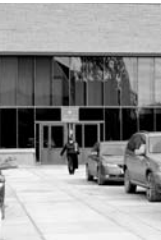
КОЛЯСОЧНИКИ СМОГУТ беспрепятственно попасть в здание казначейства