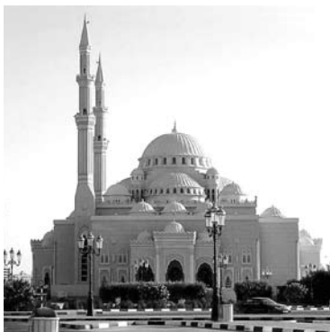
МЕЧЕТЬ КОРОЛЯ ФЕЙСАЛА вмещает в себя одновременно до 3 тысяч верующих и является местом паломничества мусульман