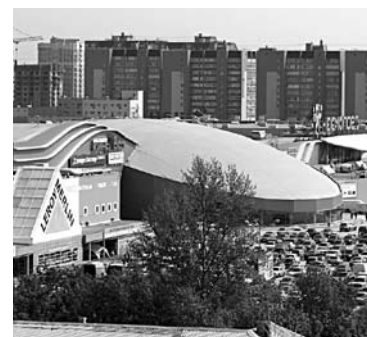
ЕКАТЕРИНБУРГСКИЙ ДИСТРИБЬЮТОР товаров для дома разместится в цоколе ТРК «Космопорт»