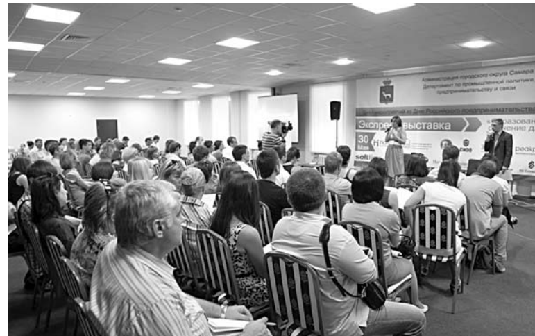
ПРОФЕССИОНАЛЬНЫЙ ПРАЗДНИК предпринимателей в Самаре отметят обширной программой бизнес-мероприятий

10 июня в отеле «Ренессанс» состоится региональный форум «Линия успеха», организованный министерством экономического развития, инвестиций и торговли Самарской области. В программе: мастер-класс «Эффективный бизнес» от ведущего бизнес-консультанта по продажам Игоря Манна (г. Москва), открытая дискуссия «Успешный бизнес. Движение вперед», презентации субъектов малого и среднего предпринимательства в рамках межрегиональной Деловой миссии. Также в рамках форума состоится чемпионат по стратегии и управлению бизнесом Global Management Challenge на Кубок Самарской области. ■