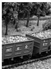
В «ФГК» рассчитывают во втором полугодии увеличить погрузку в полтора раза