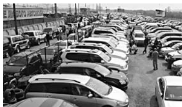
ВЛАДЕВШУЮ НЕКОГДА крупнейшим в Самаре авторынком компанию обязали оплатить аренду