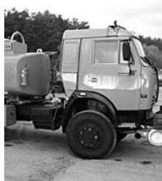
НА ВРЕЗКЕ использовался «автомобиль-двойник» легального тягача из Санкт-Петербурга