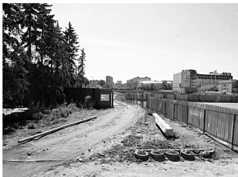
ДОПОЛНИТЕЛЬНАЯ транспортная артерия в микрорайоне «Самара-Центра» так и не появится

В 2011 году городская администрация пыталась договориться с «Самара-Центром» о внесении изменений в проект. Тогда представители мэрии полагали, что в квартале следует предусмотреть автомобильную дорогу, соединяющую ул. Челюскинцев и ул. Киевскую. В «Самара-Центре» не увидели необходимости в оптимизации автомобильного трафика будущего микрорайона. Договориться с городом и инвестором не удалось. Согласно размещенным в администрации Октябрьского района материалам проекта, вписанный в существующую дорожную сеть сквозной проезд так и не появится. В таком виде проект вынесен на публич-