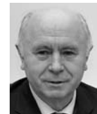
НИКОЛАЙ МЕРКУШКИН, губернатор Самарской области

трий Буш считает, что на совещании в областном правительстве был найден вариант, который «объединит в себе черты купола как интересной архитектурной формы, видимой со значительного расстояния, и вместе с тем приобретет архитектурные черты, вызывающие ассоциации с космическим объектом». Кроме того, будут сокращены сроки изготовления и монтажа кон-