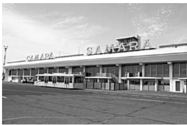
ЗА КОНТРАКТЫ на страхование имущества «Курумоча» поборются одиннадцать компаний

тайфуны, паводки и наводнения, но и действия, связанные с человеческим фактором, например, «ошибки при монтаже», «противоправные действия третьих лиц, кража, разбой, вандализм», а также «любые иные внезапные и непредвиденные события на строительной площадке, специально не исключенные договором страхования». Во второй лот со страховой суммой 1,3 млрд рублей вошли услуги по страхованию передаваемого в залог имущества («Курумоч» намерен заложить имущество во Внешэкономбанке, который станет основным кредитором строительства нового терминала). По данным протоколов, за первый лот будут бороться ОАО «АльфаСтрахование», ЗАО «САО