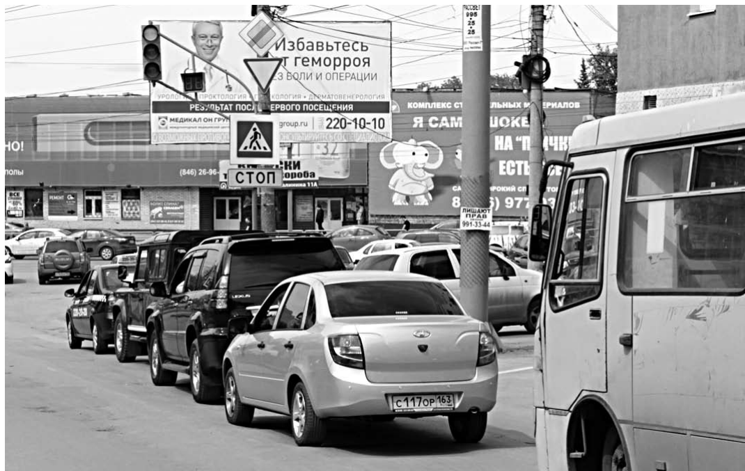
Жителям микрорайона «Самара-Центр», скорее всего, каждый день придется бороться за въезд на городские дороги

Главный архитектор города может просто не утвердить этот проект. Рычаги влияния – это общественные слушания и работа архитектуры города, которая и должна говорить о том, что «нас не устраивает, что мы здесь делаем застроенный закрытый квартал, который прервет проезд до улицы Киевской, и т.д.».