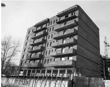
«КРИТ» АНОНСИРУЕТ сдачу своего долгостроя