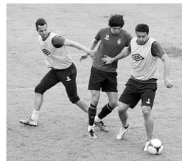
ПЕРВЫЕ ТРЕНИРОВКИ после отпуска «Крылья» начали без Ангбвы и Горо