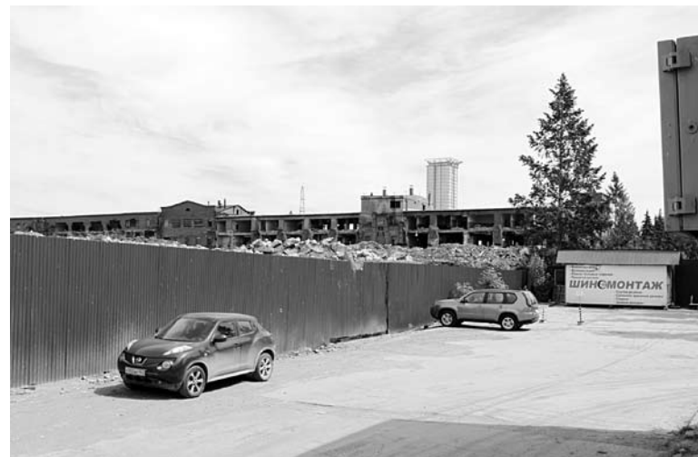
ЧИНОВНИКИ ОТЛОЖИЛИ утверждение проекта ООО «Самара-Центр» для более детальной проработки проблемных вопросов