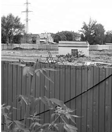
ВЛАДЕЛЬЦЫ КОМПАНИИ «Самара-Базис» пытаются пополнить земельный портфель площадкой в Красноглинском районе

ООО «Соколы горы» пытается приобрести земельный участок площадью 9 тыс. кв. м на ул. Сергея Лазо в Красноглинском районе по цене, равной 2,5 % кадастровой стоимости. На этой площадке у организации находится нежилое помещение площадью 65,5 кв. м. В связи с этим компания планировала выкупить площадку по льготной цене - за 400 тыс. руб. Кадастровая стоимость участка составляет 63,9 млн руб. С 2010 по 2012 год ООО пыталось заключить договор купли-продажи участка, находящегося в федеральной собственности. Однако ТУ Росимущества решение о