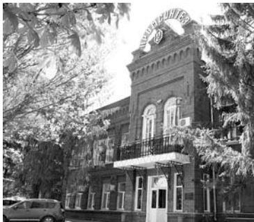
ПРИ НЕЗНАЧИТЕЛЬНОМ РОСТЕ выручки «Промсинтез» увеличил чистую прибыль в 2,2 раза

вторую – с 295,3 млн до 193,3 млн рублей. Как сообщается в финотчетности завода, инвестиции в основной капитал в прошлом году составили 58,1 млн рублей. Среди наиболее важных реализованных проектов в документе называются модернизация системы пароснабжения цехов с монтажом парового котла ДЕ-25-14, модернизация системы теплоснабжения цехов с монтажом водогрейного котла, реконструкция химводоподготовки котельной № 4, модернизация системы концентрирования слабой серной кислоты с вводом в эксплуатацию концентратора 5. ОАО «Промсинтез» зарегистрировано в 1997 году и занимается производством органических хими-