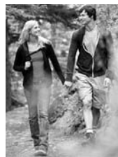
БАЗА ОТДЫХА «Росинка» доказала свои права на асфальтные дорожки