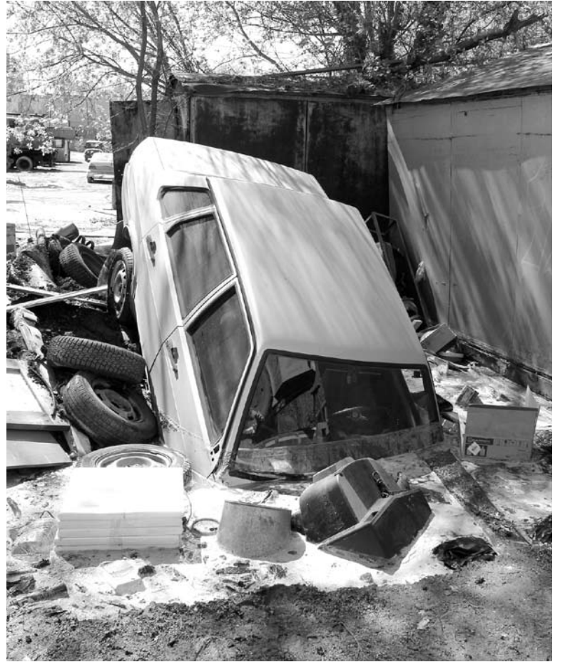
УСТАНОВКА ГАРАЖЕЙ над коммуникациями - рискованное дело

«В этом году намечено демонтировать около тысячи незаконных объектов, относящихся к потребительскому рынку. Может быть, в эту тысячу попали объекты, мешающие ремонту сетей. А если нет, мы готовы отработать конкретные адреса и провести демонтаж», - пояснил он. ■