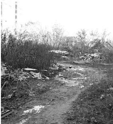
МЭРИЯ САМАРЫ сформировала участок для «ЦентрПроектСтроя»

ООО «ЦентрПроектСтрой» вновь пытается построить гостиницу. О проекте строительства гостиничного центра компания заявила еще в 2010 году. Многоэтажное торгово-офисное здание с гостиничными номерами, залами встреч и собраний, рестораном и парковкой планировалось построить в границах улиц Арцыбушевской и Вилоновской в Ленинском районе. Площадь участка составляет 2084 кв. м. Тогда заявка была отклонена комиссией по застройке и землепользованию, поскольку запрашиваемая площадка расположена в зоне Ж-4 (многоэтажная жилая застройка). Компания вновь предприняла попытку согласовать проект в 2011 году, однако безуспешно. В конце прошлого года «ЦентрПроектСтрой» потребовал признать отказ в