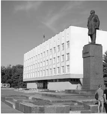
МЭРИЯ СЫЗРАНИ не изменила себе в выборе поставщика жилья