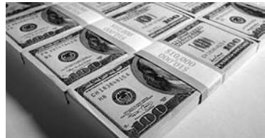
БЫВШЕМУ ДИРЕКТОРУ ВНИИТнефти не придется платить по долгам компании