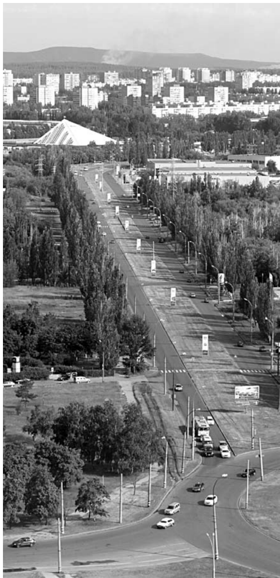
ТЕЛЕКОМ-РЫНОК Тольятти уплотняется