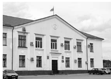
ОКТЯБРЬСКОМ будут править по-новому

Согласно предлагаемым корректировкам, депутаты ликвидировали организационно-правовое управление, а три отдела, подчиненные ему, перевели в ведение главы администрации Октябрьска.