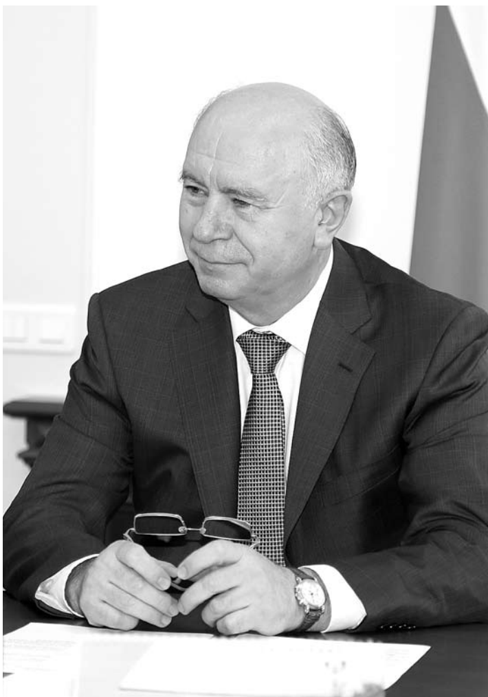
НИКОЛАЙ МЕРКУШКИН обсудил в Москве ключевые вопросы развития Самарской области

На встрече Николая Меркушкина с министром промышленности и торговли РФ Денисом Мантуровым разговор шел о стабильных федеральных заказах для промышленных предприятий Самарской области, работающих на оборонный комплекс страны.