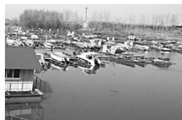
«СТРОИТЕЛЬНЫЕ ТЕХНОЛОГИИ» добиваются участка для лодочных станций

ООО «Строительные технологии» в арбитраже пытается обязать областное министерство строительства признать незаконным отказ в предоставлении ему в аренду площадки. В декабре прошлого года министр отказал «Строительным технологиям» в предоставлении земельного участка площадью 4,1 тыс. кв. м. Участок находится в Кировском и Промышленном районах, по Девятой просеке между шестой и седьмой линиями. Там ООО