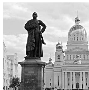
САМАРСКАЯ ТПП оценит гостиницы Саранска