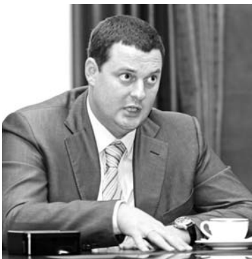
ПЕРМСКОЕ ТУ РОСИМУЩЕСТВА не отдает компании, близкой Шаповалову, 4,3 тыс. га земель

ТУ Росимущества в Перми оспаривает в апелляции решение нижестоящей инстанции, предполагающее отдать в аренду ЗАО «Комсомолец» земельные участки площадью 4,3 тыс. га. В конце мая прошлого года территориальное управление Федерального агентства по управлению государственным имуществом (ФАУГИ) в Пермском крае провело торги по продаже права аренды сроком на 10 лет девятинадцати земельных участков. Площадки расположены в сельском поселении Гамовское. Победителем аукциона стало самарское ЗАО «Комсомолец», аффилированное