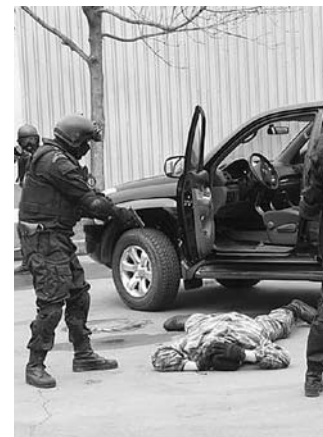
С САМАРСКИМ КОНТРАФАКТОМ приехали бороться московские полицейские

Не только Самарская область в январе стала полем зачистки производителей контрафактного алкоголя. По данным МВД РФ, в пятницу, 31 января, в Томске полиция изъяла одиннадцать наименований поддельной алкогольной продукции объемом 3241 литр, стоимостью около 1,5 миллиона рублей, а также 1205 литров спиртосодержащей жидкости. Кроме того, 200 ящиков фальсифицированной алкогольной продукции изъято в Костроме, более 20 тысяч бутылок алкогольной продукции, маркированной поддельными федеральными специальными марками, на сумму более 3,5 млн руб., – в ЯНАО, 10 тысяч бутылок – в Тамбове, 812 литров «паленого» алкоголя – в Димитровграде. В деревне Майкино Великолукского района полицейские обнаружили и изъяли у местного жителя 759 литров поддельной водки, 57 литров коньяка, 70 литров виски и 131 литр вин. В Кировском районе Северной Осетии правоохранители задержали КамАЗ, перевозивший 6 тонн спирта без документов. Свыше 25 тысяч бутылок контрафакта на сумму более 5 млн руб. изъято в Ивановской области. Это показатели лишь за период с 28 по 31 января 2014 года. Однако даже на фоне этих победных реляций Самарская область выглядела рекордсменом по количеству изъятого спирта и прочих расходников для производства «левой» водки. Примечательно и то, что в других регионах России аналогичные операции проводились только местными силовиками и лишь в Самарскую область для осуществления изъятий были откомандированы из Москвы оперативники ГУЭБ и ПК МВД России.