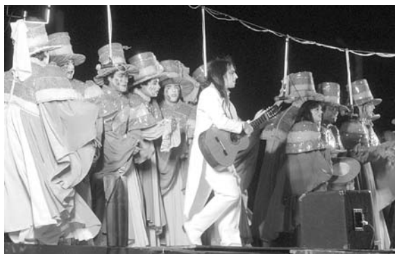
КАРНАВАЛ ПРОХОДИТ под музыку и представления местных артистов

Февраль - один из самых жарких месяцев, как бы абсурдно это ни звучало. Это месяц карнавалов. Ранее «СО» уже писало о подробностях карнавала в Ницце и Венеции. Теперь переместимся еще южнее - на Канарские острова. Многие предпочитают Канары летом - мягкая теплая погода, лазурный берег, спокойствие и море в сочетании с отличным уровнем сервиса. Зимой здесь не так жарко - в конце февраля температура не поднимается выше 23 градусов тепла, но на улице царит совсем иная форма жары. Главные события пройдут с 26 февраля по 9 марта 2014 года, однако дух карнавала витает в воздухе уже с конца января, когда начинается активная подготовка, репетиции и различные мероприятия. Вообще, указанные даты носят довольно условный характер. Потому как официальное открытие пройдет 28 февраля, но статус праздника «Избрание королевы» высок настолько, что многие ведут отсчет именно с этого события. Карнавалом на Тенерифе встречают весну. Календарную. Потому как весна здесь практически круглый год, кроме лета, когда здесь и правда лето.