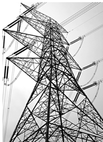
ЭНЕРГЕТИКИ пробивают дно