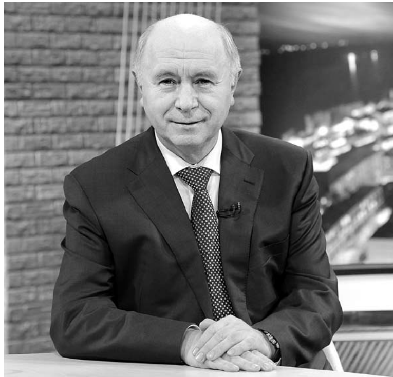
НИКОЛАЙ МЕРКУШКИН предупредил местные власти о возможных санкциях за нерасторопность

Советник губернатора Виктор Кузнецов предостерегает масштабные изменения в системе муниципальной власти региона. «Подобные проявления были и раньше, но то, что это и сейчас происходит, показывает, что система слишком инерционная, - говорит он. - Вот эту инерционность и нужно стряхнуть, потому что в режиме «спящего удава» нам вряд ли удастся решить какие-то задачи». ■