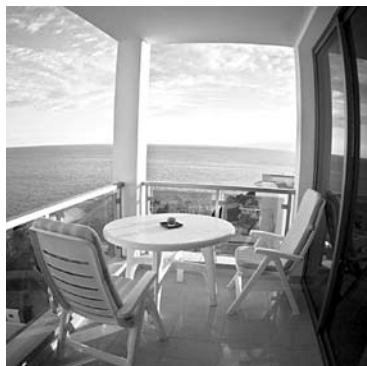
ВЫБИРАЙТЕ ОТЕЛЬ с террасой и видом на океан