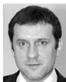
СЕРГЕЙ БЕЗРУКОВ, министр промышленности и технологий Самарской области

Мы ничего не знаем о предстоящих увольнениях. И подлинная картина происходящего на «Пластике» нам неизвестна. И, конечно же, определенная проблема с трудоустройством в Сызрани для этих людей возникнет. В Сызрани в настоящее время проживают 180 тысяч человек. Из них экономически активны примерно 100 тысяч. Соответственно, мы говорим об увольнении 0,3-0,8% от общего трудоспособного населения. С одной стороны, это много, но думаю, что город с этим справится. Здесь есть Сызранский НПЗ, есть «Тяжмаш», которые расширяются, есть бизнес мелких предпринимателей. Разумеется, временные трудности возникнут, но, думаю, постепенно они разрешатся. Вопрос еще в том, какого возраста люди будут уволены. Если хорошие специалисты молодого возраста, то они найдут работу, а если пенсионеры, то у них, с одной стороны, уже есть пенсия. Другой вопрос, что администрация города должна быть в курсе подобных событий, тогда уже можно было бы что-либо предпринимать.