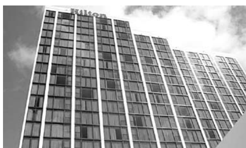
ТЕОРЕТИЧЕСКИ ПРЕТЕНДОВАТЬ на 5 звезд может пока только будущий самарский «Хилтон»

Впрочем, даже если гостиница и будет построена в отведенные сроки, не факт, что она сможет получить так необходимые Самаре 5 звезд. Дело в том, что аналогичные отели класса «Хилтон Гарден Инн» во всем мире позиционируются как четырехзвездочные гостиницы. Ранее менеджмент «Авиакора» и «Хилтона» ни разу не говорил о том, на какое число звезд будет претендовать самарский отель.