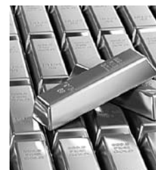
МЕТАЛЛЫ РАЗОЧАРОВАЛИ инвесторов