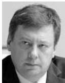
ОЛЕГ ФУРСОВ, министр занятости и миграцион- ной полити- ки Самарской области

Согласно закону о предстоящих массовых увольнениях, нас руководство предприятий должно оповещать за два месяца. Никаких сообщений от руководства «Пластика» нам не поступало. Никаких заявок у нас нет, и мы ничего об этом не знаем. Могу, однако, сказать, что уровень безработицы в Сызрани относительно невысокий, и увольнение 300-800 человек в принципе не приведет к катастрофической ситуации. Количество трудовых вакансий в области в 2,5 раза превышает количество уволенных. Потом - необходимо понять, по какой причине произойдут вышеозначенные сокращения: обычно увольняют людей пенсионного и предпенсионного возраста. И если это связано с модернизацией производства, то все не так страшно. А вот если это связано с отсутствием на предприятии заказов, то уже намного хуже. В данный момент в Сызрани, по последним данным, 400 человек имеют официальный статус безработных, при этом есть 1,5 тысячи вакансий. Уровень безработицы составляет 0,5% - довольно низкий.