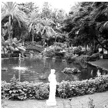
НА ТЕНЕРИФЕ есть несколько десятков хоро- ших отелей. На- пример, Botanico Oriental Garden - место с изуми- тельной террито- рией и отличным спа-комплексом. Есть свободные места на даты проведения кар- навала