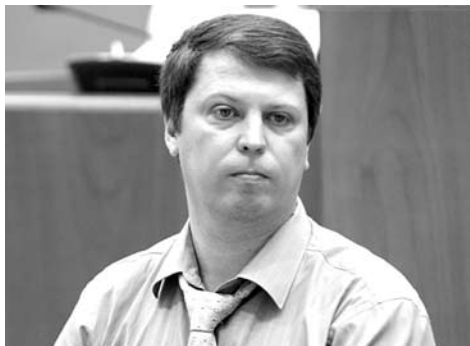
МИХАИЛ МАТВЕЕВ, депутат Самарской губернской думы