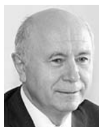
НИКОЛАЙ МЕРКУШКИН , губернатор Самарской области. Родился: 5 февраля 1951 года.

В думе г.о. Самара пройдет заседание комитета по образованию и науке. Депутаты обсудят ход ремонтных работ в зданиях общеобразовательных учреждений, закрытых на капитальный ремонт.