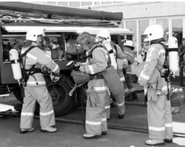
ВОЛЖСКИЙ РАЙОН не будет платить Новокуйбышевску за выезды на тушения пожаров