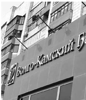
ЗАТРАТЫ НА КОНКУРСНОЕ ПРОИЗВОДСТВО в ВККБ за прошлый месяц составили половину поступлений в конкурсную массу

За прошедший месяц поступления в конкурсную массу банкротящегося Волго-Камского банка составили 10,18 млн рублей. Эта информация содержится в отчете Агентства страхования вкладов о ходе конкурсного производства в банке. Основную часть поступлений составили деньги, полученные от реализации имущества и взыскания задолженностей, – 9,979 млн рублей. Из иных источников организация получила 201 тысячу рублей. При этом затраты на конкурсное производство за данный период составили половину суммы поступлений – 5,271 млн рублей. Основная часть расходов пришлась на