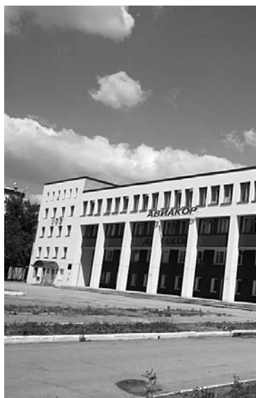
«АВИАКОР» УВИДЕЛ УГРОЗУ остановки производства