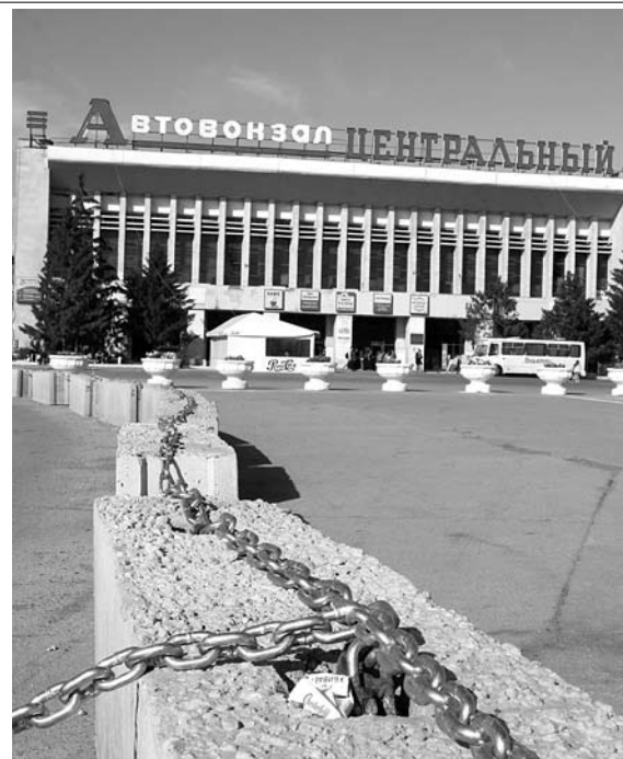
СОСЕДИ ФЭНИИ ХАКИМОВОЙ пытаются пробить транспортные коридоры через территорию Центрального автовокзала

(на ее взгляд) перевозчиками опутала часть площадки цепями и ограда бетонными блоками. Помимо маршруток и такси-стов пострадали и постояльцы «Октябрьской», и покупатели окрестных магазинов.