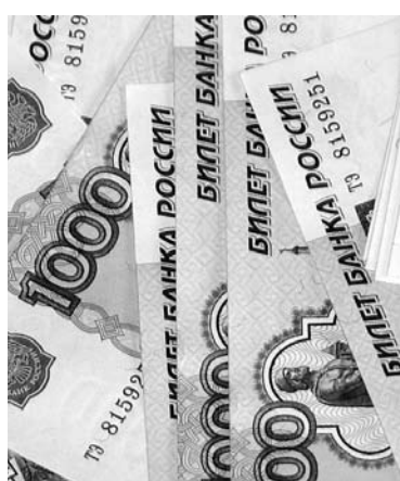
У САМАРСКИХ БАНКОВ все больше проблемных заемщиков