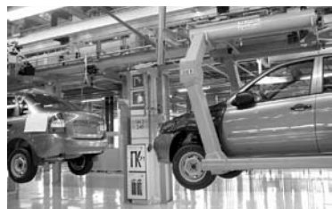
НА АВТОВАЗЕ становится меньше руководителей