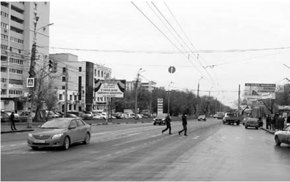
АУКЦИОННАЯ КОМИССИЯ вновь рекомендовала подписать контракт с ЗАО «Волгоспецстрой»

Рассмотрение жалобы запланировано на сегодня. Тем не менее вчера комиссия подвела