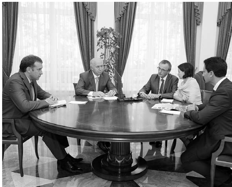
400 МЛН РУБЛЕЙ направили французские собственники на проекты завода «Электрощит»

К тому же подписаны инвестиционные соглашения с компаниями «ЛУКОЙЛ», Schneider Electric, Packard Bell, Bosch, Linde AG. В 2013 году число резидентов особой экономической зоны в Тольятти достигло 17 компаний, а объем планируемых инвестиций превысил 19 млрд рублей. ■