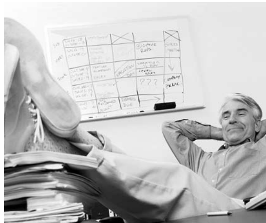
РОССИЙСКИЕ ПРЕДПРИЯТИЯ начали выплачивать дивиденды