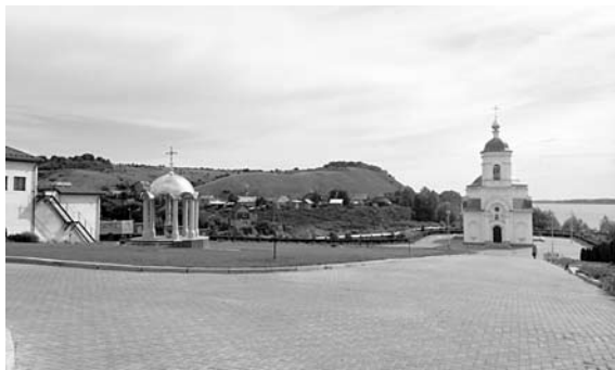
С КОЛОКОЛЬНИ открывается панорамный вид на Самарскую луку

понимаешь, что до тебя - твоей жизни и твоих проблем - жили и вершили историю миллионы других людей. На стенах видны остатки фресок - последние кусочки. Скоро совсем исчезнут.