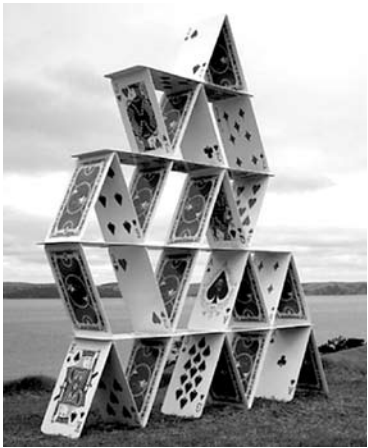
ЦЕНТРОБАНК ПРОДОЛЖАЕТ кампанию против недобросовестных микрофинансистов

Центральный банк исключил ЗАО «Крокос» из реестра микрофинансовых организаций. Как ранее сообщало «СО», регулятор уже обращал внимание на компанию и предостерегал от сотрудничества с ней и ей подобными организациями. ЗАО «Крокос», имеющее представительство в Самарской области, работает по схеме, ставшей известной благодаря «Древпрому». Компания предлагает за вознаграждение взять на себя обязательства по выплате кредита, взятого в банке. На данный момент это одна из самых