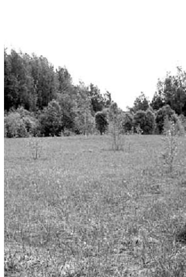
ЗАКОННЫХ ОСНОВАНИЙ для выделения земли прокуратуры не обнаружили