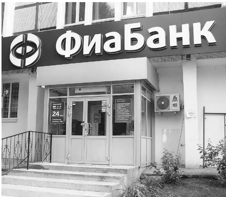
ФИАБАНК ОБЕСПЕЧИТ надежность исполнения как частных, так и государственных контрактов

Банковская гарантия подразумевает обязательство банка возместить в определенном объеме стоимость контракта, в случае, если поставщик его не выполнит.