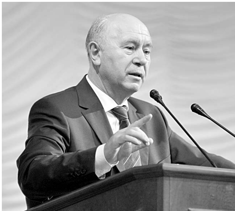
НИКОЛАЙ МЕРКУШКИН намерен поделиться влиянием со своими конкурентами