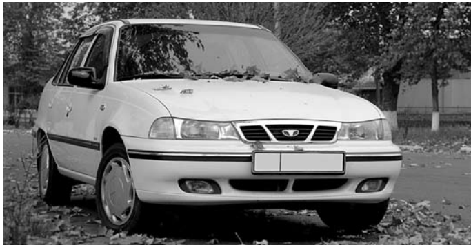
НАРКОТОРГОВЦЫ ВЕЗЛИ килограмм героина из Москвы на автомобиле Daewoo Nexia