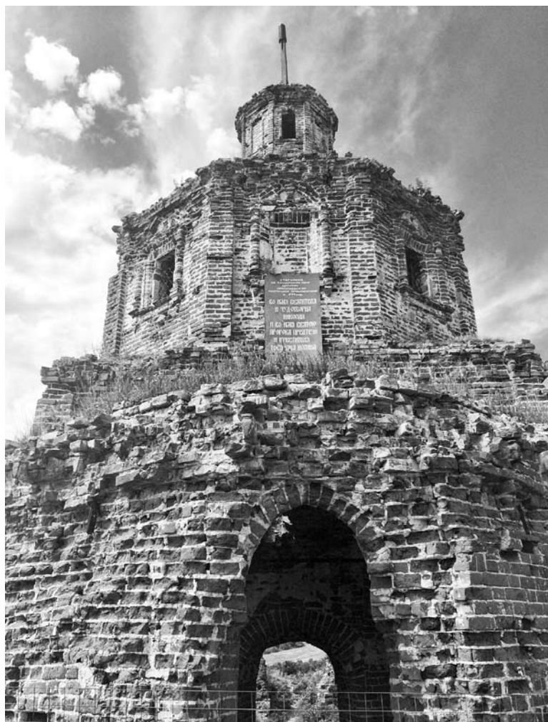
ЦЕРКОВЬ во имя Святителя Николая Чудотворца восстановлению не подлежит. Ежегодно сюда приезжают тысячи паломников

На весь путь ушло около 6 часов. 15-20 километров пешего хода. С отдыхом и перекусами. Обратно шли только по трассе - под библиканье мимо проезжавших авто. Если соберетесь в такой же путь, не забудьте взять с собой много воды, панаму на голову, средство от насекомых и обувь с плотной подошвой. Колонки с питьевой водой нам попались раза четыре, но, увы, не все они в рабочем состоянии. Поэтому не пренебрегайте - набирайте из той, которая окажется рабочей. Умывайтесь и мочите голову. ■