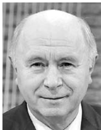
НИКОЛАЙ МЕРКУШКИН, исполняющий обязанности губернатора Самарской области

В первой половине 2014 года ЗАО «ГК «Электрощит»-ТМ Самара» нарастило количество договоров на поставку продукции на 30%, оборот предприятия увеличился на 5%. К концу года, по прогнозам руководства предприятия, увеличение объемов реализованной продукции составит 12%. «Уже в сентябре этого года планируется начать строительство нового завода по производству трансформаторов на Заводском шоссе в Самаре. Это позволит создать более 500