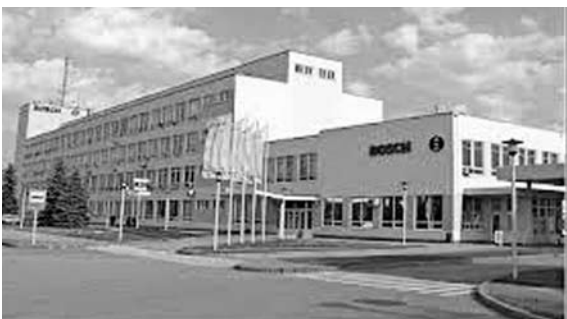
BOSCH , международный поставщик технологий и услуг, инвестировал в строительство завода по выпуску промышленных и газовых котлов более 20 млн евро. Площадка обеспечит 190 новых рабочих мест к 2016 г.

Самарская компания «АйБиЭль» завершила работы на заводе «Бош Термотехника» в городе Энгельсе. Открытие предприятия произошло 3 июля. На основании технологии данного производства специалисты компании «АйБиЭль» совместно с консультантами концерна Bosch в Штутгарте разработали и спроектировали концепцию технических решений всех инженерных систем завода. На основании этого был выполнен весь комплекс работ - от проектирования до монтажа и пусконаладки.