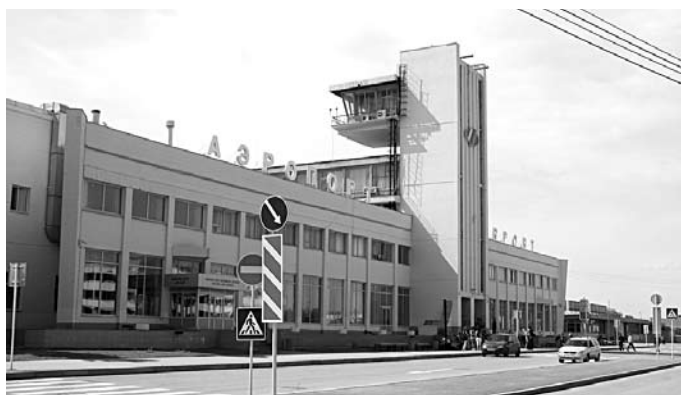
СТРОИТЕЛЬСТВО международного терминала подходит к концу