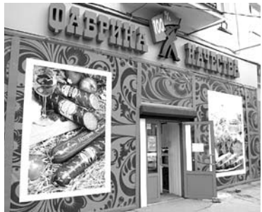
«УМЕЛЫЙ ПОСТАВЩИК» готовится стать частью «Фабрики качества»