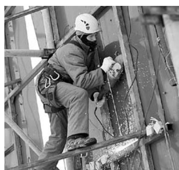
80 РЕКЛАМНЫХ конструкций снесут в Сызрани в ближайшее время

Срок исполнения не устанавливается. В списке подлежащих сносу конструкций - щиты на улицах Чапаева, Ф. Энгельса,