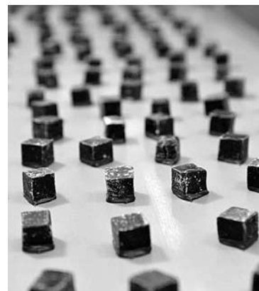
ТОЛЬЯТТИНСКАЯ ФАБРИКА SlaSti русифицируется