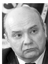
ВАЛЕРИЙ ФОМИЧЕВ, президент Торгово-промышленной палаты Самарской области

Запуск подобных производств в нашей области – это только плюс, это значит, что наш регион развивается. Сегодня активно идет программа энергосбережения. Вместе с тем мы более 40 лет не перевооружали наши заводы и предприятия, в результате на сегодняшний день себестоимость 1 единицы продукции на 70% составляют энергозатраты, а материалы и зарплата – на 30%. Хотя в любых европейских производствах наоборот. Новые заводы «Электрощита» в скором времени могут сделать возможным переоборудование региональных производств на новые энергоносители, более экономичные, что сделает продукцию наших предприятий конкурентоспособной на мировом рынке.