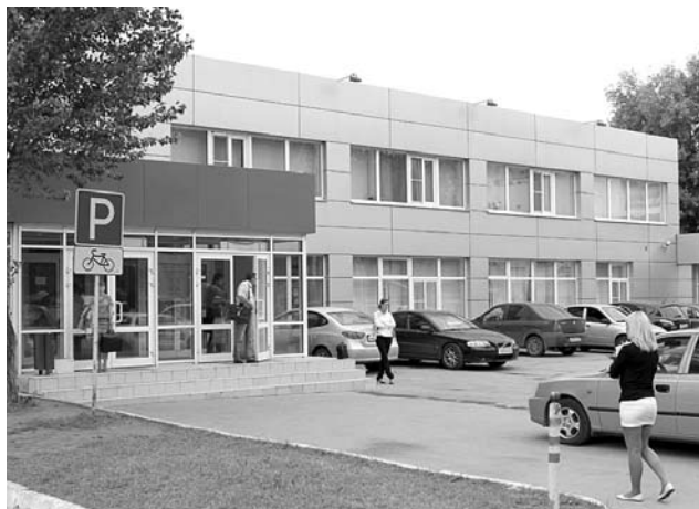
СУДЫ АРБИТРАЖА и правоохранители заинтересовались движением акций ЗАО «Старт-Перспектива»