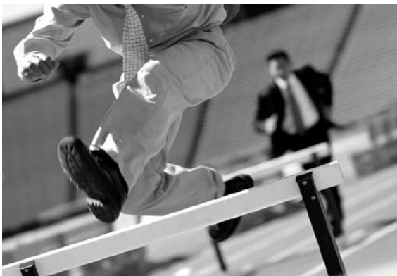
САМАРСКИЙ РЕГИОН по показателям мониторинга значительно отстает от соседей по ПФО

Филиалы головных вузов Самарского региона не только существенно сбавили обороты по сравнению с мониторингом 2012 года, но и значительно просели по сравнению с филиалами соседствующих по ПФО вузов. Так, в Республике Татарстан семь филиалов по итогам 2013 года набрали по 5-6 показателей с наивысшим значением: альметьевский, бугульминский, зеленодольский, набережночелнинский, нижекамский филиалы Института экономики, управления и права (6 из 7), казанский филиал негосударственного вуза «Российская международная академия туризма» (6 из 7), набережночелнинский филиал Поволжской государственной академии физической культуры, спорта и туризма (5 из 7). В Республике Башкортостан также 7 дочерних вузов по 4-5 показателям из 7 попали в предварительный список эффективных: башкирский филиал Академии труда и социальных отношений (4 из 7), стерлитамакский филиал Башкирского государственного университета (4 из 7), белорецкий филиал Магнитогорского государственного технического университета (4 из 7), стерлитамакский, октябрьский, салаватский, филиалы Уфимского государственного нефтяного технического университета (5 из 7), стерлитамакский филиал Уфимского государственного авиационного технического университета (5 из 7).