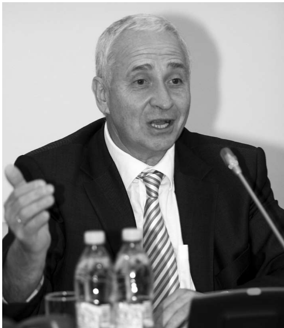
АГЕНТСТВО ВЯЧЕСЛАВА БУРАКОВА взыскивает деньги с должников Волжского социального банка

В течение мая в конкурсную массу банкротствующего Волжского социального банка удалось получить 33,691 млн рублей, преимущественно за счет реализации имущества должника и взыскания задолженностей. Эти данные были раскрыты в июне Агентством по страхованию вкладов, выполняющим функции конкурсного управляющего ВСБ. Объем расходов за месяц составил 5,1 млн рублей, половина из которых пришлось на заработную плату сотрудников банка (2,5 млн). Само агентство за проделанную по банкротству работу вознаграждения не получает. В течение отчетного периода управляющий подал четыре иска к должникам на сумму 155,7 млн рублей, пять исков о признании сделок недействительными, добился двух положительных решений по задолженностям к банку на 2,4 млн рублей. В целом на конец мая остаток денежных средств на счетах составлял 350,7 млн рублей. При этом объем задолженности банкрота перед кредиторами составлял 3,5 млрд рублей. На 615 кредиторов первой очереди приходится долг 1,45 млрд. Кредиторы третьей очереди (1739 кредиторов) надеются получить совокупно 2 млрд рублей. На 1 июня расчеты с кредиторами не производились.