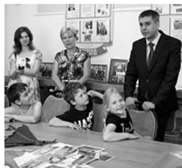
НА МУНИЦИПАЛЬНЫЕ центры социальной помощи семье и детям в Тольятти направят 20,33 млн рублей