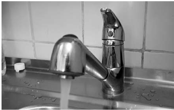
В БЕЗЕНЧУКЕ ищут варианты снабжения жителей поселка Сосновка питьевой водой

Проблемы с водоснабжением Сосновки начались в 2010 году, когда оказалось, что качество воды из пробуренной в поселке скважины не соответствует требованиям, и ее пришлось вывести из эксплуатации. После безуспешных попыток улучшить качество воды был сделан вывод о том, что восстановить скважину невоз-