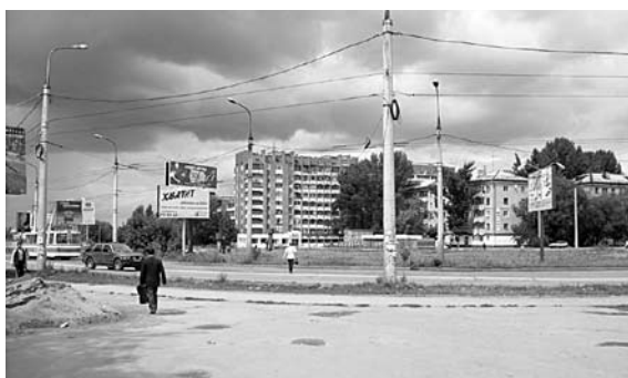
С ПЯТНИЦЫ по воскресенье в Самаре будет закрыт участок Московского шоссе на пересечении с ул. Луначарского