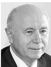
НИКОЛАЙ МЕРКУШКИН , исполняющий обязанности губернатора Самарской области

Единый фестиваль авторской песни имени Валерия Грушина с 3 по 6 июля собрал порядка 50-70 тысяч человек не только со всей России, но также из стран дальнего и ближнего зарубежья. Позже, рассказывая о своих впечатлениях от праздника бардовской песни, Николай Меркушкин процитировал одного из гостей фестиваля, заметившего: «Лучшего бренда для Самарской области, чем Грушинский фестиваль, быть не может». Подтверждением того, что Грушинский удался, стал и тот факт, что в нем приняли участие популярные исполнители. Некоторые из них ранее категорически отказывались приезжать на объединенную площадку и не верили в то, что можно объединить два фести-