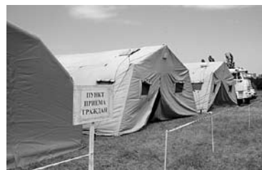
4440 УКРАИНСКИХ беженцев находились на территории Самарской области по состоянию на 19 августа

Сейчас Самарская область занимает 5-е место в России и 1-е в ПФО по числу граждан, прибывших из зоны украинского конфликта. На 19 августа в регионе находились 4440 беженцев, в том числе 1384 ребенка. Более 400 человек выказали желание участвовать в государственной программе «Добровольное переселение соотечественников»,