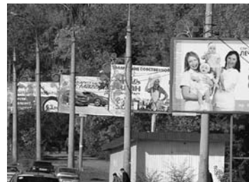
В ЖИГУЛЕВСКЕ объявили торги на 40 рекламных площадок

Администрация Жигулевска 15 августа объявила открытый аукцион на право размещения рекламных конструкций. На торги выставлено 40 площадок. Их общая стартовая цена составляет порядка 4,5 млн рублей. Максимальная цена - 152,9 тысячи рублей, минимальная - 5,6 тысячи рублей. В основном в перечне разыгрываемых конструкций - щиты с рекламным полем площадью 36, 18 и 5,4 кв. м на территории сел Солнечная Поляна, Александровское Поле, улиц Сызранской, Магистральной,