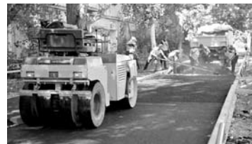
109,5 МЛН рублей потратят на ремонт дворов и проездов в Промышленном районе Самары

В Самаре объявлены торги на контракт по ремонту дворовых территорий многоквартирных домов и проездов к ним в Промышленном районе. Стоимость контракта - 109,5 млн рублей. Аукцион пройдет 5 сентября. Согласно аукционной документации, ремонт должен быть завершен не позднее 30 октября. В перечень работ входят ремонт борта с заменой тротуарного и дорожного бортового камня, ремонт асфальтобетонного