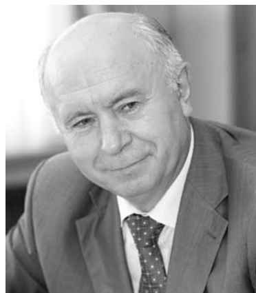
НИКОЛАЙ МЕРКУШКИН вошел в ТОП-3 самых популярных глав регионов