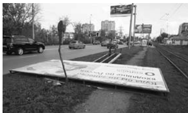
ДО 6,75 МЛН РУБЛЕЙ готовы потратить в областном минимущества на демонтаж 350 незаконных рекламных щитов