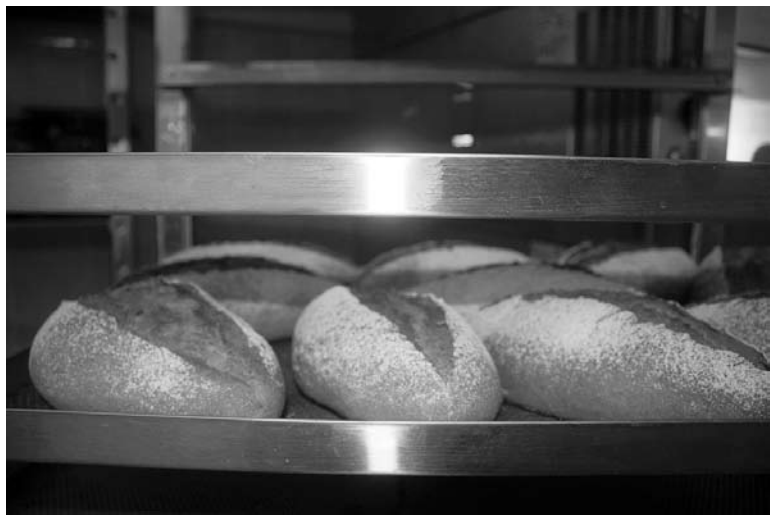
Хлеб ржаной на кефире - самый раскупаемый сорт в ресторане «Варенье»