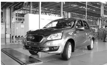
АВТОВАЗ ГОТОВИТСЯ к снижению спроса на свои автомобили

ОАО «АвтоВАЗ» удалось нарастить свои финансовые показатели по сравнению с первым полугодием прошлого года. Убыток предприятия за 6 месяцев работы в текущем году составил 2,747 млрд рублей. Такие данные приводятся в финансовой отчетности ВАЗа. По сравнению с предыдущим годом автозаводу удалось уменьшить убытки почти на миллиард рублей – показатель первого полугодия прошлого года был 3,726 млрд рублей. Объем полученной АвтоВАЗом выручки вырос на сумму около 10 млрд: если