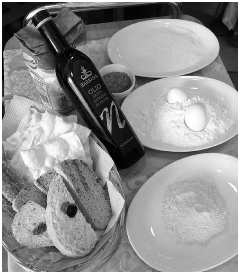
Хлебная корзина ресторана итальянской кухни «Бакко»