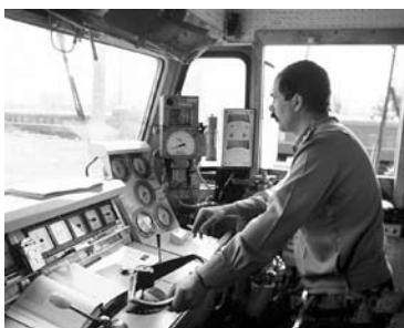
СОТРУДНИКОВ КУЙБЫШЕВСКОЙ железной дороги просят соблюдать деловой стиль

Среди корпоративных документов ОАО «РЖД» действительно есть «Методическое пособие по деловому этикету», которое определяет требования и рекомендации к поведению сотрудников, в том числе в части стандартов стиля деловой одежды. В документе прописано, что сотрудникам необходимо носить ту одежду, которая наилучшим образом соответствует специфике работы. При этом одежда не должна повторяться в течение нескольких дней и должна меняться в зависимости от сезона и ситуации (представительские мероприятия, обычный рабо-