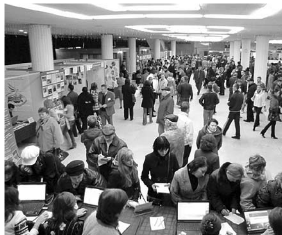
СЫЗРАНСКИМ СОТРУДНИКАМ «ПК Автокомпонент» придется искать новые места для трудоустройства

Сызранское ОАО «Пластик» являлось одним из крупнейших поставщиков автокомплекующих из пластмасс на ОАО «АвтоВАЗ» и ЗАО «GM-АвтоВАЗ». До недавнего времени предприятие входило в группу «Криста». Однако в конце 2013 года завод перешел в собственность и под управление нижегородского холдинга «Автокомпонент», а в дальнейшем был переименован в ОАО «ПК Автокомпонент Сызрань». На момент захода нижегородцев на «Пластик» там работали около 2 тыс. человек. Под управлением эффективных топ-менеджеров из Нижнего Новгорода с завода уже уволено порядка 500 сотрудников, но, как сегодня стало известно, процесс оптимизации штата продолжится. Как сообщил управляющий директор ОАО «ПК Автокомпонент Сызрань»