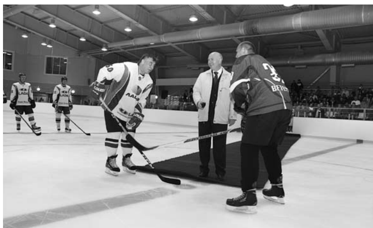
ПЕРВОЕ ВБРАСЫВАНИЕ в новой «Роснефть-Арене» сделал Николай Меркушкин

водстве. НК «Роснефть» ведет масштабную постоянную работу по поддержке спорта и пропаганде здорового образа жизни в регионах своей деятельности, строит спортивные сооружения.