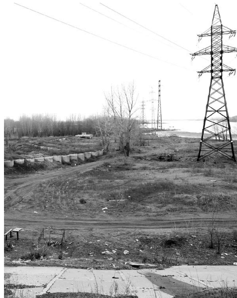
МИНСТРОЙ МОЖЕТ ВЗЫСКАТЬ до 7,1 млрд рублей за якобы исчезнувший с территории Самарского Заречья песок в московском суде. Даже если таких денег взять неоткуда, этот процесс способен обесмыслить встречные претензии «ЖилСтроя» к ведомству