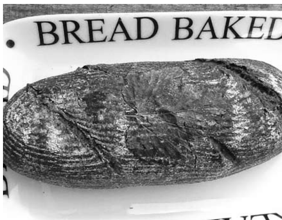
АВТОРСКИЙ ХЛЕБ Натальи Гири

Довольно многие хозяйки спохватились, приобрели себе хлебопечки и стали выпекать хлеб дома. Но проблема с ка-