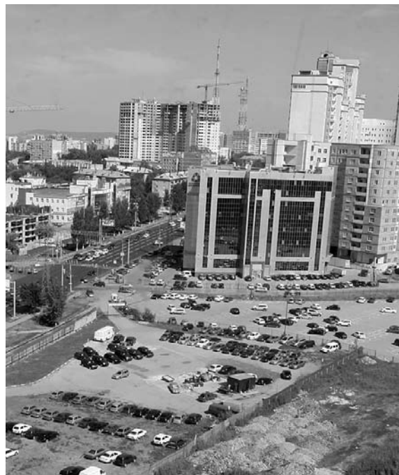
ПОД ГИПЕРМАРКЕТ «О`КЕЙ» проектируют площадку за Центральным автовокзалом