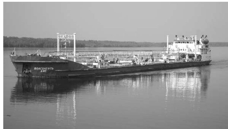
«БАШВОЛГОТАНКЕР» ПРЕВРАТИЛСЯ в «Волготанкер» во всем, кроме названия и месторасположения центрального офиса

Существенным и продолжительным ростом финансовых показателей «БашВолгоТанкер» обязан в первую очередь увеличению численности флота, а также росту объема и направлений грузоперевозок по водным путям. По данным портала korebel.ru, в собственности «БВТ» находится 27 нефтеналивных танкеров типа «Волгонепфть». Этот тип судов относится к классу «река - море», обладает большой вместимостью и двойным дном. Точную численность танкерного флота, который находится в распоряжении «БВТ», в том числе и арен-