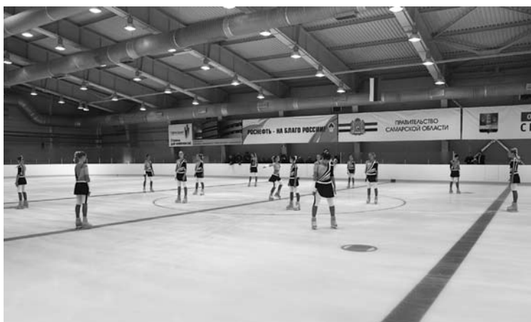
НК «РОСНЕФТЬ» сделала возможным активно заниматься зимними видами спорта в Отрадном

Необходимо отметить, нефтяники уделяют особое внимание вопросам физической культуры, поскольку считают, что спорт формирует крепость тела и силу духа, волю к победе, мужество и самоотдачу. Эти качества являются залогом побед в жизни и высоких результатов на произ-