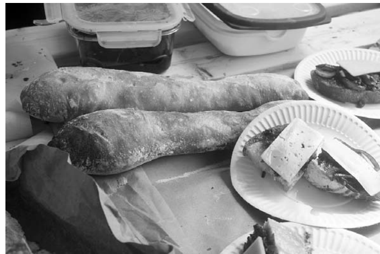
ХЛЕБ, представленный на прошедшем в воскресенье «Ресторанном дне». Пекут просто молодые ребята, просто для себя пока. Стоимость булочки на мероприятии была не маленькая - 100 рублей

Во-первых, соцсети, в частности «Фейсбук», - хорошая вещь, если пользоваться ею по делу. Таким образом там была обнаружена Наталья Гирия, оставившая свой комментарий на странице у «Пури». Пообщавшись, мы выяснили, что Наталья - это именно тот человек, который учил печь хлеб год назад при открытии ресторан «Варенье»,