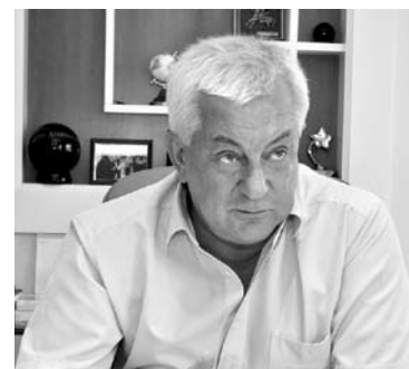
БАНК АНАТОЛИЯ ВОЛОШИНА взыскивает средства с должников