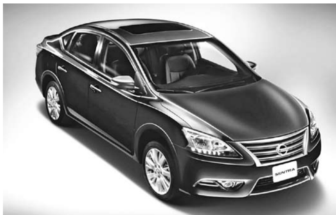
SENTRA ЗАМЕНИТ ушедшую с российского рынка Tiida

Региональные дилеры получают первые автомобили Nissan Sentra уже в конце октября. Стартовая стоимость новинки, которая должна заменить ушедшую в этом году Tiida, начинается от 679 тыс. рублей. На российском рынке модель будет доступна в четырех комплектациях с 117-сильным бензиновым мотором объемом 1,6 литра с 5-ступенчатой механической коробкой передач. В базовой версии Sentra получит ABS, системы стабилизации и распределения тормозных усилий, подогрев сидений. В комплектацию Comfort входит аудиосистема с четырьмя динамиками. Двухзонный климат-контроль и боковые подушки безопасности можно получить в комплектации Elegance, если доплатить порядка 60-70 тыс. рублей. За топовую версию, в которую входят кожаный салон, комплекс Nissan Connect с навигатором и ксеноновые фары головного света, придется выложить 914 тыс. рублей. Как сообщили «СО» в «Самарских автомобилях», первые машины появятся в автосалоне уже 31 октября.