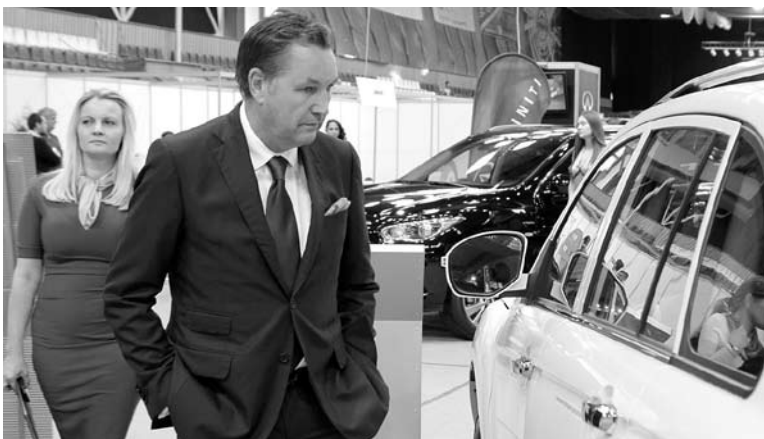
КАДРОВАЯ ПОЛИТИКА Бу Андерссона способна спровоцировать новые волнения в Тольятти

В мэрии Тольятти пояснили, что из указанных 12 тысяч человек далеко не все покину-