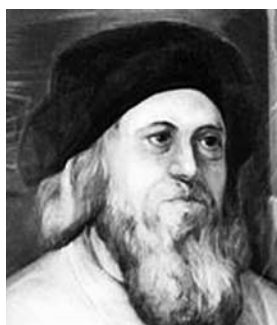
РАББИ НАХМАН, философ, 1772-1810

Знания, за которые платят, запоминаются лучше.