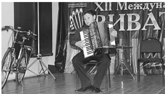
МЕСТНЫЙ ФЕСТИВАЛЬ «Виват, баян!» помог возродить интерес у детей к баяну и гармонии

Благодаря опросу пап и мам на интернет-портале «Самородок», в котором приняли участие более 50 пользователей, становится ясно, сколько денег современные родители готовы в принципе тратить на дополнительное образование и досуг детей. В среднем в семье, где двое детей дошкольного и младшего школьного возраста, родители выбирают спортивную секцию, музыкальную школу, языковые курсы - по 2-3 раза в неделю. И это не считая посещения различных мастер-классов несколько раз в месяц. Например, занятия танцами с элементами хореографии в школе искусств стоят около 400 руб. в месяц, для сравнения: в частной школе танцев в среднем около 2000 руб. Плавание в бассейне - 200-350 руб. за одно занятие, в частном - минимум 500 руб., спортивная секция в СДЮШОР - бесплатно, занятия в частном спортклубе - около 3000 руб. Платные языковые курсы для детей - от 1500 до 3200 руб. в месяц за 2 раза в неделю. Но в муниципальных организациях часто просят учеников сделать добровольный взнос в виде ежемесячного пожертвования от 100 до 1500 руб., к этому добавляются приобретение формы или музыкального инструмента, спортивного снаряда, взносы за участие в соревнованиях, конкурсах и тому подобные траты - все за счет родителей. Получается, что около ста тысяч рублей в год в среднем платят родители за дополнительное образование своих детей.