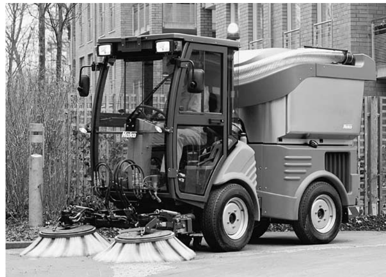
ПАРК СПЕЦТЕХНИКИ САМАРЫ пополнится 46 новыми всесезонными машинами