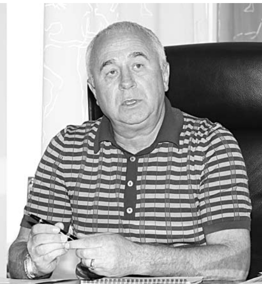
ВИКТОРУ СУРКОВУ предстоит решить квартирный вопрос многих граждан