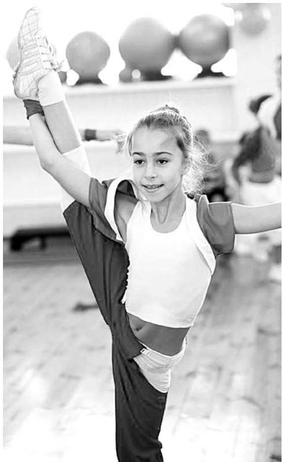
ДЕТИ СПОСОБСТВУЮТ росту большинства учреждений фитнес-индустрии