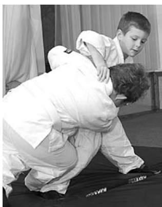
ДЗЮДО ВХОДИТ в пятерку наиболее востребованных видов спорта в Самарской области для детей от 6 до 15 лет