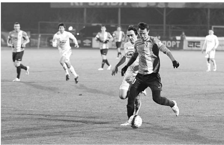
СТАБИЛЬНОЕ ПОЛОЖЕНИЕ «Крыльев Советов» позволяет клубу решать турнирную задачу на сезон