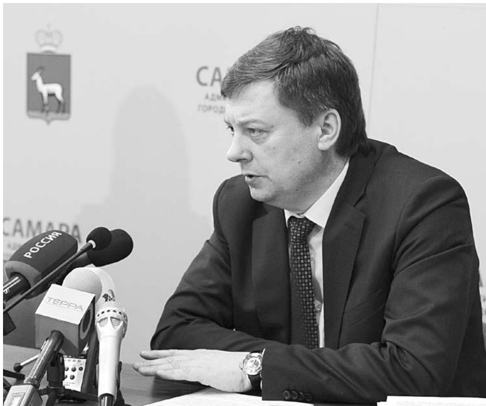
ОЛЕГ ФУРСОВ планирует сократить количество городских департаментов и управлений на треть

Олег Фурсов заявил о том, что город начнет активно пользоваться возвращенными полномочиями по распоряжению неразграниченными городскими землями уже в этом году. «С этого года я планирую начать торговать на электронных площадках и аукционах участками земли под застройку. По самым скромным оценкам, продажа 10 таких площадок может принести в бюджет города от 2 до 5 млрд рублей», - заявил он. При этом, по словам главы администрации, на эти площадки могут быть привлечены не только самарские компании, но и игроки строительного рынка других регионов. «Населению неважно, кто строит, главное – чтобы строили быстро, качественно и чтобы цена была как можно ниже. Меня самарские строители убеждают в том, что такая политика может обрушить строительный рынок Самары. Я с этим абсолютно не согласен, потому что, если квартиры будут стоить ниже 55 тыс. рублей за квадратный метр, от этого выиграет как население, так и городской бюджет». По словам Олега Фурсова, за счет поступлений от продажи земли могут быть решены мно-