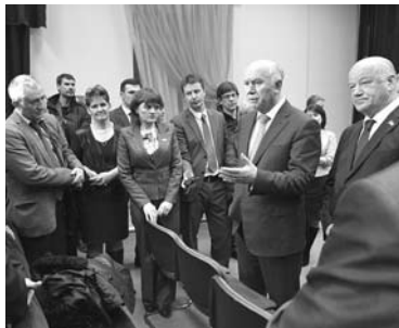
НИКОЛАЙ МЕРКУШКИН сообщил, что при выборе главы Шенталинского района мнение жителей территории станет решающим

При выборе кандидата на пост главы администрации Шенталинского района конкурсная комиссия будет опираться на мнение жителей. Об этом во время своего визита в муниципалитет 10 марта заявил губернатор Николай Меркушкин. По его словам, в областном правительстве пока не определились в собственных предпочтениях относительно того, кто должен возглавить район, но в любом случае, подчеркнул Николай Меркушкин, решение должно приниматься с учетом мнения населения. «Поэтому я хотел бы узнать ваше мнение на этот счет, – обратился губернатор к жителям на встрече в районном ДК. – При выборе кандидата на