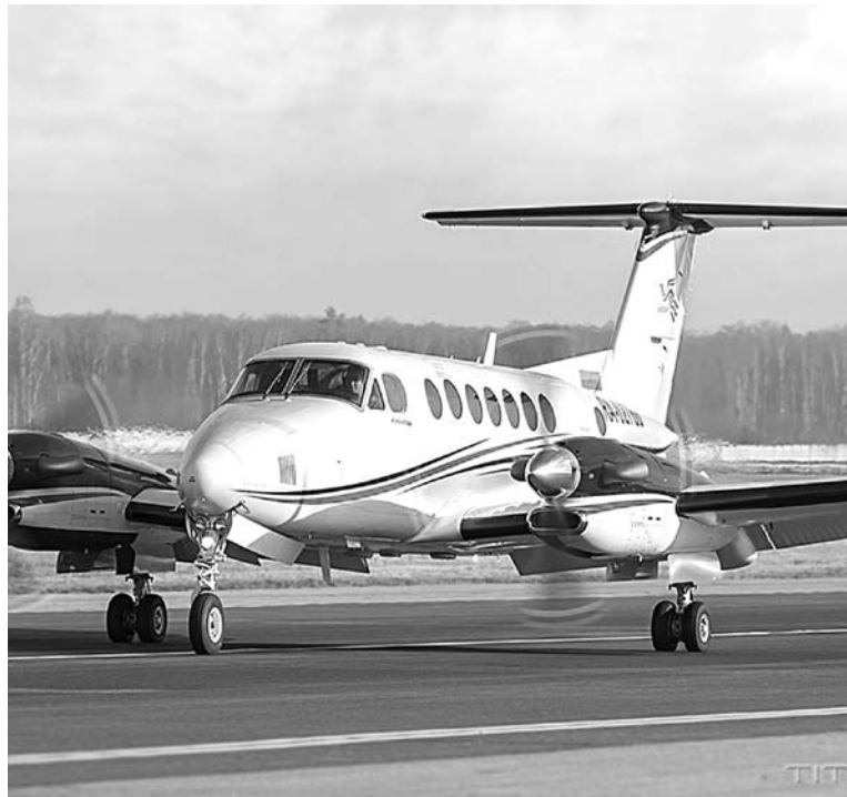
ТЕПЕРЬ ТОЛЬКО арбитраж Москвы способен вернуть «Эйр Самару» в состояние между жизнью и смертью