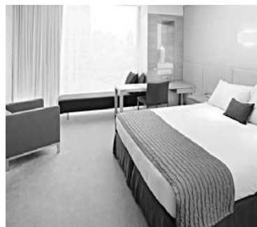
«БЕРЕГ» ВХОДИТ в гостиничный бизнес по схеме частно-государственного партнерства с областными властями