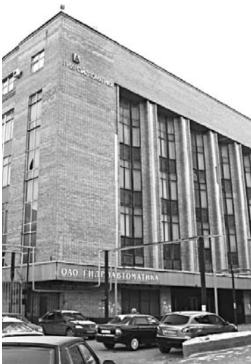
«ГИДРОАВТОМАТИКА» В ПРОШЛОМ ГОДУ улучшила свои финансовые результаты