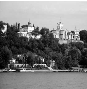
В РЮМОЧНОЙ «Лимончик» на Барбошиной поляне произошла поножовщина с человеческими жертвами