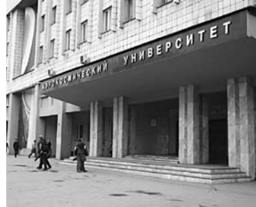
ТЕХНИЧЕСКИЕ ВУЗЫ удержат абитуриентов прошлогодними баллами

Так, в СГАУ по инженерно-техническому направлению подготовки минимальные баллы в 2015 году в зависимости от выбранного факультета и специальности установлены в диапазоне: математика - 45-65, русский язык - 40, физика - 40-45. В прошлом году по основным направлениям подготовки минимальный балл по математике составлял 50, по русскому языку и физике - 45. «В 2014