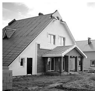
КРИЗИС СТИМУЛИРОВАЛ тольяттинских строителей заняться «малоэтажкой»

В настоящее время в Автограде активно развивается коттеджное строительство. Несмотря на кризис в российской экономике, на волне остановки спроса на многоэтажное жилье в городе строители разворачивают новые проекты малоэтажной застройки. В с. Ягодное появился новый проект «Воскресенка», курируемый ЗАО «Тольяттихимбанк». Как сообщили в компании, сейчас идет межевание земельных участков, ожидается получение свидетельств о праве собственности на каждый земельный участок. Здесь будут продаваться земли под ИЖС без подряда.