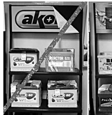
MAXION ПРЕДАЛ утилизацию продукцию «АКОМа»