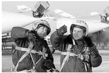
РЕМОНТ ВОЕННЫХ городков в Сызрани обойдется МО РФ в 21 млн рублей