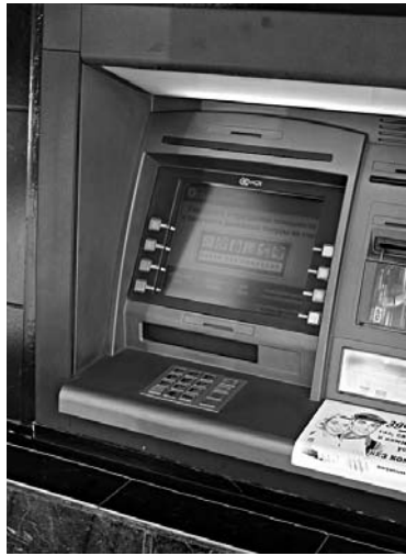
НАЛЕТЧИКИ ИЗ БЫВШИХ республик СССР использовали электроинструмент для вскрытия банкоматов