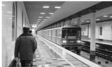
ЗА ЕЗДУ на других видах транспорта в самарском метро могут наказать штрафом