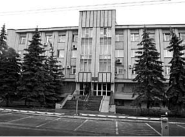
ПО МНЕНИЮ прокуратуры, муниципальные районы получают недостаточно средств на исполнение новых полномочий