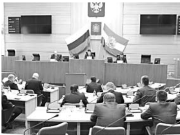
ОБНОВЛЕННЫЙ ЗАКОН наделит Олега Фурсова сразу двумя должностями - главы городского округа и мэра

Другие корректировки закона связаны с изменением модели местного самоуправления в Самаре, а именно - с созданием