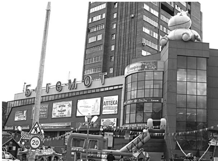
«БЕГЕМОТОВ» В РОССИИ становится меньше