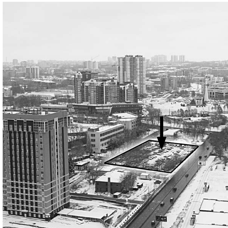
В ОГРАНИЧЕННОЕ ПРОСТРАНСТВО между ул. Соколова и Северо-Восточной магистралью хотят вписать «свечку»

Эксперты полагают, что точечная застройка данного участка неблагоприятно скажется на транспортной доступности района и вряд ли гармонично впишется в существующую среду. По словам генерального директора АН «Багратион» Романа Костина, новой высотке на «островке» по ул. Соколова будут присущи серьезные недостатки. «Сорок соток для 16-этажного жилого дома - это очень мало, там однозначно будет точечная застройка. Ни приличного двора, ни парковки в такую площадь вместить нельзя. Участок довольно узкий и находится между двух дорог - там все время будут пыль, гарь и шум. После завершения строительства жилья на месте бывшего силикатного завода вид на Волгу у части жильцов исчезнет», - сетует эксперт. ■