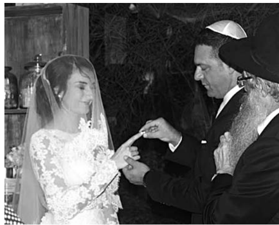
ЖЕНИХ НАДЕВАЕТ кольцо невесте на указательный палец по традиции. Носить впоследствии кольцо можно на любом пальце