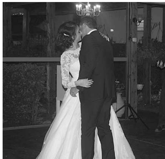
ТАНЕЦ ЖЕНИХА И НЕВЕСТЫ

сильно озабочен после сытного велком дринка. И после свадебного танца все собравшиеся как один встают и начинают танцевать. Подчеркиваю: трезвый, веселый и очень красивый народ. Мужской состав просто от души водит хороводы и высоко поднимает ноги. Красиво, горячо и задорно. Далее ты понимаешь, что для праздника всего-то и нужно отлично потанцевать и посмеяться, хорошо перекусив. Присутствие на свадьбе четырех поколений: бабушек и дедушек,