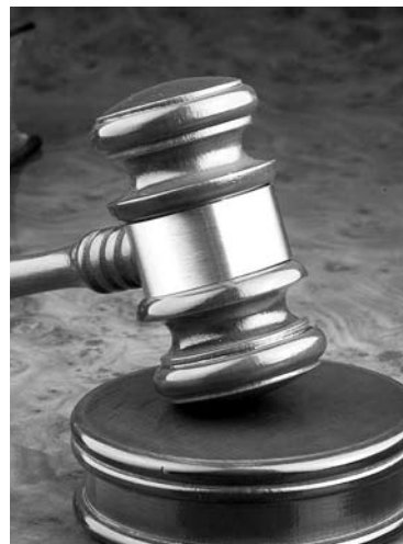
ДОСТРОЙКУ ЛИНДОВСКОЙ ПОДСТАНЦИИ могут поручить новому подрядчику