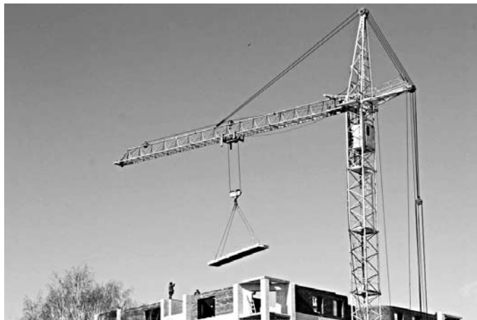
ЗАСТРОЙЩИКАМ НОВЫХ микрорайонов пообещали субсидии

На минувшей неделе министерство сообщило о начале отбора организаций на предоставление субсидий. Заявки от организаций будут приниматься до 20 ноября. На субсидии смогут претендовать компании, реализующие проекты комплексного освоения территорий, сдавшие за прошлый год не менее 100 тыс. кв. м жилья. После сдачи объекта социальной инфраструктуры застройщик обязуется передать его в муниципальную собственность. Размер субсидий от министерства не будет превышать 85% от сметной стоимости объекта.