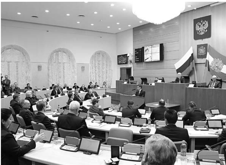
НЕ ВСЕ ОТВЕТЫ профильных министров удовлетворили депутатов губернской думы