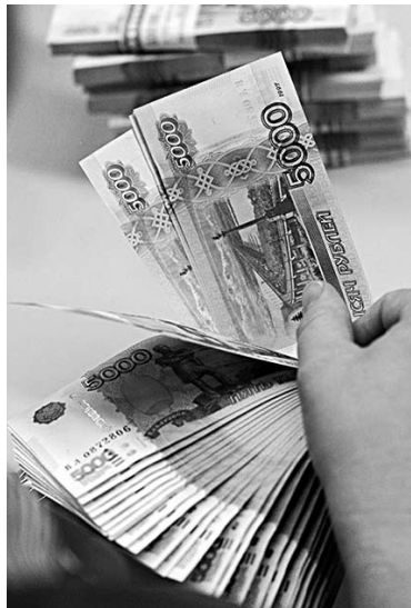
ВИКТОР ЯДРЫШНИКОВ отдавал мошенникам деньги на развитие некоего бизнеса