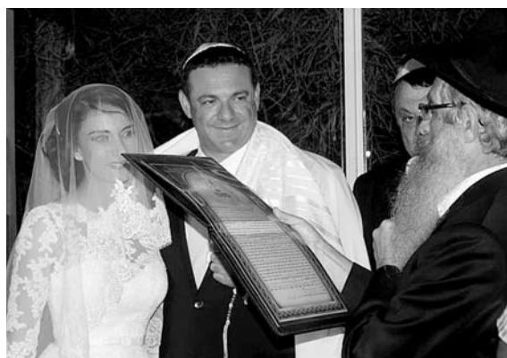
РАВВИН ЧИТАЕТ ктубу. Перед подписью