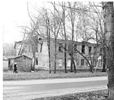
РАЗВИВАТЬ ЗАСТРОЕННЫЕ территории не стали

В декабре прошлого года ведомство обнародовало решение о развитии застроенного участка в границах ул. Вольской, проспекта Кирова, улиц Свободы и Краснодонской в Промышленном районе. Площадь этой территории составляет 1,2 га. Аналогичное распоряжение касалось участка в границах улиц Гастелло, Печерской, Советской Армии, Гагарина в Советском районе. Оно было опубликовано 3 сентября 2015 года. Эти территории планировалось