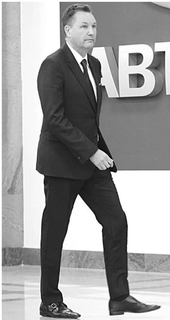
НАКАНУНЕ НОВЫХ СОКРАЩЕНИЙ команда президента АвтоВАЗа Бу Андерссона так и не аргументировала публично процесс оптимизации с экономической точки зрения