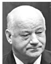
ВИКТОР САЗОНОВ, председатель Самарской губернской думы

Прежде всего я хочу сказать, что решение о принятии бюджета Самарской области на 2016 год и плановый период 2017-2018 годов состоялось. Это, безусловно, основной закон Самарской области, и мы его приняли в первом чтении. Что касается параметров бюджета, то они, к сожалению, несколько ниже, чем в предыдущем году. Доходы запланированы в размере 118,1 млрд рублей, расходы - 123,7 млрд, дефицит бюджета составляет 5,6 млрд рублей. Но с учетом тех процессов, которые сегодня идут в стране, с учетом тех мер, которые предпринимаются по дальнейшему социально-экономическому развитию страны, мер по увеличению доходной части как в целом в стране, так и в Самарской области в частности, я думаю, что параметры бюджета по итогам 2016 года будут гораздо выше. Если сопоставить все предыдущие годы, 2015-й тоже был непростым: мы как раз вошли в экономический кризис, и если посмотреть, то мы значительно превысили параметры бюджета, которые тогда принимались. Это порядка 155 млрд рублей, а планировалось 132 млрд. Думаю, что эта тенденция сохранится и в 2016 году. Новый бюджет на 66,5% является социально направленным. Это расходы на образование, здравоохранение, социальную политику, физкультуру и спорт. Расходы на отрасль образования даже на 1,1 млрд рублей выше, чем в бюджете 2015 года. Чуть меньше расходы на здравоохранение, социальную политику, но это никак не скажется на исполнении тех задач, которые будут решать эти отрасли.