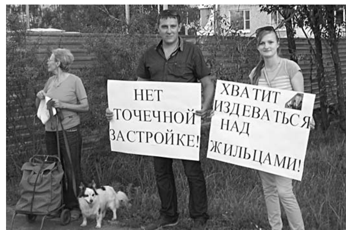
ПОТЕНЦИАЛЬНЫЙ ПРОЕКТ Илья Рузанова пополнит список точечных застроек в Самаре

Официально городские и областные власти публично декларируют отказ от уплотнительной застройки и комплексное развитие территорий. Нередко новые жилые комплексы вызывают протесты общественности. Застройщикам предъявляют претензии, которые мотивируют тем, что их объекты возводятся внутри сложившихся кварталов и увеличивают нагрузку на инженерную, транспортную и социальную инфраструктуру. Однако несмотря на заявления чиновников, реализация таких строек, как правило, продолжается. Можно предположить, что появлению новой высотки без паркинга вряд ли обрадуются жильцы соседних домов на ул. Ново-Садовой. Вряд ли это встретит энтузиазм и руководства региональной полиции, под окнами которой она вырастет.