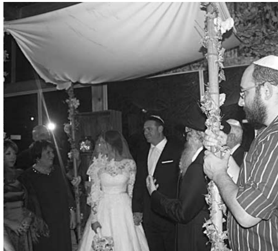
ХУПА - балдахин, под которым проводится главный свадебный обряд

Мы добрались до основного. В Израиле нет никаких загсов. Все, что здесь нужно, чтобы брак считался действительным, это доказать свое еврейское происхождение, а затем пройти процедуры хупы. Хупа - это такая беседка, иногда (как в нашем случае было) навес, балдахин. Она символизирует дом жениха, куда он вводит невесту. В день бракосочетания над Израилем проходила пыльная буря, поэтому из дворовой стационарной беседки церемонию переместили под навес, который прикрепили к обычным деревянным столбикам, внутри помещения. Итак. Под хупой раввином совершается обряд обручения - он называется кидушин. На указательный палец жених надевает невесте кольцо. Затем раввин зачитывает ктубу - договор об обязательствах жениха по отношению к невесте. Жених его подписывает. В воздухе разлито ощущение невероятной серьезности момента. Затем раввин читает шева брахот - семь свадебных благословений. Потом ты подпрыгиваешь. Ибо тебя хоть и предупреждали, но ты пугаешься. Жених разбивает ногой бокал в память о разрушенном Храме и многовековом изгнании. Все. Муж и жена. Объятия, поздравления, поцелуи. Гости проходят в зал к накрытым столам. Жених и невеста ненадолго уединяются в специальной комнате - едер ихуд. Потом они появляются в зале и танцуют свадебный трогательный танец. Причем замечу, у жениха и невесты нет мест за столом. На протяжении вечера они остаются с гостями на танцполе или перемещаются от стола к столу. Едой ты уже не