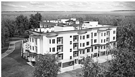
У ЛЕСОПАРКА на Шестой просеке возведут элитный жилой комплекс