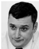
АЛЕКСАНДР ХИНШТЕЙН, депутат Государствен- ной думы РФ

Нужно смотреть, как оценивает сейчас целесообразность запуска Линдовской министерство строительства. Если их утверждения были правдой, то непонятна позиция застройщика. Если же застройщик прав, то к чему было уверять всех в необходимости подстанции?