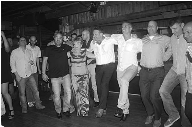
«СКРОМНЫЙ» ВЕЛКОМ ДРИНК с кебабами и салатами

Для начала жених и невеста доказывают, что они евреи.