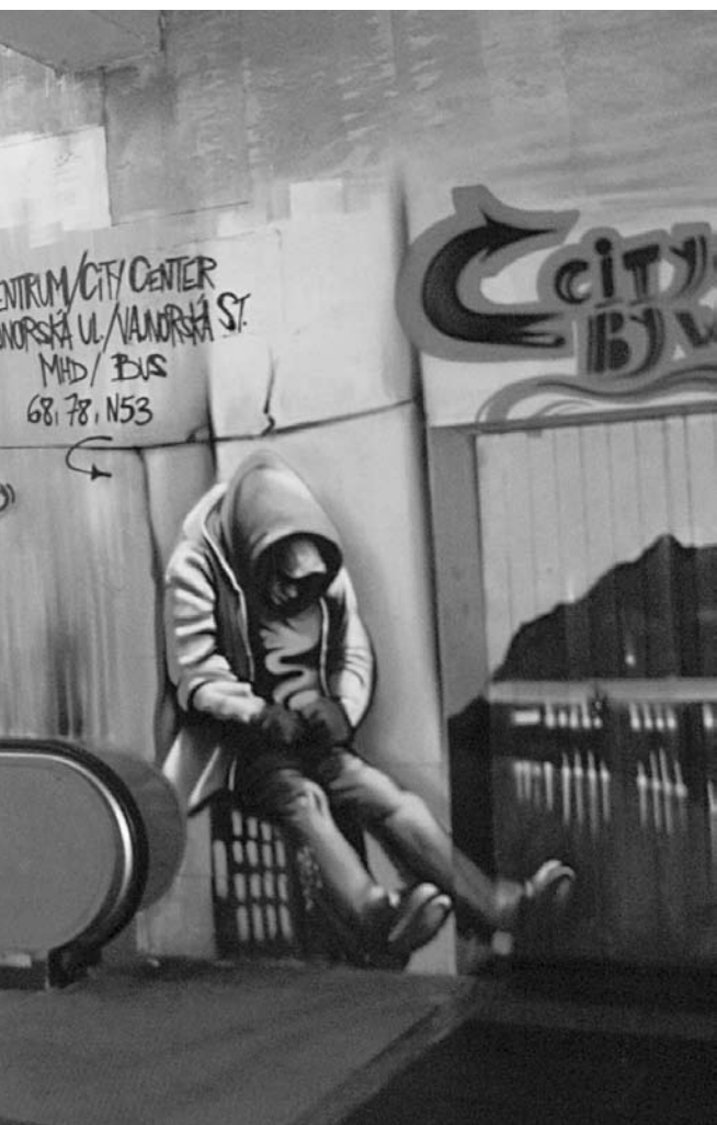
ЭТОТ ЖИТЕЛЬ подземной Братиславы заставляет вздрагнуть от ощущения реальности