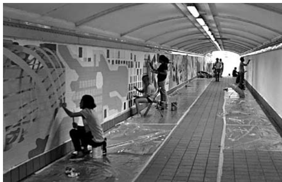
В СИНГАПУРЕ стены разрисовали граффити, пригласив фотографов заснять этот процесс