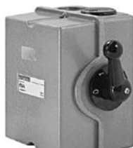
БОЛЬНИЦЫ, ШКОЛЫ и детские сады отключать от электричества нельзя, как бы плохо они за него ни платили

Законодательство РФ выделяет целую категорию потребителей, к которым энергетики не имеют возможности применить самую эффективную меру по взысканию долгов за энергию. К таким неприкасаемым относятся учреждения социальной сферы - детские сады, школы и больницы. Правила функционирования розничных рынков электрической энергии не допускают ограничения режима потребления ниже уровня аварийной брони в отношении определенного перечня потребителей и отдельных объектов, поскольку ограничение или прекращение энергоснабжения может привести к возникновению угрозы жизни и здоровью людей. В 2012 году прокуратура Самарской области инициировала волну исков в отношении поставщиков энергоресурсов, имеющих договоры с объектами социальной инфраструктуры. Целью прокуратуры было добиться исключения из договоров с медучреждениями, школами, садами пунктов, предписывающих возможность введения ограничений.