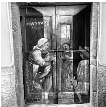
В ЧЕЛЛЕ ЛИГУРЕ вход в заброшенный железнодорож- ный туннель украшили семейной картиной