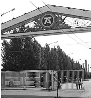
В САМАРЕ наградили юных изобретателей

В Самаре завершился II областной конкурс детских творческих проектов «Изобретаем будущее». В этот раз он был посвящен изобретениям, призванным облегчить ведение домашнего хозяйства. В организации конкурса принял участие российский производитель аммиака - ОАО «Тольяттиазот» («ТоАЗ»). Целью мероприятия является развитие и поддержка детского инновационного творчества. В финал прошли 17 работ. Среди них - автономные решения для выполнения бытовых задач и прогулок с домашними животными, предложение по диагностике состояния организма на