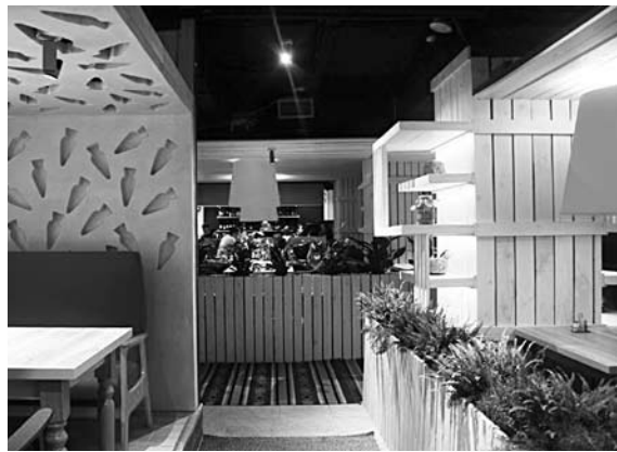
«ПЕРЧИНИ» И ОСТАЛЬНЫЕ рестораны ГК «Поляна» не скрывают, что они на 20-30% улучшили результат прошлого года в декабре-январе

У остальных радости много меньше. Декабрь отныне - не кормилец года. На 30-40% отмечают падение по сравнению с прошлым годом очень многие самарские рестораторы. Два заведения из заявленных - «Вахтангури» и «Кукушка» - и вовсе не проводили новогоднюю ночь, хотя и планировали. Причина проста - не набрали достаточного количества народу, посему празднование было бы экономически невыгодным.