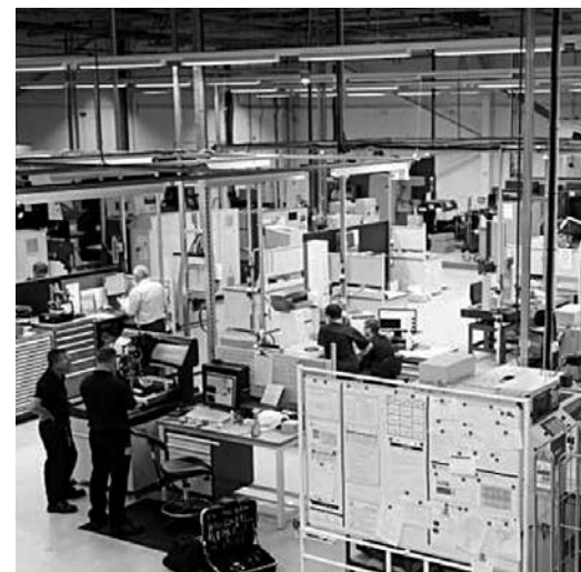
В КЛАСТЕРЕ планируют развивать производство наноматериалов