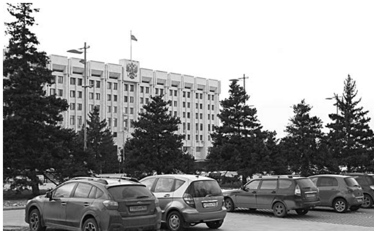
«БЕЛЫЙ ДОМ» пока приостановил исполнение обещаний, данных в 2014 году

В апреле 2015 года областное правительство своим постановлением дополнило госпро-