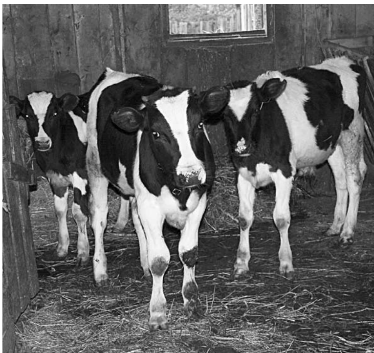
ПРЕДСТОЯЩЕЕ КОМПЛЕКСНОЕ освоение племзавода «Кряж» поддержат за счет создания парка по производству стройматериалов

Площадь индустриального парка составит около 50 га. «Проект реализуется правительством региона, а также крупными производителями строительных материалов и инвесторами. Индустриальный парк должен способствовать дальнейшему развитию территории Кряжа, созданию новых рабочих мест в непосредственной близости от комплексных жилых застроек», - рассказали в СОФЖИ.