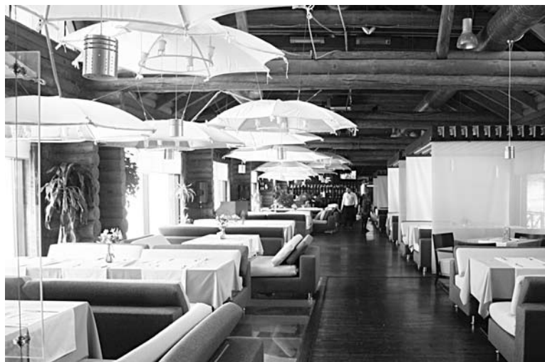
«МОРКОВНЫЙ ЗАЯЦ» отлично отработал и предновогодние корпоративы, и саму новогоднюю ночь

Интересно, что в этом году здорово сработала, по словам Татьяны Саклаковой, доставка от «Палыча» в предпразднич-