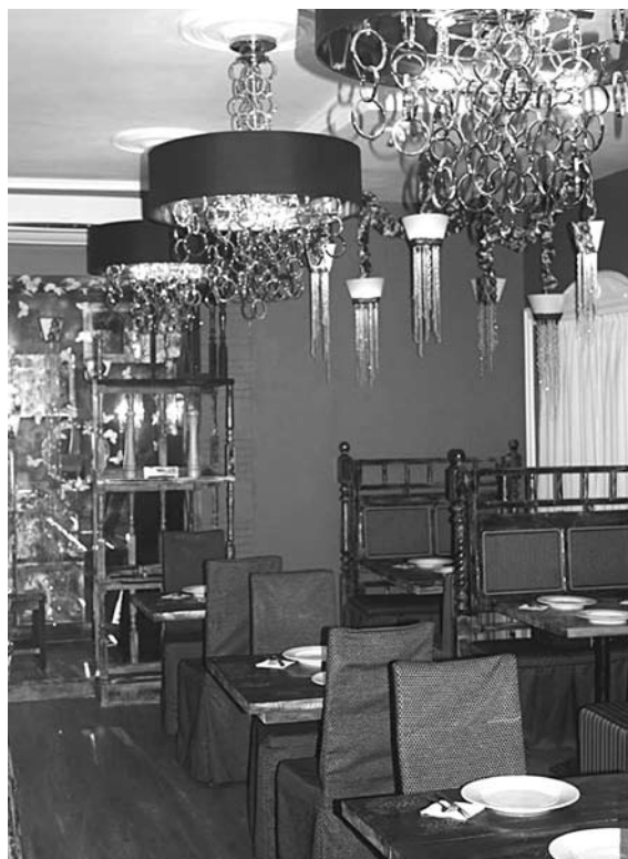
РЕСТОРАН «ЯР» отлично провел новогоднюю ночь, но говорит о практически полном затишье в каникулярное время