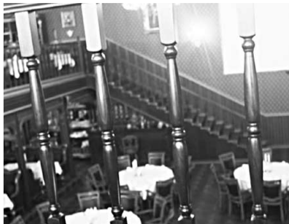
«ХАДСОН» НА НАБЕРЕЖНОЙ отработал корпоративы и новогоднюю ночь так же, как и в прошлом году. Каникулярные дни с 1 по 10 января были хуже