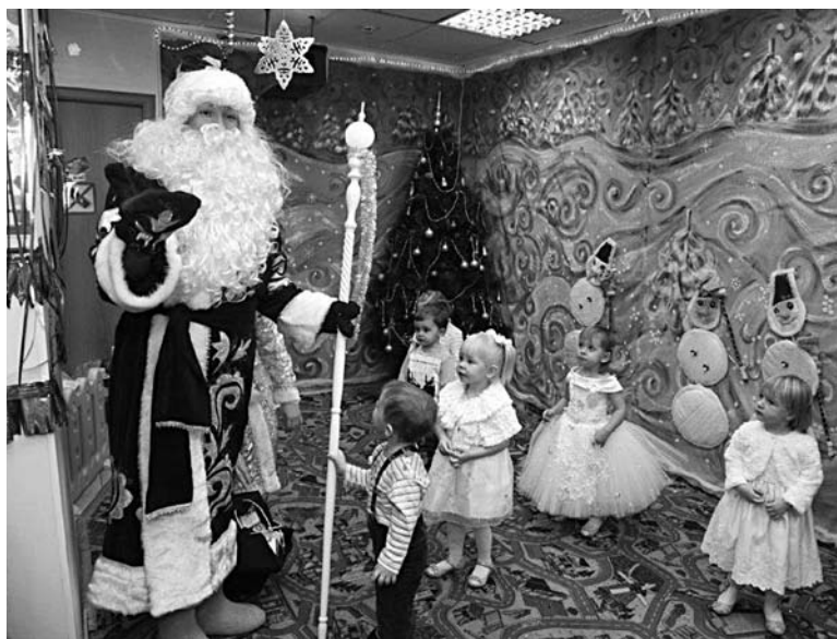
РАСЧЕТЫ ДЕТСКОГО САДА «Земляничный дождь» стоили Ипозембанку лицензии

Банкиры действия владельцев Ипозембанка оценивают неоднозначно. С одной стороны, как минимум часть нарушений, допущенных кредитной организацией и вошедших в число причин к отзыву лицензии, действительно весьма сомнительны. В частности, по данным «СО», банк несвоевременно сообщил о платеже государственного образовательного учреждения «Земляничный дождь» в размере 121 тыс. руб. Кроме того, банк поторопился уведомить заблаговременно о подлежащей мониторингу операции, в