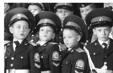
ТОЛЬЯТТИНСКИЕ ШКОЛЬНИКИ наденут погоны, будут изучать военное дело и маршировать строем