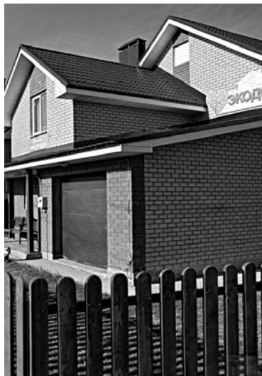
ГАЗОРАСПРЕДЕЛЕНИЕМ В ПОСЕЛКЕ «Экодоле» будет заниматься «Самарагаз»