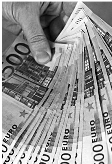
РОДСТВЕННИКАМ КАМАЛА ГУЛУЕВА не пришлось платить за него выкуп в 10 млн евро