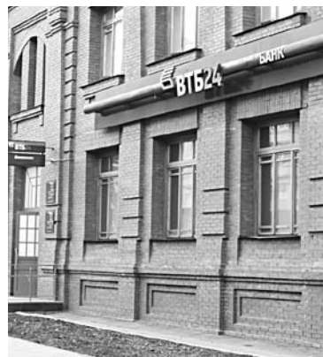
ВТБ24 НАЗНАЧИЛ нового руководителя ОСБО