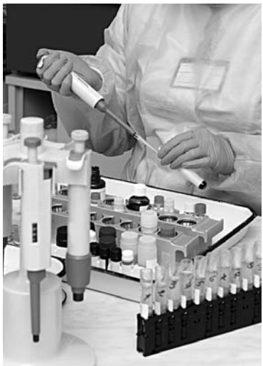
БЫВШЕМУ ДИРЕКТОРУ ООО «Ситилаб» могут вменить хищение на сумму 1 млн руб.