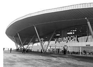
АВИАКОМПАНИЯ «РУСЛАЙН» запустит новые рейсы из Самары