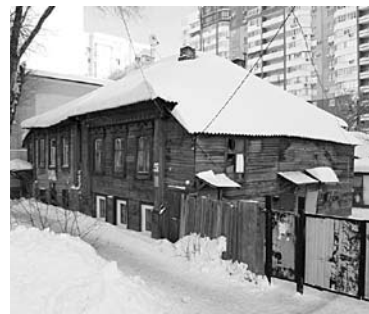
ВЕТХИЕ ДОМА в Железнодорожном районе еще стоят

Департамент строительства и архитектуры Самары в очередной раз не смог найти инвесторов для развития застроенной территории. Аукцион на право заключения договора о развитии площадки в границах улиц Никитинской, Красноармейской, Буянова, Рабочей в Железнодорожном районе был назначен в декабре минувшего года. Участок площадью 0,49 га в течение десяти лет предстояло застроить новым жильем, предварительно демонтировав четыре существующих ветхих здания. Торги по лоту должны были состояться 25 января текущего года, однако еще 20 января стало очевидно, что они не