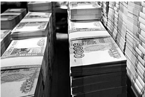
105,4 МЛН РУБЛЕЙ требует ДСА с подрядчика за просрочку контракта на 66 млн рублей