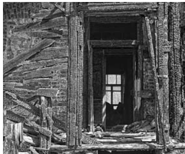
ОБГОРЕВШЕЕ ТЕЛО Галины Поповой после пожара нашли в котельной ее дома в Липягах