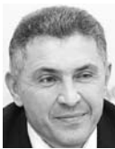
ИВАН ПИВКИН, министр транспорта и автомобильных дорог Самарской области

В свое время АСАДО задумывалось как казенное предприятие для содержания областных дорог. Наличие у министерства транспорта специализированного казенного предприятия - огромный плюс, ведь у АСАДО есть филиалы в районах области, современная техника, постоянный штат. Качество работ гораздо выше, чем у подрядных организаций, которые раньше приходилось нанимать для содержания дорог. Но главное - есть ресурсы, которые позволяют в экстренных случаях выполнять работы сверх задания. Возможно, в этом причина убытков. Если это чисто бухгалтерский вопрос, то особой проблемы я не вижу - долги бюджета перед предприятием будут закрыты. Если нет управленческих ошибок, то казенное предприятие не может быть убыточным - оно работает по заданию министерства. Выполняли заданный объем - профинансировали. Мы запросили в министерстве информацию и рассмотрим ответ на ближайшем заседании комитета. Я убежден, что АСАДО должно работать по государственным расценкам. Если отдать коммерческим организациям, то расходы на содержание дорог увеличатся в разы.