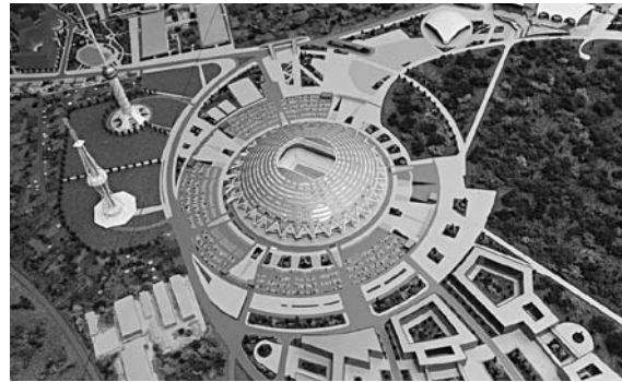
ПОЧТИ 46 ТЫС. КВ. М Московского шоссе попало под сервитут для строительства сетей к мундиалю