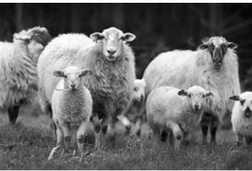
ОБЪЕКТОМ ХИЩЕНИЙ скота на селе чаще всего становятся отары овец на вольном выпасе