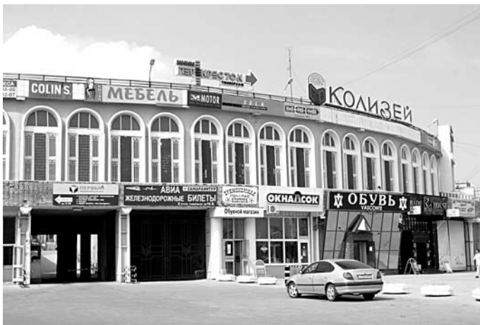
ПЛАНИРОВКУ ТЕРРИТОРИИ под «Колизеем» будут готовить год