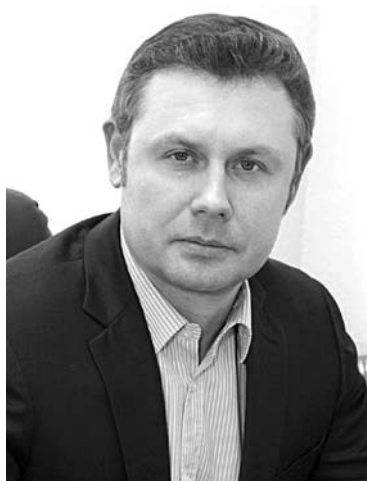
ЗАВОД АЛЕКСАНДРА ГЕРАСИМЕНКО резко увеличил прибыльность