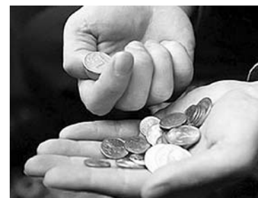
СЕТЕВИКОВ ЗАСТАВИЛИ создать льготы в тарифах для бизнеса

Не планируют повышать в 2016 году и тарифы на технологическое присоединение к тепловым сетям ОАО «Предприятие тепловых сетей», вхо-