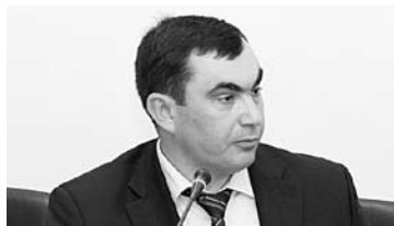
ЗАМЕСТИТЕЛЬ ВИКТОРА АЛЬТЕРГОТА занял его кресло. Пока временно