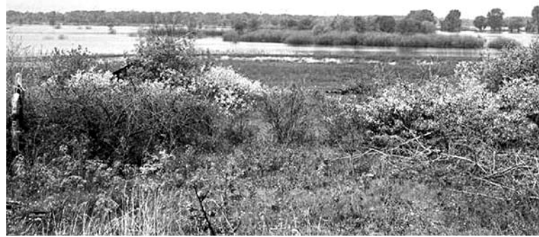
СОХРАНЕНИЕ ПАМЯТНИКА природы в Заречье может заметно увеличить стоимость подготовки площадки под застройку

По оценке экспертов, включение в проект водного объекта повлияет на экономику застройки. Заместитель декана Высшей школы урбанистики