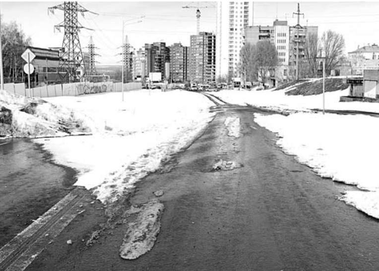
НА СВЕЖЕПОСТРОЕННУЮ улицу нанесли даже разметку, которая пережила зиму, правда под снегом

Между тем построенный отрезок не позволяет сейчас уйти и на улицу Ново-Садовую. И не позволит еще по крайней мере два года. Контракт на проектирование Северо-Восточной магистрали от улицы Ново-Садовой до Автобусного проезда департамент градостроительства подписал с ООО «ГК «Абсолют» только 2 февраля этого года. Разработку проекта предполагается завершить лишь осенью... Только после этого может начаться подготовка к строительным работам. Так что пока Луначарского не ведет ни туда, ни сюда. ■