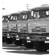
«СПЕЦАВТО-ЦЕНТР КАМАЗ» попытался обанкротить из-за невыплаченной зарплаты