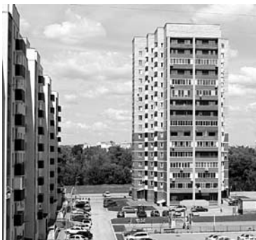
«ВОЛГАРЬ» РАСШИРИТСЯ за счет бывшей территории парков и бульваров

Данная территория площадью 10587 кв. м является частью более крупного участка в 24484 кв. м и с 2015 года принадлежит на праве собственности ООО «Шард». Ранее территория располагалась в зонах Р-2 (парков, бульваров, набережных) и Ц-3 (предприятий обслуживания населения местного значения).