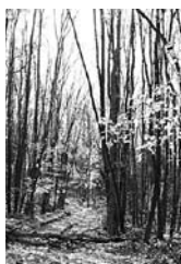
УЧАСТКИ В ЗОНАХ Р-3 и Р-4 приватизировали вопреки законодательству