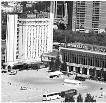
ВОПРОС ОБ УЧАСТКЕ автовокзала может окончательно решиться в Октябрьском районном суде

Прокуратура предприняла вторую попытку изъять земельный участок у ПАО «Европейская корпорация автовокзалов» (ранее - ОАО «Автовокзалы и автостанции Самарской области») - теперь в районном суде. С требованием о возврате участка в муниципальную собственность выступил прокурор Октябрьского района. Его заявление зарегистрировано в Октябрьском районном суде, на 24 марта назначено собеседование в рамках подготовки к разбирательству дела. Как пояснили «СО» в прокуратуре Октябрьского района, прокурор требует признать ПАО «Европей-