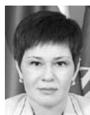
ГАЛИНА АНДРИЯНОВА, председатель думы г.о. Самара

От того, как органы местной власти будут работать, зависит очень многое. Сейчас только 35% населения чувствуют работу органов МСУ на себе, люди ждут обратной реакции власти. Сегодня необходимо правильно выстроить систему власти, выстроить оптимальную систему управления городом. Помимо этого необходимо привести Самару в порядок в плане благоустройства и состояния дорог. Областные власти будут тщательно следить за работой районных администраций.