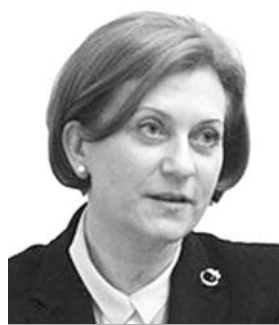
АННА ПОПОВА, руководитель Роспотребнадзора России

Следует перейти от надзора за деятельностью к надзору за продукцией.