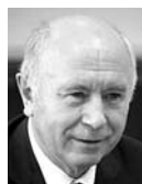
НИКОЛАЙ МЕРКУШКИН, губернатор Самарской области

Помимо этого губернатор поставил перед главой города и руководителями профильных ведомств задачу качественного улучшения ремонта дорог и благоустройства территории областного центра. «Мы строим уникальный стадион к чемпионату мира, однако Самара по-прежнему нуждается в повы-