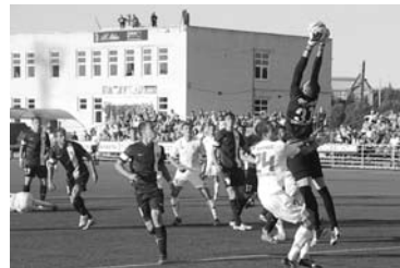
«СЫЗРАНЬ-2003» и «Лада-Тольятти» возобновили матчи Первенства ПФЛ