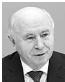
НИКОЛАЙ МЕРКУШКИН , губернатор Самарской области

Нам нужен результат. Необходимо нагнать упущенные сроки и ввести объект в эксплуатацию вовремя. Чемпионат для нас крайне важен. Не менее важно наследие, которое останется жителям Самарской области.