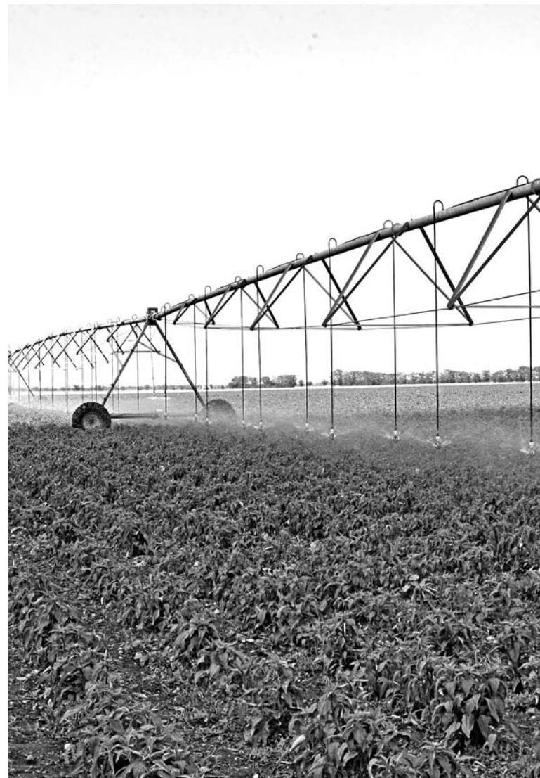
ВСЛЕД ЗА ДИПЛОМНЫМИ СКАНДАЛАМИ «Самарамелиоводхоз» оказался втянутым во внутренний конфликт по итогам оптимизации