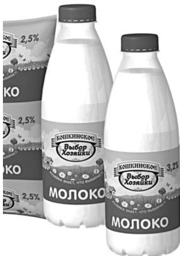
КОНФЛИКТ «АЛЕВА» и налоговой службы вновь рассмотрят в первой инстанции

Ход конфликта АО «Алев» и налоговой службы из-за 140 млн рублей может развернуться в пользу компании. Арбитражный суд Поволжского округа не поддержал обвинения налоговиков. В середине 2015 года ульяновская ИФНС обвинила «Алев» в неправомерном завышении налоговых вычетов на общую сумму порядка 140 млн рублей. Фискалы посчитали подозрительными хозяйственные отношения компании с контрагентами - ООО «Луч», ООО «Сатурн», ООО «Производственная ферма «Рубин», ООО «Регион-Продукт», ООО «ТехПромСнаб» и ООО «Техснаб». Налоговики указывали