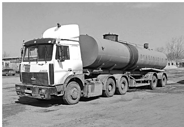
ДАЖЕ УСТАНОВЛЕННЫЕ на грузовики ООО «ВТК» спутниковые системы слежения не помогли правоохранителям отследить возможные нелегальные маршруты перевозки похищенного топлива