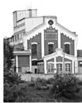
БУДУЩАЯ СУДЬБА спиртзавода в Новом Буяне неизвестна