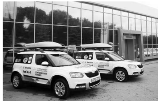
САМАРА стала одной из последних остановок на пути в Сибирь