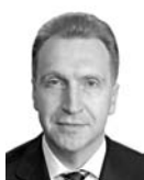
ИГОРЬ ШУВАЛОВ , первый заместитель председателя Правительства РФ