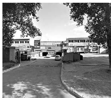
ОРГАНИЗАЦИЯ ИЗ ТОЛЬЯТТИ хочет получить разрешение на строительство уже функционирующего объекта

строительство, однако получил отказ. Тогда фирма попыталась пролонгировать документ в судебном порядке. В феврале СК «Рост» обратился в арбитраж с иском к мэрии Тольятти. В ходе разбирательства выяснилось, что надстрой второго этажа завершен и в нем функционируют офисы различных фирм. При этом ни разрешения на строительство, ни разрешения на ввод объекта кооператив не имел. Вердикт по делу вынесли 16 июня - суд пришел к выводу, что СК «Рост» не доказал получение им разрешения на завершение надстройки, в связи с чем отсутствует и предмет продления. Теперь это решение компания пытается оспорить в апелляции. Жалобу приняли