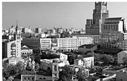
АЛЕКСЕЙ ТИТОВ и близкие к нему лица теряют недвижимость в центре Москвы