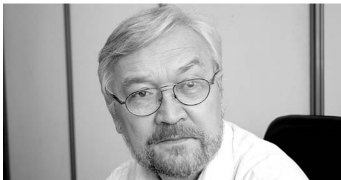
РУКОВОДИТЕЛЬ САМАРСКОГО ОТДЕЛЕНИЯ Союза архитекторов России призвал коллег подготовить предложения по внесению изменений в Правила застройки и землепользования города