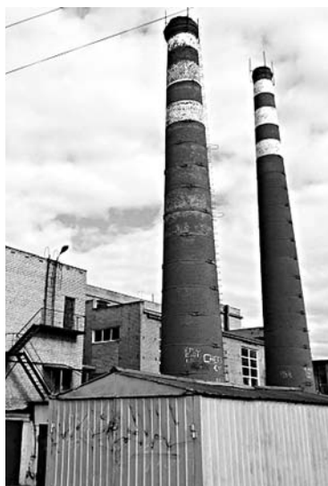
ТОРГИ НА АРЕНДУ котельных в Самаре стали ареной для конкурентной борьбы

Самарское УФАС рассмотрит сегодня жалобу «Стройэффекта» с требованием отменить открытый конкурс на право заключения договора аренды объектов теплоснабжения в Самаре. Заказчик работ – МП г.о. Самара «Инженерная служба». Объектом является право заключения договора аренды объектов теплоснабжения, находящихся в муниципальной собственности и переданных МП «Инженерная служба» на праве хозяйственного ведения. Ранее МП «Инженерная служба», которое выступает в роли заказчика, было вынуждено приостановить торги и внести корректировки в кон-