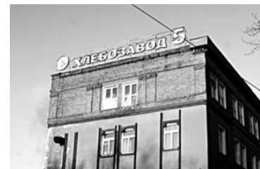
САМАРСКИЙ ХЛЕБОЗАВОД №5 добивается разрешения на эксплуатацию пристроя через суд

ОАО «Самарский хлебозавод №5» пытается легализовать возведенный пристрой по отгрузке и упаковке хлебобулочных изделий. Первоначально предприятие обратилось в администрацию Самары за выдачей разрешения на ввод пристроя в эксплуатацию. Однако, не получив необходимого документа, завод начал решать вопрос через суд. 10 августа представители предприятия подали в арбитражный суд заявление, в котором потребовали от горадминистрации устранить допущенные нарушения прав и разрешить эксплуатацию пристроя. ОАО «Самарский хлебозавод №5» зарегистрировано в 1993 году и занимается произ-