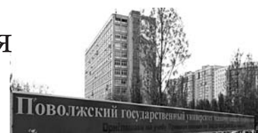
31 АВГУСТА университет связи начинает процедуру по выборам ректора

31 августа оставшийся без ректора Поволжский государственный университет телекоммуникаций и информатики запустит процедуру выборов нового руководителя. На очередном заседании ректората 23 августа административный орган вуза одобрил проект положения о выборах ректора ПГУТИ, предложения по составу комиссии по выборам нового руководителя вуза и план-график проведения выборов, согласованный с Федеральным агентством связи, а также при-