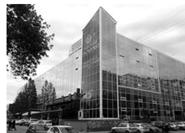
ОПЕРАТОР ТЦ «КОНТИНЕНТ» выводит на рынок базу отдыха