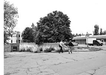
СВЕЧКЕ В АВТОЗАВОДСКОМ РАЙОНЕ Тольятти добавили квартир, не увеличив количество машино-мест