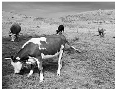
172 ГА на окраине Отрадного застроят жильем