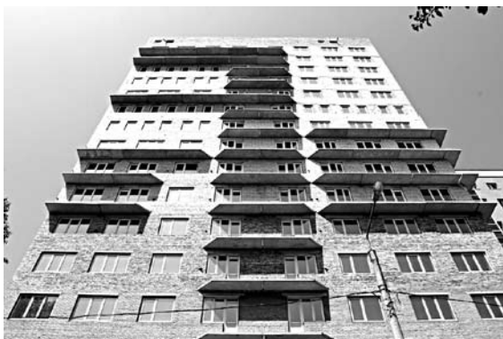
В МИНСТРОЕ разрабатывают механизм возврата субсидий, полученных недобросовестными застройщиками

Ранее в регионе были случаи нецелевого использования субсидий минстроя. Так, ООО «Бал-