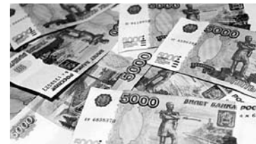
42,2 МЛН РУБЛЕЙ пытается через суд вернуть СОФЖИ с «1245 УНР»

Самарский областной фонд жилья и ипотеки (СОФЖИ) намеревается вступить в реестр кредиторов банкротящегося ООО «1245 УНР» с требованием 42,2 млн рублей. Компания являлась арендатором мощностей комбината крупнопанельного домостроения ООО «81 КЖИ». Однако в 2015 году она начала банкротиться, а уже летом 2016-го процедура перешла в стадию конкурсного производства. 13 октября СОФЖИ обратился в самарский арбитраж с требованием включить его в реестр кредиторов «1245 УНР».