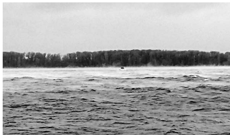
ОПЕРИРОВАНИЕ САМАРСКИМ МИНЛЕСХОЗОМ в своей работе картами 1960 года запутывает конфликты на стыке лесо- и водопользования