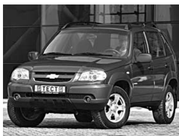
ЭКСПОРТ «ДЖИ ЭМ-АВТОВАЗ» просел на треть

Экспорт упал и у ЗАО «Джи Эм-АвтоВАЗ», совместного предприятия американской корпорации General Motors и российского ОАО «АвтоВАЗ» в Тольятти. По итогам девяти месяцев 2016 года экспортные поставки «Джи Эм-АвтоВАЗ» упали на 30% по сравнению с минувшим годом. Такую информацию сообщило аналитическое агентство «Автостат». Всего за отчетный период предприятию удалось отгрузить дилерам 23 213 автомобилей, в том числе 1176 машин - в страны СНГ. Крупнейшим внешним рынком для ЗАО «Джи Эм-АвтоВАЗ» стала Украина, на долю которой пришлось 44,7% поставок. За ней следуют Казахстан и Беларусь - 29,3% и 11,6% соответственно. В самой компании тенденцию также связали с введением утилизационного сбора в Республике Казахстан (основной экспортный рынок для Chevrolet Niva в 2015 году), что способствовало повышению цены для конечного покупателя.