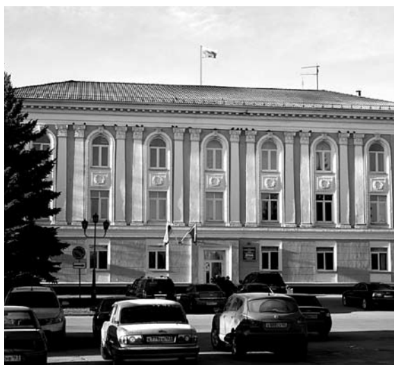
ТОЛЬЯТТИНСКИЕ ДЕПУТАТЫ все- таки просят по- разному брать арендную плату с продавцов хлеба и алкоголя

Против детализации выступила антимонопольная служба, правомочность ее позиции подтвердил и Верховный суд РФ. В судах ФАС доказала, что неправомерно устанавливать различные тарифы для хозяйствующих субъектов, так как с точки зрения федерального законодательства они работают на одном товарном рынке, равно как и дифференцировать их в зависимости от типа размещенного строения (капитальное или временное). В итоге действовавшие около