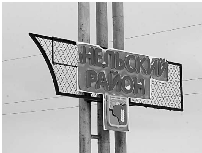
В КИНЕЛЬСКОМ РАЙОНЕ обещают перевыполнить плановое задание по жилью

За три квартала 2016 года в Кинельском районе сдали 16,08 тыс. кв. м жилья. Это на 20,9% больше, чем было введено в муниципалитете за аналогичный период прошлого года. Такие данные приводятся в отчете об итогах социально-экономического развития района, опубликованном 3 ноября. По итогам года объем сдачи жилых домов в Кинельском районе должен составить 19 тыс. кв. м. Ранее чиновники рассчитывали на ввод 17,5 тыс. кв. м. В июле 2016 года Кинельский район назывался в числе муниципалитетов с низкими темпами строительства. Как заявляли тогда в областном министерстве, за два квартала район обеспечил лишь 11% от планового задания.