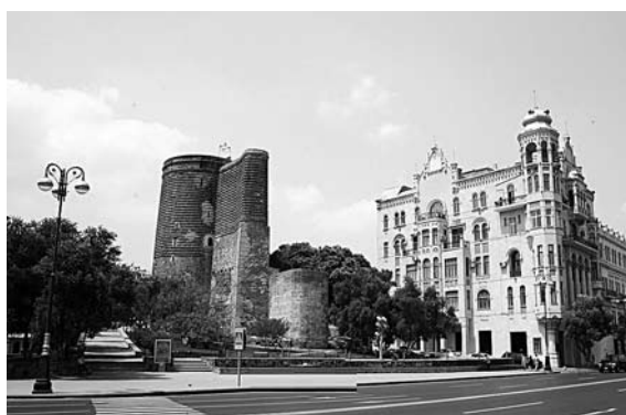
ВСЛЕД ЗА КАЗАХСТА- НОМ продажи предприятия Николя Мора упали и в Азербайджане

На чем основываются очередные радужные планы вазовского менеджмента, пока не совсем понятно. 2016 год обернулся для предприятия серьезным провалом на внешних рынках. Информация об итогах экспортных продаж АвтоВАЗа раскрыта в ежеквартальном отчете предприятия, опубликованном на этой неделе. Всего за девять ме-