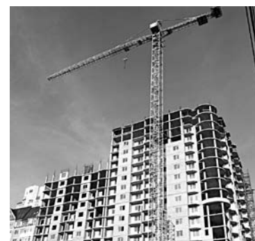
ДОЛЬЩИКИ РАССЧИТЫВАЮТ разобраться с возможно фиктивными продажами квартир в доме на ул. Вилоновской

Совет кредиторов и участников долевого строительства ЗАО «ИСК «Средневожжскстрой» хочет выявить фиктивные сделки по продаже жилья в доме на ул. Садовой/Вилоновской в Самаре. ЗАО «ИСК «Средневожжскстрой», возводившее объект, с 2011 года признано банкротом. По данным министерства строительства области, компания нарушила права 141 дольщика, не предоставив им квартиры. 3 ноября состоялось собрание кредиторов и участников строительства «Средневожжскстрой». На нем была создана рабочая группа из дольщиков, которой предоставили ряд полномочий. В частности, объединение намерено проверить документацию ЗАО и выявить фиктивные