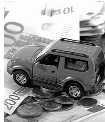
ЗА ПОСЛЕДНИЙ МЕСЯЦ 25 производителей скорректировали цены на автомобили

За последний месяц, в период с 16 декабря 2016 года по 15 января 2017 года, ряд автомобильных компаний переписал ценники на многие свои модели, в числе которых марки Audi, Lexus, Toyota, Skoda, Citroen и Lifan. Немецкий премиум-бренд Audi поднял цены на седан A6 (на 1,2-2,0%), универсал A6 Avant (на 1,2-1,9%), A6 Allroad quattro (на 1,3-1,4%), A7 Sportback (на 1,8-2,2%), S7 Sportback (на 1,0%), кроссовер Q3 (на 1,9-2,6%). Японский Lexus сыграл на подорожание своих кроссоверов. В зависимости от модификации автомобили серии NX скорректировались на 1,7-3,5%, LX - на 1,0-2,3%, RX - на 1,7-2,5%. Кроме того, кроссовер GX 460 вырос в цене на 1,4-6,1%. Также подорожали седаны серии ES (на 2,3-3,0%) и купе GS F (на 0,9%), RC200t (на 1,8%), RC F (на 0,5%). У Toyota стали дороже седан Corolla (на 2,6-3,6%), седан Camry (на 2,4-3,5%), кроссовер RAV4 (на 1,7-2,3%), внедорожники Land Cruiser Prado (на 1,7-3,0%) и Land Cruiser (на 0,9-1,3%), пикап Hilux (на 2,1-4,1%), минивэны Alphard (на