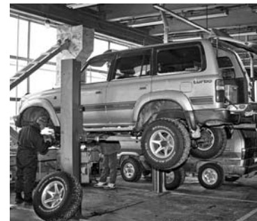
РЕФОРМА ОСАГО обещает ремонт авто, пострадавших в ДТП

С 1 марта 2017 года в силу может вступить закон о переходе на натуральное возмещение ущерба по ОСАГО. В конце прошлого года по инициативе Банка России и Минфина соответствующий законопроект был принят в первом чтении, а затем отправлен на доработку перед вторым. Целью документа является замена денежных выплат пострадавшим на ремонт в СТО. Одно из главных условий такого изменения - получение пострадавшими качественной услуги: автосервис должен быть доступным, ремонт - быстрым и надежным. Данная мера призвана оградить страховые компании от прямых выплат автовладельцам, пострадавшим в ДТП, и избавить от многочисленных судебных тяжб. К рассматриваемому законопроекту могут добавить пункт о компенсации ущерба за некачественный ремонт. С помощью этой поправки автовладельцы смогут получить увеличенные штрафы со страховой компании за каждый день, когда машина находилась в ремонте, который