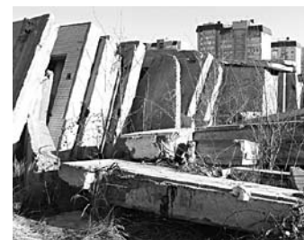
ПО МЕРЕ УГЛУБЛЕНИЯ кризиса на строительном рынке все новые производства стройматериалов становятся лишними

Еще два завода холдинга расположены в Ульяновской области - АО «Ульяновскцемент» и Сенгилеевский цементный завод. «Ульяновскцемент» функционирует уже 55 лет, мощности его устарели. Там в последнее время сложилась проблемная ситуация. В конце прошлого года появилась информация об увольнении по