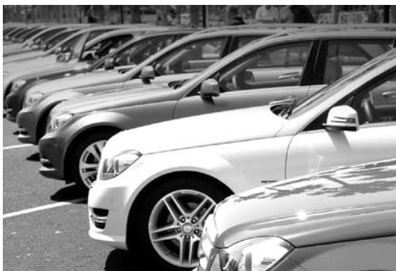
РЫНОК НОВЫХ АВТОМОБИЛЕЙ в Самарской области в 2016 году продемонстрировал падение на 4,1%

Всего же объем рынка новых легковых автомобилей в России в 2016 году составил 1,26 млн единиц - на 4% меньше, чем годом ранее. Лидером рейтинга крупнейших региональных рынков традиционно является Москва, на долю ко-