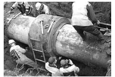
УЖЕ В ФЕВРАЛЕ областной минэнерго должен представить меры по удешевлению цен на подключение к сетям

Правительство Самарской области разработает проект программы по снижению стоимости технологического присоединения к инженерным сетям. Информация об этом содержится в «Программе действий по реализации послания Президента Российской Федерации и послания губернатора Самарской области» на 2017 год. Документ был утвержден 9 февраля. Исполнителем по разработке комплекса мер по регулированию стоимости подключения названо региональное министерство энергетики и жилищно-коммунального хозяйства, а также органы местного самоуправления. Проект должен