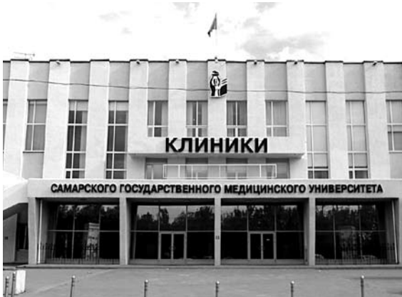
ТФОМС СПИШЕТ давние расходы СамГМУ на безопасность в судебном порядке