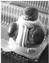
С СОБОЙ пирожные кладут в самые дешевые пластиковые контейнеры

Местоположение - фантастическое. Лучше придумать слож-