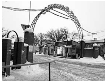
ДУИ ХОЧЕТ лишить участка рынок на Кольце Южной обводной дороги

Теперь же ДУИ намерено оспорить эти акты. В исковом заявлении департамент требует расторгнуть договор купли-продажи арендуемого объекта нежилого фонда, являющегося собственностью Самарской области. Также ведомство требует обязать «Долину» возвратить ДУИ участок в 44 231 кв. м и