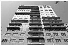
БЫВШЕГО ЗАСТРОЙЩИКА жилого комплекса в 88-м квартале готовят к ликвидации