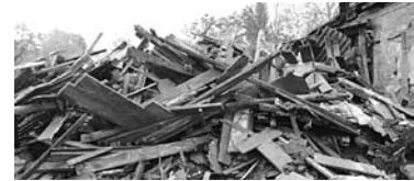
УГООКН ЗАПРЕТИЛО застраивать территорию под сносенным в начале 2017 года памятником