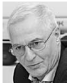
НИКОЛАЙ РЕНЦ, председатель комитета по здравоохранению, демографии и социальной политике Самарской губернской думы

Рынок эстетической медицины сейчас стремительно развивается, проводятся различные конгрессы, конференции, например, по анти-эйдж медицине, в которых участвуют специалисты различного профиля - эндокринологи, генетики, репродуктологи. Такое сотрудничество помогает более целостно подходить к омоложению организма. Нельзя сказать, что в региональной индустрии красоты присутствует жесткая конкуренция. У нас есть достойные коллеги, но у каждой клиники свой подход и своя корпоративная культура. У этого рынка существует много направлений для дальнейшего развития, так как мы находимся на тонкой грани между эстетикой и медициной, и нужно понимать, что к красоте нужно подходить комплексно, ведь она напрямую зависит от общего состояния организма.