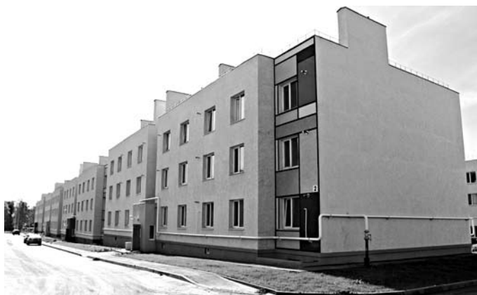
КОРПОРАЦИЯ «КОШЕЛЕВ» реализует ДГС 7361 кв. м жилья

АО «Кошелев-Проект Самара» заработает 245,478 млн руб. на поставках жилья департаменту градостроительства областной столицы. Муниципалитет рассчитывал двумя лотами приобрести квартиры общей площадью 7361 кв. м для переселения граждан из аварийного жилищного фонда. Дома должны быть построены до 2016 года. Максимальная стоимость по одному контракту достигала 221, 279 млн руб., по другому - 24,199 млн руб. Согласно условиям закупок, жилье с чистовой отделкой в Самаре департамент хотел купить по цене в 33,342 тыс. руб. за кв. м. 13 февраля стали известны результаты аукционов. Заявку на участие в тендерах подало лишь АО «Кошелев-Проект Самара», с которым и будут заключены контракты. Фирма, входящая в корпорацию «Кошелев», застраивает площадку в Смышляевке Волжского района. Там возводится жилой район «Кошелев-Парк».