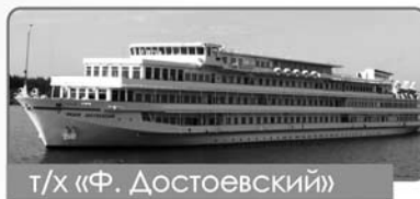
т/х «Ф. Достоевский»