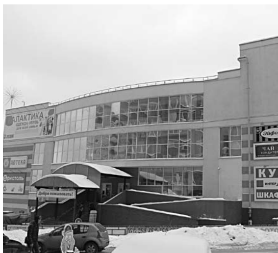
ВОДОВОД на ул. Ново-Садовой может оставить торговый центр без парковки

В 1998 году «Центр торговли «Октябрьский» приобрел у ООО «Самарские рынки» шесть зданий на ул. Ново-Садовой, 181Р. До 2013 года все эти объекты использовались как рынок. В