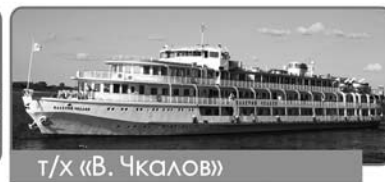
т/х «В. Чкалов»