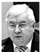
ЮРИЙ ШЕВЦОВ, председатель комитета по законодательству, законности, правопорядку и противодействию коррупции Самарской губернской думы

Итоги реализации законодательства о народных дружинниках обсуждали на семинаре в Самарской губернской думе 17 февраля. Председатель комитета по законодательству,