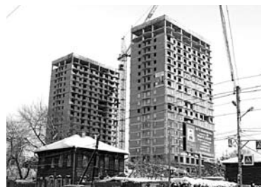
«НОВЫЙ ГОРОД» планирует построить почти две трети квартала в границах ул. Маяковского, Арцыбушевской, Чкалова и Буянова

Теперь же проект по планировке территории подготовлен. «Новым городом» было отме-