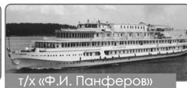
т/х «Ф.И. Панферов»