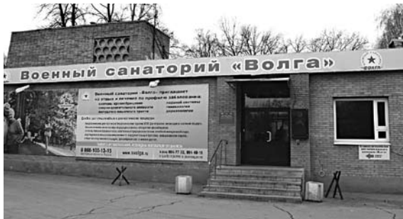
МИНОБОРОНЫ НАЧАЛО оформлять земли своего санатория в Самаре в судебном порядке