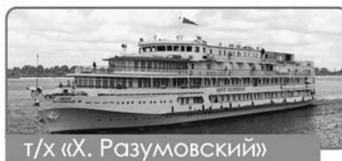
т/х «Х. Разумовский»