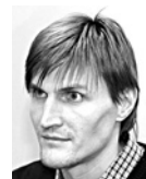
АНДРЕЙ КИРИЛЕНКО, президент Российской федерации баскетбола

Отличная атмосфера, накал... Мне, честно говоря, было немного жалко сармскую команду в первой половине: мяч упорно не хотел залетать в кольцо. Но, что очень приятно, во второй половине команда хозяев собралась, догнала, практически сравняла счет... Но ЦСКА все же достаточно опытная в этом плане команда. Мне очень понравилась борьба, ребята молодцы, бились, и уже три-четыре человека, как я вижу, могут стать кандидатами в нашу юношескую сборную.