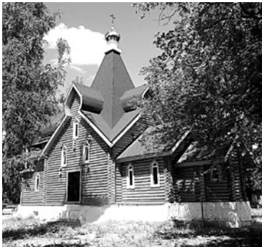
ДОКУМЕНТАЦИЮ ДЛЯ 66 га в Красноглинском районе разрабатывает религиозная организация