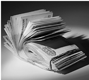
ОБЖАЛОВАНИЕ РЕЗУЛЬТАТОВ торгов завершилось штрафом для аукционной комиссии Борского района

7 апреля самарское УФАС также опубликовало постановление, согласно которому вину за совершенное правонарушение понесли лично три члена аукционной комиссии администрации Борского района. Каждому из них был назначен штраф суммой 30 тыс. рублей.