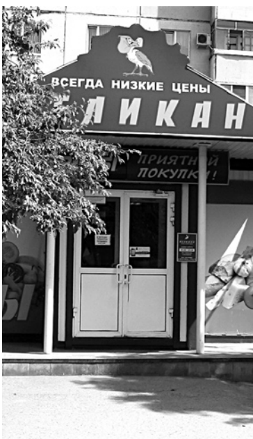
«ПЕЛИКАН» ПОЛЕТЕЛ в «Космос»