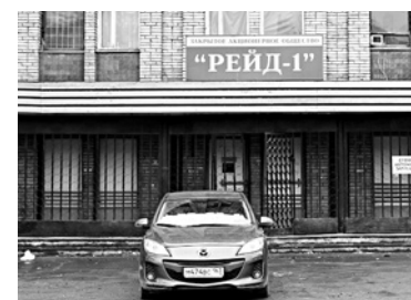
«ВОСХОД» НЕ СМОГ добиться снятия обеспечительных мер с подлежащего реализации имущества «Рейда-1»