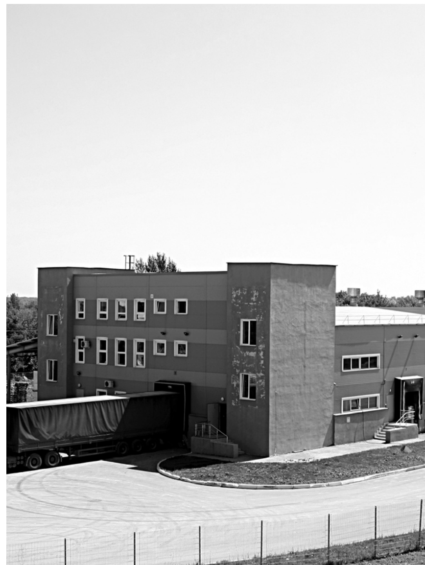
ПРАВООХРАНИТЕЛИ ПОСЧИТАЛИ, что ЗАО «Корпорация «Волгостром» не имело права распоряжаться находящимися на ее счету акциями Самарского гипсового комбината ни в 2004-м, ни в 2016 году

Второй преступный эпизод квалифицирован органами предварительного следствия как «представление в организацию, осуществляющую учет прав на ценные бумаги, документов, содержащих заведомо ложные данные, в целях внесения в единый государственный реестр юридических лиц, в реестр владельцев ценных бумаг или в систему депозитарного учета недостоверных сведений об учредителях (участниках) юридического лица, о размерах и номинальной стоимости долей их участия в уставном капитале хозяйственного общества, о зарегистрированных владельцах именных ценных бумаг, о количестве, номинальной стоимости и категории именных ценных бумаг, об обременении ценной бумаги или доли, о лице, осуществляющем управление ценной бумагой или долей, переходящих в порядке наследования, о руководителе постоянно действующего исполнительного органа юридического лица или об ином лице, имеющем право без доверенности действовать от имени юридического лица, либо в иных целях, направленных на приобретение права на чужое имущество, - наказывается штрафом в размере от ста тысяч до трехсот тысяч рублей, либо принудительными работами на срок до двух лет, либо лишением свободы на срок до двух лет со штрафом в размере до ста тысяч рублей или в размере заработной платы или иного дохода осужденного за период до шести месяцев либо без такового».