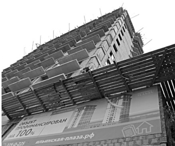
НОВЫЙ ИНВЕСТОР площадки «Монблана» может не достроить объект

Инвестор решил возводить на участке ЖК бизнес-класса «Ильинская плаза». Он представляет собой трехсекцион-