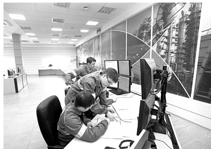
ЗАПУСК НОВЫХ технологических объектов позволил КНПЗ увеличить выработку светлых нефтепродуктов и глубину переработки нефти

АО «Куйбышевский НПЗ», дочернее общество НК «Роснефть», по итогам первого квартала 2017 года увеличило выработку светлых нефтепродуктов на 6,8% - до отметки 57,2%. При этом глубина переработки нефти выросла на 6,24% по сравнению с аналогичным периодом прошлого года. Рост данных показателей связан с запуском в прошлом году на полную мощность новых технологических объектов АО «КНПЗ», построенных в рамках инвестиционной программы компании. Среди новинок - комплекс каталитического крекинга FCC и установка по производству высокооктановой присадки метилтретбутилового эфира (МТБЭ). Мощность FCC составляет более 1 млн тонн сырья в год. Метилтретбутиловый эфир - высокооктановая присадка, предназначенная для производства бензина стандарта «Евро-5», по качеству не уступающая импортным аналогам. Установка имеет мощность в 150 тысяч тонн сырья и способна ежегодно производить до 40 тысяч тонн МТБЭ высокой чистоты. Пуск установки и производство собственной присадки позволили Куйбышевскому НПЗ начать отгрузку МТБЭ в адрес Новокуйбышевского НПЗ, что способствует оптимизации потоков компонентов между предприятиями «Роснефти».