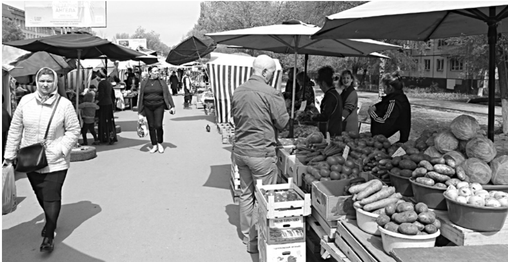
ВЧЕРА РЫНОК «Спарты» работал как ни в чем не бывало