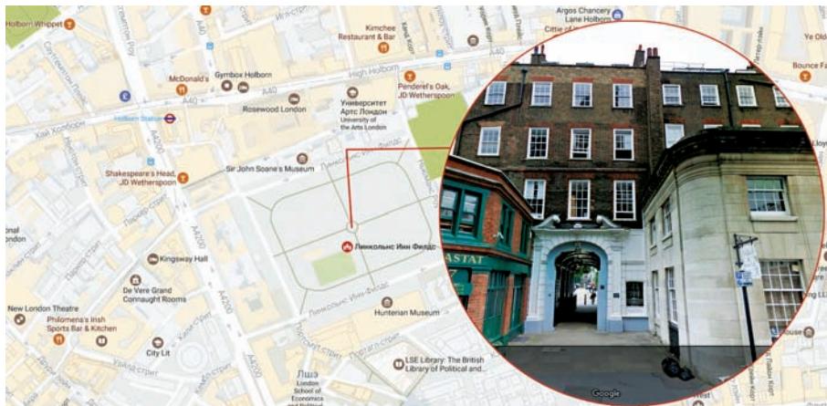
2 NEW SQUARE Lincoln's Inn, London