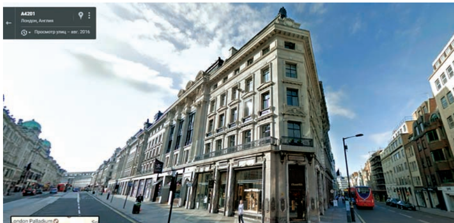
70 CONDUIT STREET , London

Великобритании, к которой принадлежал, в частности, занимавший тогда должность премьер-министра Соединенного Королевства Дэвид Кэмерон.