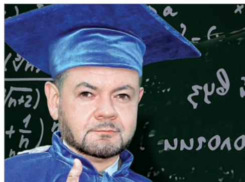
Зачетка Криштала стр. 40