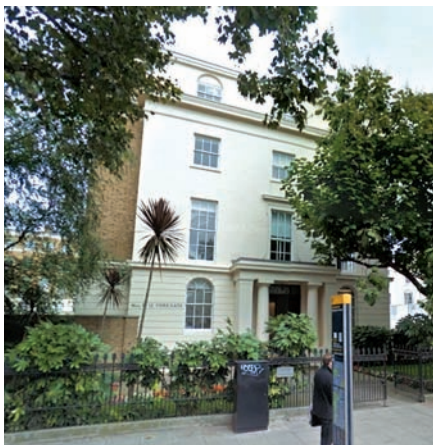
12 YORK GATE , London