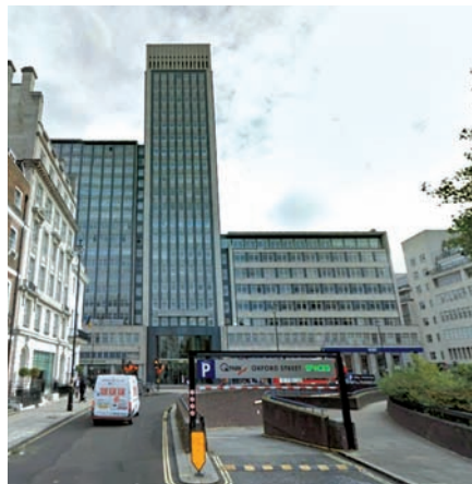
33 CAVENDISH SQUARE , London