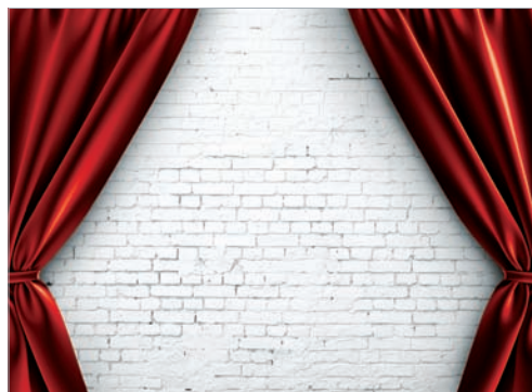
Декорация доходов стр. 4