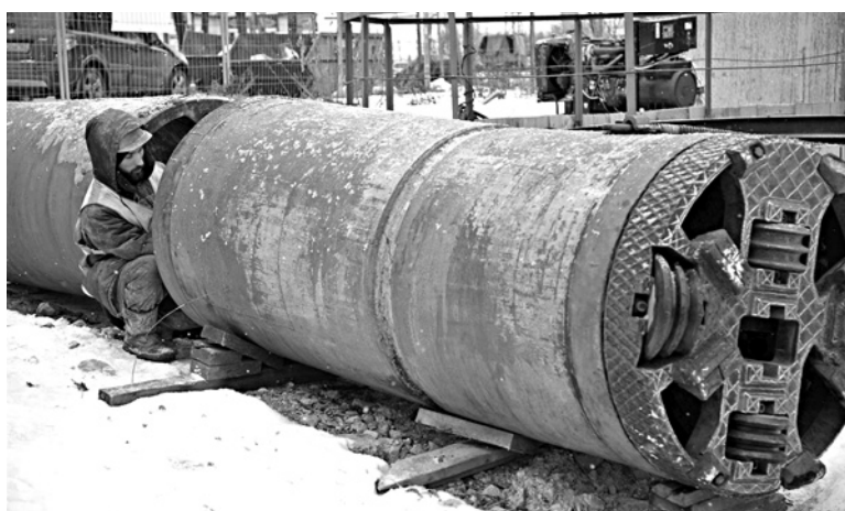
В «ЕВРОАЛЬЯНСЕ» уверяют, что отсутствие документов на землю не мешает достроить и сдать коллектор. Аудиторы Счетной палаты и эксперты не разделяют их оптимизма

Коллектор диаметром 1000 мм от ул. Советской Армии до камеры в районе ул. Осипенко и Лесной строится в рамках подготовки региона к чемпионату мира по футболу. И является одним из наиболее важных инфраструктурных «mundiальных» объектов для Самары - наряду с дорогами и дорожными развязками. «Строительство участка решает не только задачу получения дополнительных мощностей, которые будут задействованы на объекты ЧМ 2018 года. Новая ветка призвана разгрузить уже существующий основной коллектор, построенный около 40 лет назад и нуждающийся в ре-