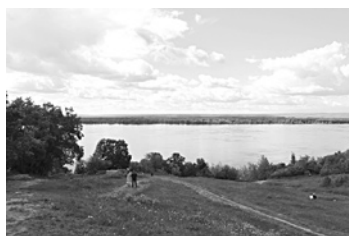
В ЗАГОРОДНОМ парке, которому вскоре присвоят статус ООПТ, «Евроальянс» разрушил асфальтовое покрытие и разрыл грунт

Сегодня на склоне парка работает несколько единиц тяжелой спецтехники, ведутся земляные работы. Происходящее привлекло внимание общественности. Одна из жительниц Самары обратилась с запросом в областной минлесхоз. Ответ ведомства опубликован в соцсети «Живой журнал». Из него следует, что на участке СК «Евроальянс» строит коллектор. «В связи с неоднократными жалобами посетителей Загородного парка подведомственное министерству ГБУ СО «Самаралес» 30 марта направило ООО «СК «Евроальянс» обращение с просьбой содержать асфальтовое покрытие в надлежащем состоянии и сообщить сроки вывоза грунта. По поступившей информации, ООО в мае 2017 года планируется завершить работы на