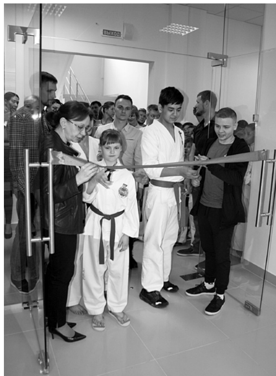
НА ТОРЖЕСТВЕННУЮ ЦЕРЕМОНИЮ ОТКРЫТИЯ спортзала собрались несколько десятков воспитанников «Квона» и «Каймана», которые затем под руководством своих тренеров продемонстрировали свое мастерство, устроив показательные выступления

По мнению руководства и коллектива ПОСКО, их вложения в детский спорт - инвестиции в будущее, потому что в школах единоборств учат детей не только технике боя, ударам или броскам, но и уделяют немаловажное значение воспитанию личности. Коллективу корпорации близки миропонимание тхэквондо, которое можно определить, как «Во вселенной все связано. Тхэквондо - это один из путей к достижению гармонии», а также философия основателя всемирно известной школы карате-кекусинкай Ояма