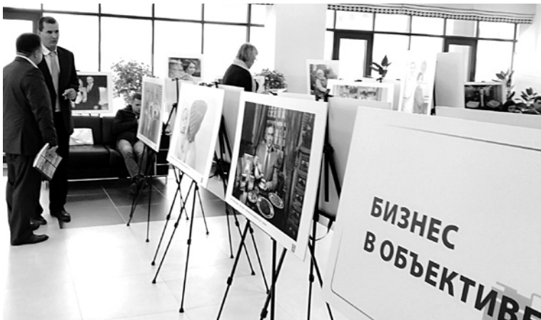
РЕГИОНАЛЬНЫЕ БИЗНЕСМЕНЫ приняли участие в социальном фотопроекте Промсвязьбанка

Промсвязьбанк запустил фотопроjekt летом 2014 года. Стратегическим партнером проекта выступает общероссийская общественная организация малого и среднего предпринимательства «Опора России». В числе других партнеров - Московская школа управления СКОЛКОВО, МСП Банк, ГБУ «Малый бизнес Москвы» и Ассоциация факторинговых компаний. Только за первые два месяца с момента запуска проекта банк получил порядка 120 заявок на участие от предпринимателей из 40 регионов. Сегодня в проекте уже приняли участие более 600 предпринимателей со всей страны: от Калининграда до Владивостока. Офлайн-выставки насчитывают сотни экспозиций, которые проходили в том числе и на таких статусных площадках, как Петербургский международный экономический форум, бизнес-конференция Russian Business Week в Лондоне, Международный экспортный форум «Сделано в России», Общественная палата России и многих других.