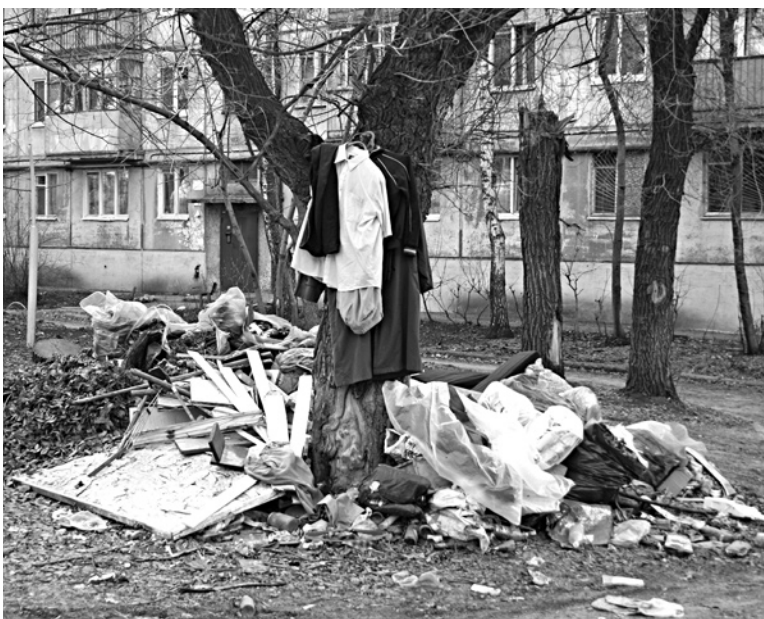
БЕЗ СТАТЬИ 10.4 областного закона «Об административных правонарушениях» справиться с коровами и с «мусорщиками» властям оказалось крайне сложно