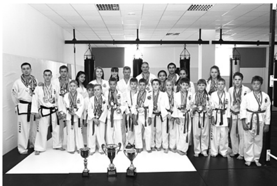
СОТРУДНИЧЕСТВО С ПОСКО приносит медали, Кубки на соревнованиях разных уровней и статусов

ПОСКО давно не ограничивается одним строительством и развивает ряд социально важных проектов, среди которых выделяются спортивные. Уже несколько лет компания активно поддерживает спортсменов двух клубов, культивирующих единоборства. Это «Школа карате «Кайман» и сармский областной клуб тхэквондо «Квон». Поддержка со стороны компании ПОСКО позволяет клубам не только достигать высоких спортивных результатов, но и удерживаться на плаву. Спортивные чиновники не скрывают, что в связи с секвестром бюджета бюджетное финансирование распространяется практически только на олимпийские виды спорта, к которым карате-кекусинкай не относится, и существует оно в регионе благодаря спонсорам. Как, в частности, «Школа «Кайман», работающая в Самаре около 16 лет. «Наши партнерские отношения с ПОСКО начались примерно пять лет назад. Благодаря этому мы можем проводить турниры в Самаре, выезжать в другие горо-