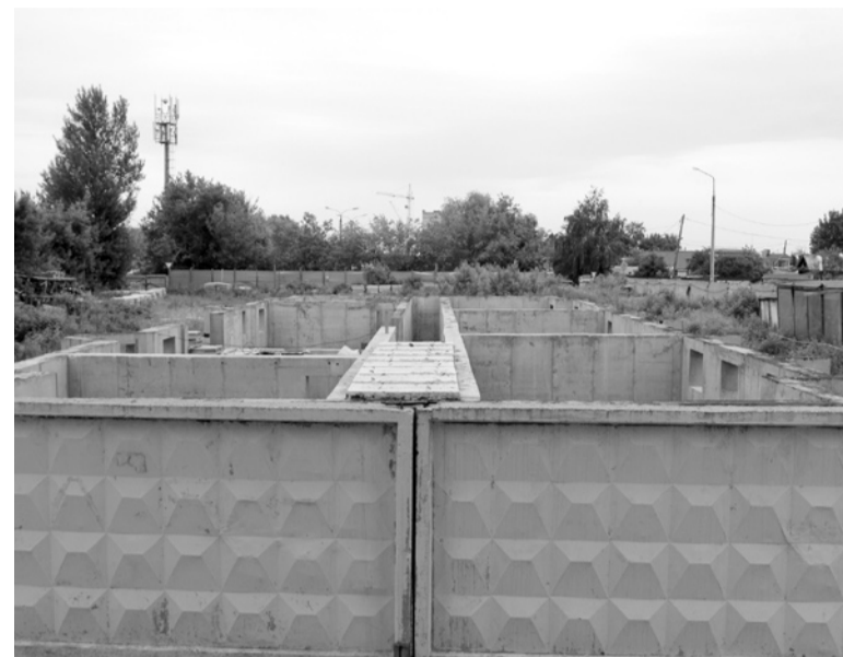
СТРОЙКА КОМПАНИИ Ефталика Пухаева и Андрея Меняева напоролась на красные линии

Строители называют попадание их площадки в красные линии ошибкой. «У нас есть все необходимые разрешения на работы. Мы уже начали строить, потратили 80 млн рублей. И вдруг возникает ситуация с красными линиями. Мы пытались договориться с мэрией, обращались к ним - но никто ничего не сделал. Это же случайность - там помимо нас два дома построили. Конечно, обидно, что мы можем понести