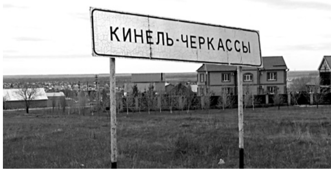
САМАРСКОЕ УФАС рассмотрит жалобу ООО «Спецстрой»