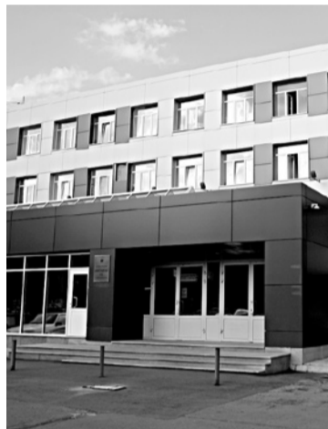
ЮРИСТЫ КОМПАНИИ БЫВАТОВА отбились от прокуроров в апелляционном суде, но проиграли в кассации и ВС РФ

состоянии. Собственность на эти земли была не разграничена, то есть не определена. Основанием для отчуждения формально послужил именно этот неопределенный статус, который позволили обвиняемым во время расследования дела утверждать, что ЗАО «Арго-Моторс» якобы приобрело землю поселений, предназначенную для садоводства. На момент рассмотрения прокурорского иска в суде первой инстанции полномочия по распоряжению земельными участками в черте городского округа Самара, собственность на которые не была разграничена, отошли органам местного самоуправления. Арбитраж установил, что в свидетельствах на право собственности на участки в районе Сорокиных Хуторов, где должен был быть возведен