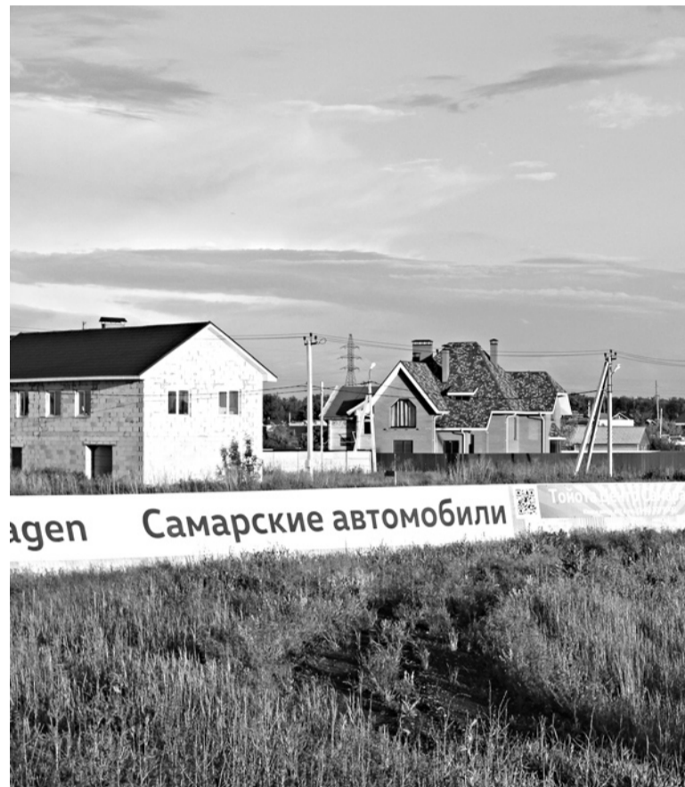
люди, ПОКУПАВШИЕ земли под ИЖС в «Завидово», и не подозревали, что очень скоро на их пути окажутся «Самарские автомобили»

Помимо этого, возникли проблемы с подводом воды и обеспечением поселка канализацией. «В связи с этим ни городские власти, ни мы сами не можем заниматься развитием инфраструктуры нашего поселка. И теперь 200 домов оказались в «ловушке», так как подключить оплаченные нами же коммуникации или благоустроить улицу возле своего дома может только тот, кто заплатил от 1,4 до 4 ты-