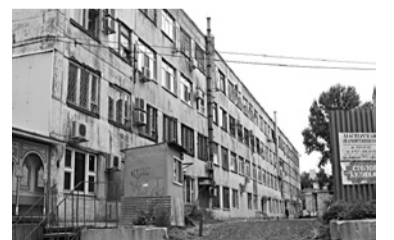
ЧИНОВНИКИ МЭРИИ Самары не против застройки пр. Кирова, 255 высотками

ООО «АВС» добилось поддержки по смене зонирования участка в Кировском районе Самары. Ранее компания обратилась в мэрию с заявкой на корректировку правовой зоны территории на проспекте Кирова, 255. Площадь участка равна 2,1 тыс. кв. м. Там «АВС» хочет построить многоквартирные дома выше трех этажей. Для этого участок необходимо перевести из зоны ПК-2 (промышленные объекты III класса опасности), к которой он относится сейчас, в Ц-3 (общественно-деловая зона районного значения). С 15 апреля по 12 июня проходили заочные публичные слушания, где