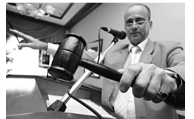
ПРОЦЕДУРА ЗАКУПКИ в Стройкерамике вызвала претензии омских и сочинских строителей

Две компании просят приостановить размещение заказа на строительство плавательного бассейна в пгт Стройкерамика Волжского района. На возведение объекта планируется направить до 70,078 млн руб. Заявки на участие в тендере принимались до 20 июня. ООО «Профит-плюс» из Сочи и омское ООО «Асвел-Консалт» посчитали, что заказчик торгов - администрация Волжского района - нарушил законодательство о контрактной системе. Предприятия направили жалобы в областное управление Федеральной антимонопольной службы. Обе фирмы указывают, что в документации установлены излишние требо-