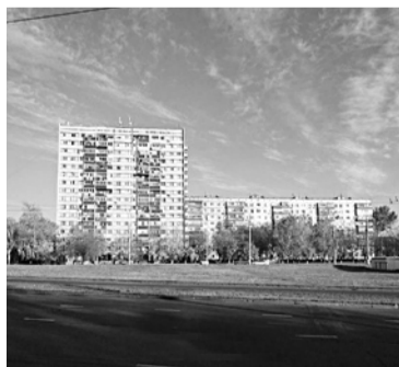
ТОЛЬЯТТИНСКАЯ МЭРИЯ не хочет принимать проект межевания территории под застройку

Мэрия Тольятти отказывается оплачивать контракт на строительство улично-дорожной сети западнее Московского проспекта. В сентябре 2015 года ООО «М-Строй» получило право выполнить проектно-изыскательские работы. Компания подготовила проект межевания площадки для определения границ участков, попавших в зону будущего строительства. На него было получено положительное заключение государственной экспертизы. Однако теперь в муниципалитете не хотят оплачивать проведенные работы. Это сообщается в отчете администрации о