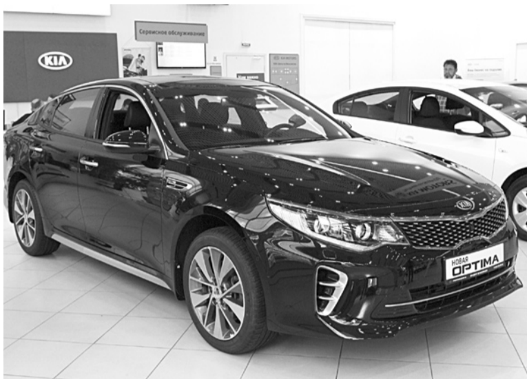
НОВАЯ KIA OPTIMA продемонстрировала комфорт и надежность

На заднем диване пассажиры могут комфортно разместиться даже при максимально отодвинутом кресле водителя, спинка заднего сиденья высокая. То, что могло бы стать незначительным минусом для водителя, - высокий подголовник, закрывающий обзор в заднее зеркало, - для пассажира очень удобно. Плечи полностью опускаются на спинку сиденья, голова ложится на подголовник. Подлокотники достаточно широки для двоих, есть два подстаканника. «Можно даже мини-бар себе организовать, - смеется тест-пилот. - Понятно, что виски со льдом нам не достанется, холодильника нет». Задний диван по ширине вполне способен вместить троих пассажиров. Не слишком комфортно, но в машине такого класса пятером не ездят. Заднее сиденье с двухпозиционным подогревом, что очень удобно для пассажиров. Зато панорамная крыша - дополнительный источник света в пасмурную или не очень солнечную погоду - в июньский день оставляет нас беззащитными перед солнцепеком.