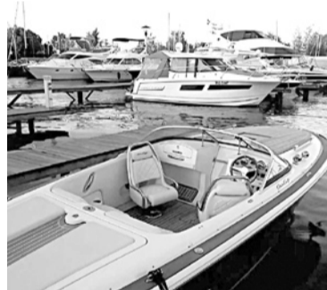
ПРОТИВ ПОТЕНЦИАЛЬНОГО ЯХТ-КЛУБА ООО «Журавель-С» вышли дачники

ных», срок их действия истечет в конце 2019 года. Информации об обременениях участка в настоящее время нет. Согласно публичной кадастровой карте, кадастровая стоимость объекта - 4 млн рублей. Однако против размещения на территории яхт-клуба выступили дачники. Так, СНТ «Сокол» обратилось в самарский арбитраж с иском к ДГС. «Сокол» требует признать незаконным предварительное согласование выделения «Журавель-С» площадки, а также исключить сведения об участке из государственного кадастра недвижимости. Дело по данному иску возбудили 18 мая 2017 года, следующее заседание состоится 26 июля. По данным «СПАРК-Интерфакса»,