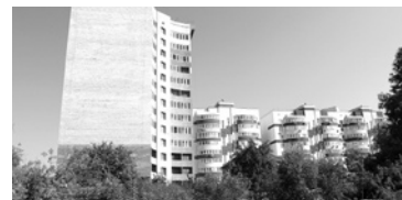
«ВЛАДИМИР» ГОТОВИТСЯ начать новую очередь ЖК «Госуниверситет» в Октябрьском районе Самары