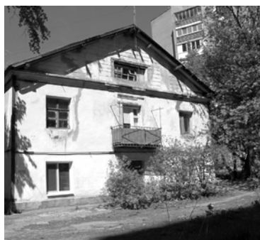
МЭРИЯ САМАРЫ с пятой попытки нашла инвестора для участка с ветхими домами