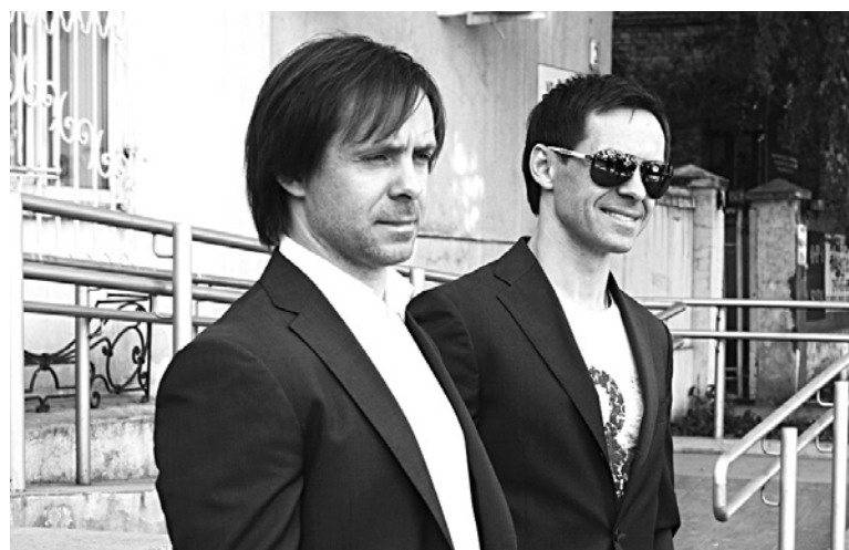
ПРЕЗИДИУМ ОБЛАСТНОГО СУДА рассматривает знаковые дела, например, жалобу «Роснефти» о взыскании 106 млн руб. с собственников и руководителей молодежного театра «Лайт»

Окружные кассационные суды станут единой инстанцией как для судебных актов мировых судей, так и в отношении судебных актов, вынесенных районными и гарнизонными военными судами. Функции президиума областного суда ограничат организационными вопросами.