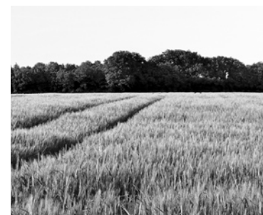
У «АМЕЛИИ» забрали 204 га земли в Приволжском районе