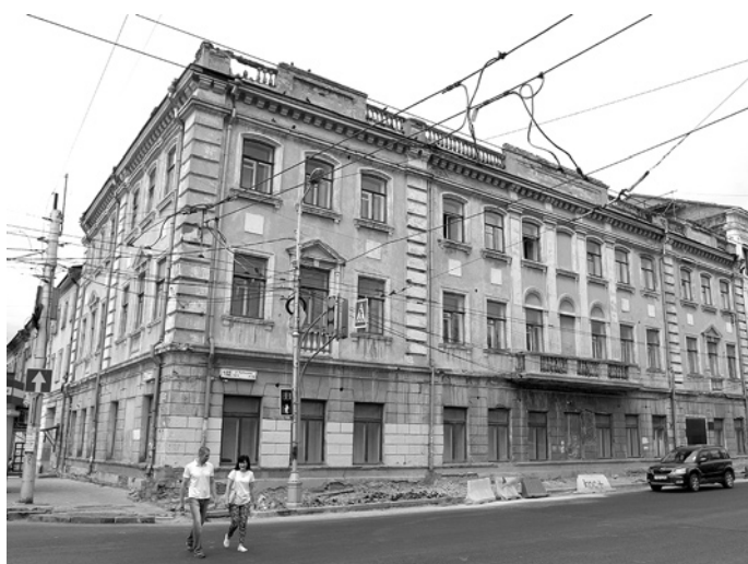
34,644 МЛН РУБЛЕЙ освоит подрядчик на ремонте ОКН