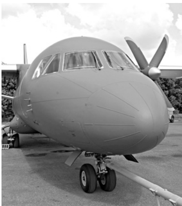
ОПЕРАТОР ПРОИЗВОДСТВА Ан-140 на самарском авиазаводе может быть признан банкротом

ОАО «Авиакор - авиационный завод» пытается инициировать банкротство ЗАО «Совместное предприятие международный авиационный проект-140». С соответствующим иском предприятие обратилось в Арбитражный суд Самарской области 21 июля. ЗАО создано в 2003 году «Авиакором» совместно с Харьковским государственным авиационным производственным предприятием в рамках договора о развитии программы воздушного судна Ан-140. Однако в 2014 году из-за накалившихся российско-украинских отношений проект был остановлен, а самарский авиазавод полностью прекратил производ-