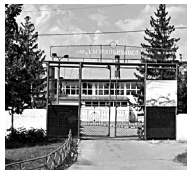
«ПЕРВЕНСТВОТОРГ» ЗАБИРАЕТ часть имущества «Сызраньмолока»

Оборудование ОАО «Сызрань-молоко» отошло в собственность ООО «ПервенствоТорг». Банкротящийся сызранский завод принадлежит холдингу «Карат». Недвижимость и оборудование «Сызраньмолока» выставлялись на торги дважды. На повторных торгах покупателем активов выступило московское «Гранд-Корус», предложившее за имущество чуть больше 30 млн рублей. Однако компания уклонилась от выплаты денег и заключения договора купли-продажи. В итоге поделенное на два лота имущество завода выставили на продажу посредством публичного предложения. Претендентом на первый лот - оборудование «Сызраньмолока» - стало московское ООО «ПервенствоТорг». Компания получила сепараторы, емкости для хранения молока, линии по производству глазированных сырков сызранского завода за 3 млн рублей. Торги по продаже второго лота - недвижимости «Сызраньмолока»