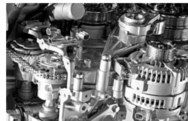
РСА ПОВТОРНО актуализирует справочники в августе

Российский союз автостраховщиков (РСА) планирует с 1 августа 2017 года ввести в действие новый актуализированный справочник средней стоимости запасных частей, который будет соответствовать практике натурального возмещения в ОСАГО. Соответствующее решение принято правлением РСА. Введение в действие актуализированного справочника повлечет уменьшение средней стоимости запасных частей на 8%. Предыдущая актуализация состоялась более месяца назад. Эта версия оставила среднюю стоимость запасных частей на прежнем уровне, что было важно