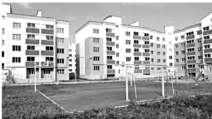
ДЛЯ СТРОИТЕЛЬСТВА улицы Путевой потребуется изъятие 317 тыс. кв. м земель

Правительство Самарской области утвердило документацию по планировке территории по второму и третьему этапам строительства ул. Путевой в областном центре. Заказчиком проекта выступило региональное министерство транспорта и автомобильных дорог, генеральным проектировщиком - ЗАО «ППСО «АО «Авиакор». Общая площадь земельных участков в границах зоны планируемого размещения автодороги - 443,55 тыс. кв. м. Из них большая часть - 317,82 тыс. кв. м - в собственности третьих лиц и будет изъята в постоянное пользование для государственных нужд. Они находятся в Красноглинском районе Самары, СДТ «Железнодорожник», поселке Красный Пахарь, и относятся к землям населенных пунктов. Всего таких участков, поставленных на кадастровый учет, - 95. Впервые о строительстве дороги было заявлено в 2012 году. Сегодня улица Путевая является дорогой областного значения. Она проходит от поселка Красный Пахарь до ул. Олимпийской. Как объясняли чиновники, реконструкция дороги должна повысить транспортную доступность жилого района «Крутые Ключи», который строила «Корпорация КОШЕЛЕВ».