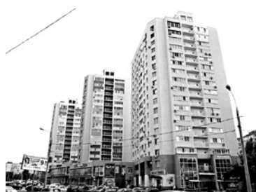
ЗАСТРОЙЩИК ЖК в Промышленном районе прекратит существование

у менеджеров «Бригантины» возникли разногласия с основным совладельцем компании - ЗАО «Вершина». Последнее владеет 99,99% долей в ООО. В «Бригантине» указывали, что передали «Вершине» по договорам займа 374,4 млн руб., однако полностью вернуть эти средства не смогли. В октябре 2015 года областной арбитраж постановил взыскать с «Вершины» в пользу «дочки» 353,126 млн руб. Судя по всему, финансовое положение застройщика осталось нестабильным. В феврале 2017 года