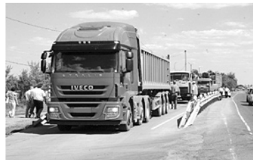
О НАРУШЕНИЯХ ВЕСА грузовиков перевозчиков оповестят сразу во время поездки

нее 500 таких пунктов, чтобы система работала эффективно. За минувшие пять месяцев работы пунктов в РФ отмечено снижение в четыре раза числа нарушений по весу и габаритам. Также до 2,5% сократилась доля нарушителей от общего потока грузовиков. Для российских перевозчиков проблема весогабаритного контроля видится более острой, чем внедрение системы «Платон». К примеру, максимальный штраф для работающих в этой сфере компаний достигает 20 тыс. рублей. Что касается перегруза, то там цифры в разы больше - от 150 до 500 тыс. рублей. Ежемесяч-