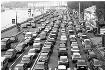
ПРАВИЛА ДОРОЖНОГО ДВИЖЕНИЯ сделали более емкими

Правительство РФ утвердило изменения в ПДД. Постановлением №832 от 12 июля добавлены новые термины («электрокар», «гибридный автомобиль», «островок безопасности» и ряд других), старые доработаны и дополнены. Также введены новые дорожные знаки - «Зона с ограничением экологического класса механических транспортных средств», «Зона с ограничением экологического класса грузовых автомобилей» и другие. Новые термины и знаки понадобились в связи с ускоренным развитием экологически чистого вида транспорта с целью обозначения мест парковки электромобилей и обеспечения возможности их парковки. Согласно постанов-