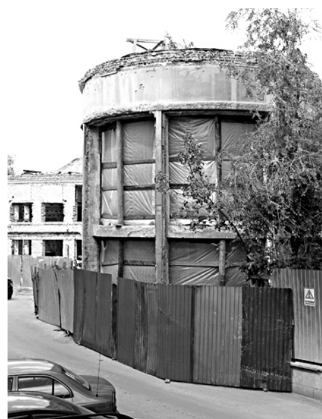
ОГРАНИЧЕНИЯ УГООКН по охранной зоне Фабрики-кухни напрямую касаются территории стадиона «Волга»