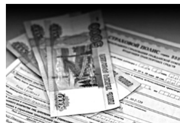
СТОИМОСТЬ ОСАГО может сравняться со стоимостью добровольного автострахования

Страховщики, Центробанк и Минфин провели закрытое совещание, итогом которого стало решение о дальнейшей либерализации тарифов ОСАГО. Если чиновники прислушаются к страховому лобби, то стоимость автогражданки может сравняться со стоимостью добровольного автострахования. К окончательному решению стороны не пришли, но простым автомобилистам в следующем году стоит ждать значительного повышения тарифов ОСАГО. Страховщики по-прежнему настаивают на убыточности работы в сегменте автогражданки и предлагают