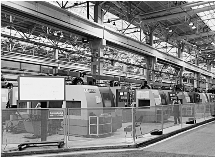
БОЛЬШИНСТВО САМАРСКИХ ОБОРОНЩИКОВ, в отличие от «Авиаагрегата», справились с инвестпроектами по техническому перевооружению