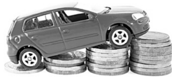
ЗА ПОСЛЕДНИЙ МЕСЯЦ у 22 производителей выросли цены на новые легковые автомобили

1,2-1,8%, седана on-DO на 1,4-2,7%. Ford повысил стоимость седана и хэтчбека Fiesta на 0,5-1,5%; седана, хэтчбека и универсала Focus на 0,9-1,3%; седана Mondeo на 0,8-1,1%; кроссовера EcoSport на 0,8-1,3%. Цена кроссовера Kuga с передним приводом снижена на 1,9-2,5%. Renault увеличил цену седана Logan на 0,6-4,2%, кроме комплектации Luxe Privilege. Цена хэтчбека Sandero в комплектации Access выросла на 1,9%, в комплектации Confort (1,6 л, 113 л.с.) - на 3,3%. MINI поднял цены на Clubman (на 8,5-14,3%) и One (на 4,5-12,5%, кроме комплектаций John Cooper Works). Land Rover поднял цену на Range Rover Evoque с бензиновым двигателем 2,0 л (240 л.с.) на 0,1% и пополнил линейку модели новыми комплектациями с дизелем 2,0 л (180 л.с.) за 3,118-4,106 млн