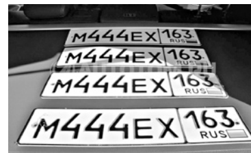
ДАННЫЕ О НОВЫХ МАШИНАХ станут пересылать в ГИБДД в электронном виде, а номера дилеры будут печатать на специальном оборудовании

МВД готовит очередной этап масштабной реформы процедуры государственной регистрации транспортных средств. Самое важное нововведение состоит в том, что дилеры получат право сами выдавать номера. Новая редакция закона предполагает пересылку данных о новых машинах в ГИБДД в электронном виде, а номера будут печататься на специальном оборудовании, которое может приобрести дилер. Курьеру нужно лишь заехать в ближайшее подразделение за свидетельством о регистрации транспортного средства (СТС). В связи с реформой планируется ужесточить контроль над фирмами, изготавливающими регистрационные номера. Такие фирмы включают в специальный