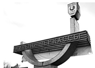
ПРОЕКТ СТРОИТЕЛЬСТВА кирпичного завода в Кинель-Черкасском районе еще подождет

Министерство лесного хозяйства, охраны окружающей среды и природопользования Самарской области не смогло привлечь инвестора для добычи кирпичной глины. Месторождение Эштебенькинское расположено в Челно-Вершинском районе, близ села Чувашское Эштебенькино. 23 мая этого года стартовал прием заявок на участие в аукционе по предоставлению лицензии на разведку и освоение участка сроком на 10 лет. Площадь месторождения равна 0,155 км, запасы глины по категории С достигали 709 тыс. куб. м.