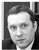
СЕРГЕЙ БЕЗРУКОВ, министр промышленности и технологий Самарской области

Нефтехимический комплекс Самарской области, если говорить языком цифр, - это 500 млрд рублей объема производства в стоимостном выражении. Это самая значимая отрасль в нашем регионе, на нее приходится 81% всех налоговых поступлений от промышленности Самарской области и 53% налоговых поступлений по экономике региона в целом.