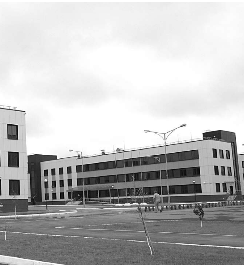
С 2016 ГОДА четыре компании-резидента покинули технопарк в поисках лучших условий аренды

- Это проблема государственного предпринимательства, оно делает так, как ему нужно и удобно, не подстраивается под людей, которых приглашают туда. Вроде бы это все делается для нас, для предпринимателей, но никто не интересуется нашими запросами. Стоило нам только уехать, нам посылке пришло письмо с предложением обсудить транспортную проблему доступности «Жигулевской долины». Пока проблема не дойдет до крайней точки, она не решается. Это касается всего государственного предпринимательства. Они вроде бы работают на стартапы, инновации, предпринимателей, но не находят с ними точек пересечения. Людям, которые руководят этой темой, это то ли не интересно, то ли не является отчетным пунктом. В итоге структура, которая должна помогать бизнесу, оказалась закрытой для проблем и потребностей предпринимателей.