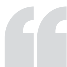
ОЛЬГА ГАЛЬЦОВА, уполномоченный по правам человека в Самарской области

Проблемы, о которых говорили граждане в ходе целевого приема, мне знакомы. В ежегодном докладе уполномоченного мы неоднократно говорили о нехватке мест в детских садах, и что в перспективе эта проблема коснется школ, а также о том, что недопустима квартальная застройка территорий без строительства социальной инфраструктуры.