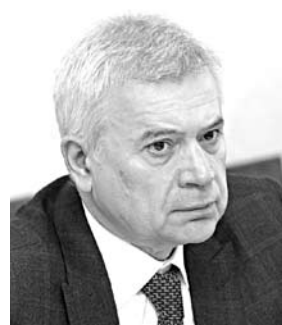
ВАГИТ АЛЕКПЕРОВ, глава НК «ЛУКОЙЛ»