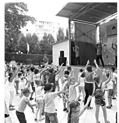
БОЛЕЕ 1500 ЧЕЛОВЕК ежегодно принимают участие и в организуемом НК НПЗ городском экологическом фестивале «Экофест»

участие и в организуемом новокуйбышевскими нефтепереработчиками городском экологическом фестивале «Экофест». Как правило, все самые масштабные и интересные праздники в Новокуйбышевске проходят при поддержке нефтяников. День города в г.о. проводится в один день с Днем нефтяника, и это объяснимо: большая часть жителей муниципалитета являются сотрудниками НПЗ и других дочерних предприятий НК «Роснефть». А в скором времени новокуйбышесцы получат от НК «Роснефть» еще один подарок. В IV квартале 2017 года в городе планируется запуск спортивного комплекса «Роснефть Арена». Это будет третий дворец в Самарской области, построенный при поддержке федеральной компании (два других - в Сызрани и Отрадном), и первый ледовый дворец для Новокуйбышевска. В течение 2014-2016 гг. Новокуйбышевским НПЗ на его строительство выделен 351 млн рублей.