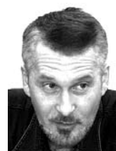
СЕРГЕЙ СИМАК, председатель центрального совета Российской зеленой лиги

Первая причина таких мутаций - резкое изменение условий жизни рыб. Это стресс, изменение температурного режима, накопление в воде очень большого количества загрязнителей. Если до регулирования Волги вода от Валдая до Каспия доходила за 2 недели, то сейчас - за 4 месяца. При этом она нагревается, резко увеличился приток различных загрязнений. А так как вода стала стоячей, они в ней накапливаются в большом количестве.