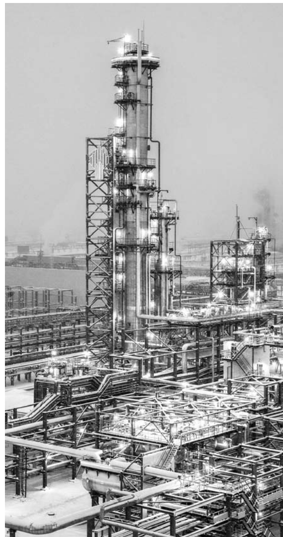
ВВОД В ЭКСПЛУАТАЦИЮ современных установок позволяет увеличить объем и глубину переработки нефти

Сохранение самарскими НПЗ бюджета программы модернизации способно нивелировать наблюдаемое снижение объема переработки. По данным министерства экономического развития и инвестиций области, в первом полугодии 2017 года по виду экономической деятельности «производство нефтепродуктов» наблюдался рост. Он составил 1,1%, причем существенную корректировку показателя произвели результаты работы представителей отрасли в июле текущего года. ■