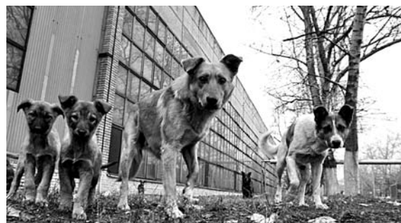
БРОДЯЧИЕ СОБАКИ вокруг инновационного парка наводят страх на сотрудников, возвращающихся вечером домой пешком по автодороге

«Решать вопрос доступности общественного транспорта предлагается арендаторам