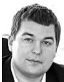
АЛЕКСАНДР СТЕПАНОВ, заместитель председателя Самарской губернской думы