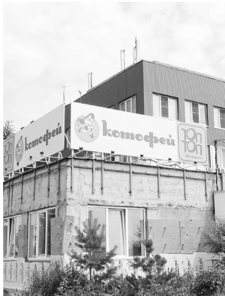
БРАЗДЫ ПРАВЛЕНИЯ «Обувьпромом» перешли к «Котофею»