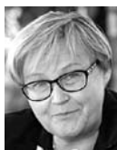
НАДЕЖДА КОЛЕСНИКОВА, депутат Государственной думы

Думаю, на практике это не будет реализовано. Поскольку речь идет про оплаченный день отдыха, бизнес в этой ситуации несет издержки. Ни один коммерсант этого делать не захочет. И я думаю, что на предприятиях будут легко обходить эту норму, и люди ничего не получают, кроме бюджетников, на которых можно воздействовать и административными рычагами.