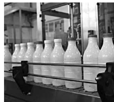
МОЛОЧНАЯ ПРОДУКЦИЯ «Села Домашкино» будет выпускаться на Нижнекамском молочном комбинате