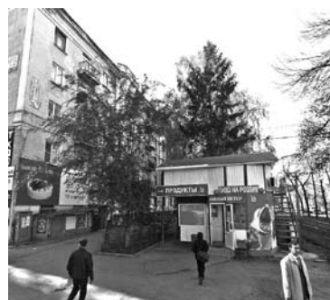
ЖИТЕЛИ САМАРЫ могут недосчитаться заметного количества привычных для них магазинов и рынков

Если инициатива «СКС» будет поддержана прокуратурой и выльется в массовые сносы, жители Самары могут недосчитаться заметного количества магазинов, рынков и даже кафе, которые они привыкли посещать. В черном списке фигурируют торговые ряды «Шипка», павильоны рынка «Норд» на пересечении улиц XXII Партсъезда и Мальцева, мини-магазины, входящие в состав рынка «Шапито» на пересечении улиц Димитрова и