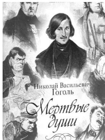
У НЕКОТОРЫХ работников оперного театра то, что стало происходить с появлением сотрудников правоохранительных органов, вызывало прямые ассоциации с поэмой Николая Гоголя