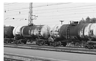
ОБЪЕМ ПЕРЕВОЗОК бензина и дизельного топлива ПГК за первое полугодие вырос на 65%

Самарский филиал АО «Первая грузовая компания» (ПГК) в первом полугодии 2017 года на 45% увеличил объем погрузки нефтепродуктов по сравнению с аналогичным показателем прошлого года. Как сообщают в компании, за отчетные 6 месяцев филиал перевез 2,5 млн тонн нефтепродуктов в цистернах. Грузооборот филиала за шесть месяцев вырос на 44%, составив 3,4 млрд ткм. Доля ПГК в общем объеме перевозок в цистернах по Куйбышевской железной дороге (КбшЖД) выросла с 9% до 13%. Основную номенклатуру грузов составили бензин и ди-