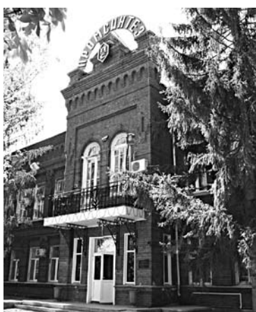
«ПРОМСИНТЕЗ» прокредитуется в ТКБ БАНК