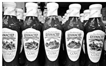
«КУХМАСТЕР» получил максимальную за последние пять лет прибыль