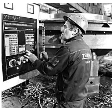
ШАНСЫ «ТЯЖМАША» победить в борьбе за контракт российской группы алмазодобывающих компаний тают на глазах

Решение антимонопольной службы по жалобе АО «Тяжмаш» на проводившийся ПАО АК «АЛРОСА» конкурс признали незаконным. Жалоба «Тяжмаша» в антимонопольное ведомство касалась результатов конкурса ПАО АК «АЛРОСА» на право заключения договора на поставку аналогов барабанов мельницы ММС «Роксайл», в комплекте с загрузочной и разгрузочной цапфами, венцовой шестерней, вал-шестерней. Как писало «СО», исход конкурса не устроил «Тяжмаш»: на предприятии посчитали, что при проведении конкурса были сразу по нескольким пунктам нарушены положения закона о закупках. Сызранский завод обратился с