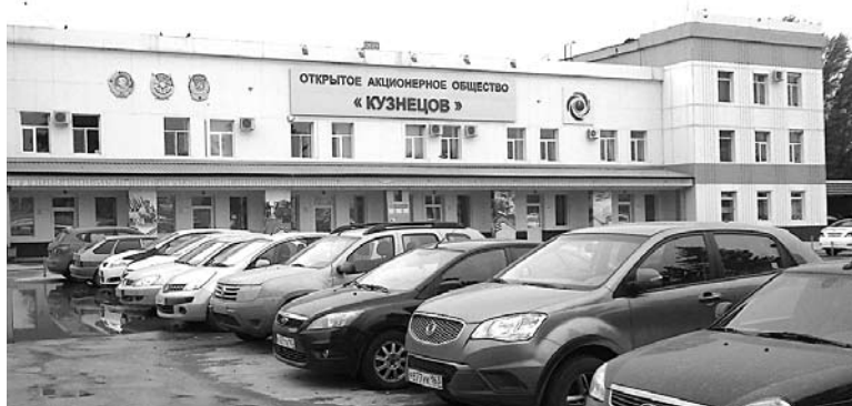
ГРУППА «КУЗНЕЦОВА» продемонстрировала растущие минусы вместо обещанных ранее «принципиально иных показателей»

Однако ситуация в итоге оказалась еще хуже. Соответствующая информация содержится в консолидированной финансовой отчетности груп-