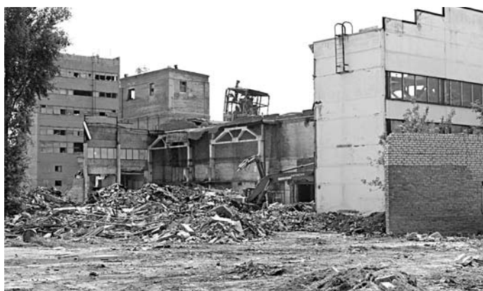
ФЕДЕРАЛЬНЫЙ РИТЕЙЛЕР приступил к освоению площадки в Промышленном районе Самары

ООО «ХК «Новолекс» получило разрешение на строительство торгового комплекса «Лента» в Промышленном районе Самары. Информацию об этом 10 октября раскрыло министерство строительства Самарской области. Согласно данным ведомства, разрешение на возведение объекта на ул. Физкультурной, 143 выдали в конце августа. Действовать оно будет до 28 августа 2018 года. О планах возведения ТК на площадке бывшего завода ЖБИ в Промышленном районе известно с 2014 года. В прошлом году ООО «Лента» меняло зонирование участка под строительство. В городском департаменте градостроительства уточняли, что площадь нового объекта составит 11,3 тыс. кв. м. В настоящее время торговая сеть управляет четырьмя гипермаркетами в регионе. Кроме того, ритейлер рассчитывал строить комплекс на ул. Юбилейной в Тольятти и на площадке Самарского хлебозавода №9 в Самаре. ООО «ХК «Новолекс» зарегистрировано в Новосибирске. Компанией владеют Анна Филиппова и Евгений Филиппов.