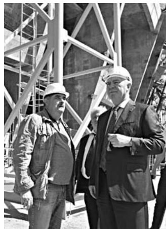
СРОКИ НАЧАЛА монтажа плитки на площадке у «Самара Арены» оказались разными у подрядчика и региональных чиновников

Местные чиновники и генподрядчик строительства «Самара Арены» заявили о старте благоустройства площадки досрочно.