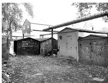
ИНВЕСТИР ПРОБЛЕМНОГО НЕДОСТРОЯ компании «Кросс» рассчитывает вести жилую застройку на компенсационных землях

Предыдущее разрешение на разработку документации для участка в границах ул. Гагарина, Победы, Первого Безымянного переулка в Советском районе «ПОСКО» получила в ноябре 2016 года. Площадь территории составила 8,73 га. На разработку документации отводилось 12 месяцев. Компания не уложились в этот срок, в связи с чем в ДГС продлили разре-