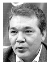
ЛЕОНИД КАЛАШНИКОВ, депутат Государственной думы от Самарской области (КПРФ)

Пришла новая команда, которая состоит из людей, которым губернатор доверяет. Я не вижу принципиальной разницы между Когтевым и предыдущим представителем. Обоим знаю, и ни к кому негативного отношения нет. Нужно понимать, что представитель региона в Москве - это особый человек. У него должны быть связи и в правительстве, и в других кругах. У Когтева все это есть. Он там всех знает.