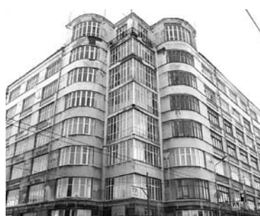
ФАСАД ДОМА промышленности приведут в порядок до апреля 2018 года

ООО «Спецрестрой» зарегистрировано в Самаре в 2016