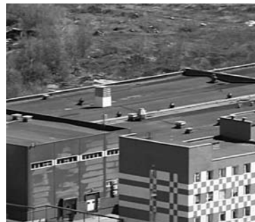
«РОДНИК» ЗАЛОЖИЛ продукцию и сырье