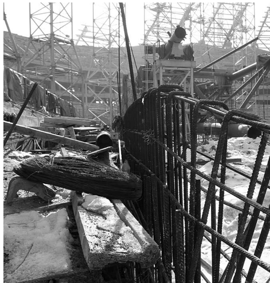
ПРЕДПРИЯТИЮ РАВИЛЯ ЗИГАНШИНА придется объяснить федеральным чиновникам, почему в строящемся стадионе появились дефекты сварных швов металлоконструкций и трещины в осях

С 21 августа по 15 сентября 2017 года Ростехнадзор провел очередную проверку «Самара Арены». Тогда выяснилось, что множественные нарушения ПСО