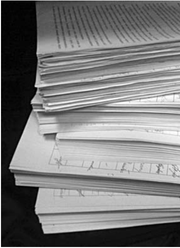
В СЫЗРАНИ поправят красные линии в квартале на ул. Урицкого

Согласно постановлению мэрии Сызрани, по кварталу необходимо будет разработать документацию по планировке и межеванию территории, чтобы изменить расположение красных линий. От физических и юридических лиц ожидают предложения по порядку, срокам подготовки и содержанию документации. Готовый проект будет проверен на соответствие требованиям Градостроительного кодекса РФ, генерального плана и Правил застройки и землепользования Сызрани. Также при проектировании необходимо учесть границы охранных зон объектов культурного наследия.