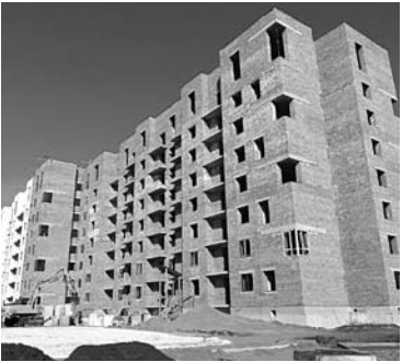
ТОЛЬЯТТИНСКИЙ ЗАСТРОЙЩИК задерживает сдачу двух очередей жилого комплекса