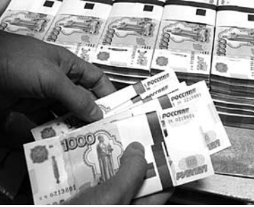
17,5 МЛН РУБЛЕЙ хочет выручить арбитражный управляющий «Автополимера» за активы в Тольятти