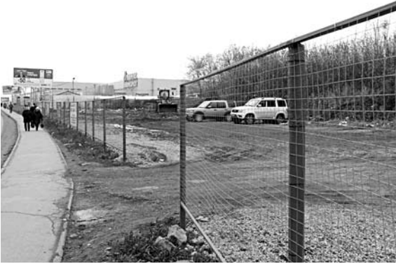
УЧАСТКИ В СОВЕТСКОМ РАЙОНЕ готовят к застройке