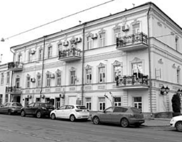
ТОЛЬКО «САМАРАРЕСТАВРАЦИЯ» заинтересовалась торгами на право ремонта здания на ул. Фрунзе, 120

Торги на право ремонта дома штабс-капитана Николая Залесова, расположенного на ул. Фрунзе, 120, объявляли 27 сентября 2017 года. Заказчиком выступило МБУК Самары «Самарский литературно-мемориальный музей им. Максима Горького». Здание, построенное в конце XIX века, является памятником культуры регионального значения. Границы зоны охраны для него не установлены. В настоящее время в доме располагаются офисные учреждения. Начальная стоимость контракта на ремонт ОКН составила 12,36 млн