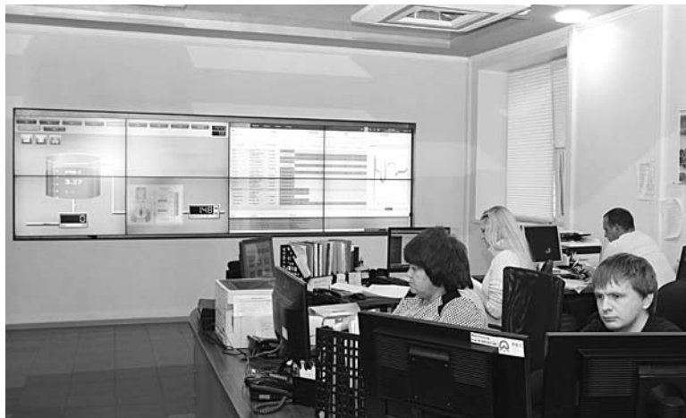
В САМАРЕ уже запущен и эффективно действует так называемый цифровой водоканал