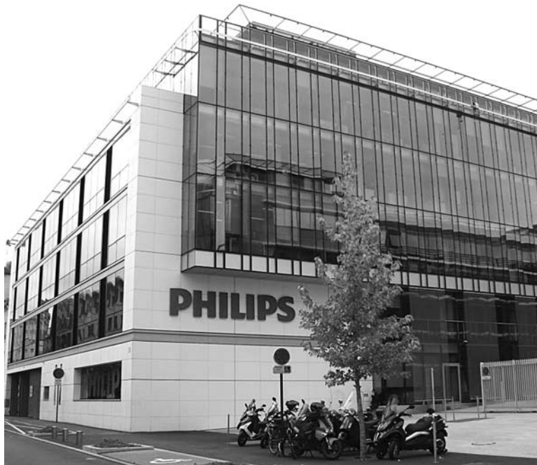
С «ФИЛИПСОМ» ООО «СМТ» работать приятнее, а «ДжиИ Хелскеа» их «кидали неоднократно»

Второй важный момент, о котором необходимо договориться заранее, - до каких цифр спускаться обоим «партнерам» во время аукциона. Здесь появляется новая опасность, о которой вскользь упоминалось ранее, - демпингующие иногородние конкуренты. «Прогнозно я могу предположить, что найдется с десяток, ну, с десяток ... компаний, которые увидят цифру и захотят прийти и теоретически могут этот аукцион опустить в пол, даже не просто в пол, а ниже пола уйти, а потом что с этой радостью делать?! Здесь нуж-