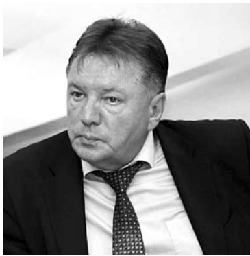
ГЛАВА СТАВРОПОЛЬСКОГО района пообещал завершить все работы по созданию комфортной городской среды к 1 декабря