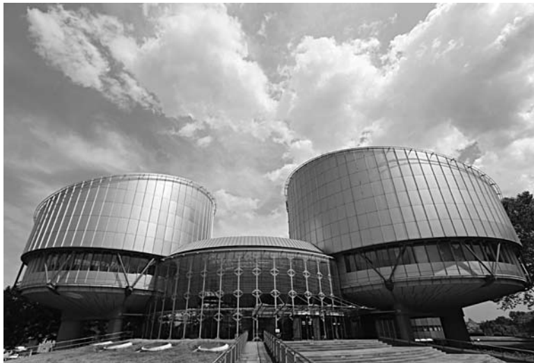
ЕСПЧ НАЧАЛ РАССМАТРИВАТЬ российские жалобы в массовом порядке, поэтому суммы компенсационных выплат по таким делам скоро вырастут