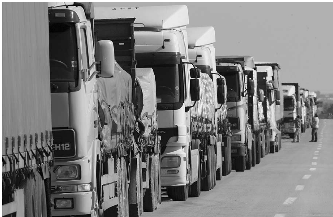
ИГРОКИ РЫНКА автомобильных грузоперевозок говорят, что рынок перегрет, из-за чего многие компании идут на серьезный демпинг