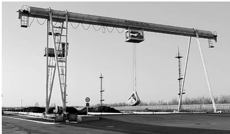
БОЛЕЕ 15 МЛРД РУБЛЕЙ АО «Самаранефтегаз» направило на реализацию природоохранных мероприятий