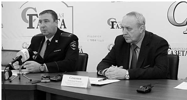
ВЛАСТИ САМАРЫ вместе с ГИБДД сделали уже немало для повышения безопасности детей на дороге, но их усилия могут перечеркнуть неосторожные примеры поведения родителей