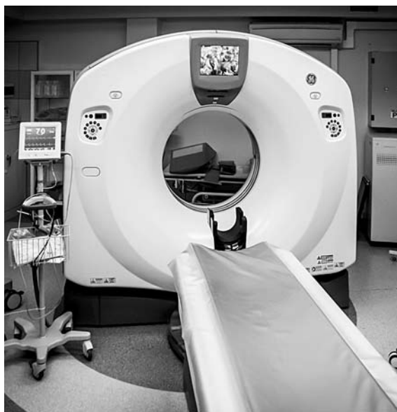
НА ДОРОГОСТОЯЩЕМ КТ, оказывается, может стоять неоригинальная рентгеновская трубка. И всех это устраивает

Можно ли на дорогое фирменное медицинское оборудование ставить неоригинальные запчасти? Как выясняется, с точки зрения самарских чиновников минздрава, очень даже можно. Эта тема в числе прочих всплыла в процессе работы сотрудников ФСБ.