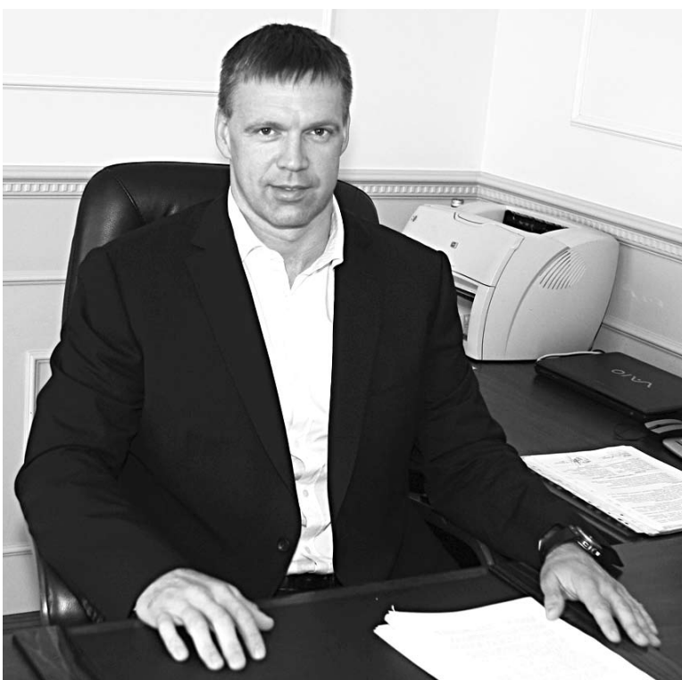
ЗА МНОГОМИЛЛИОННУЮ НЕДОИМКУ бывшему директору завода грозит до 6 лет колонии