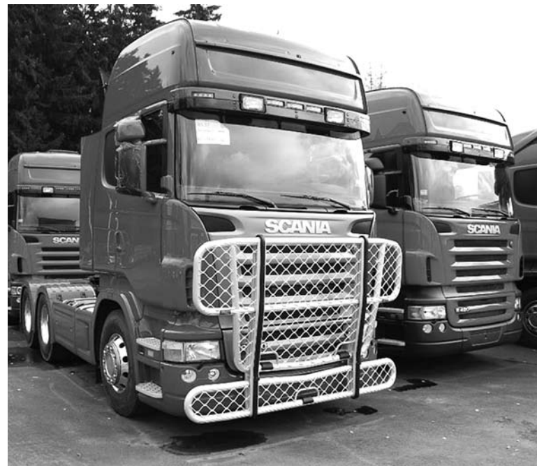
«АЛЬМАКС-ПРОМ» и «Бизнес-Авто» могут поменяться позициями