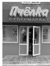
ВОЛЖСКИЙ СОЦИАЛЬНЫЙ БАНК выбыл из числа кредиторов оператора «Пчелки» и «Карамели»