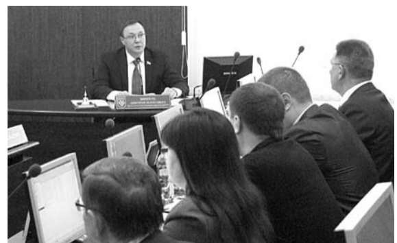
ПРИ ПРИНЯТИИ БЮДЖЕТА тольяттинские депутаты руководствовались приоритетами, установленными главой государства и руководителем региона

«Приоритетной остается программа формирования комфортной городской среды, реализация которой обязательно должна вестись с учетом мнения тольяттинцев. Кроме того, допол-