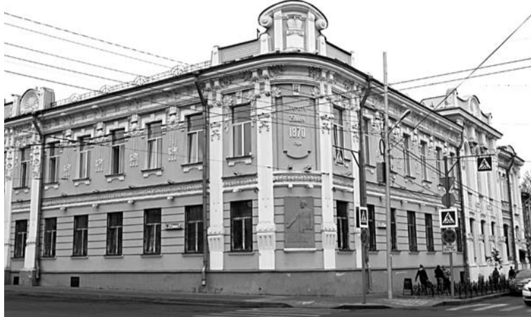
САМАРСКИЙ ОБЛАСТНОЙ суд посчитал действия обвиняемых незаконной банковской деятельностью, хотя защита и была против