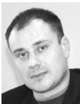
ЛЕВ ПАВЛЮЧКОВ, политолог

Симонов и Волков увеличивают свое личное политическое влияние. Что касается выведенных господ, то можно сказать, что их политический сезон или завершен, или завершается. И Борисов, и Носков в общественном процессе были, есть и останутся, а политическая история, я думаю, их самих утомила. Дурова и Чихирев - довольно незначительные фигуры, поэтому они просто попали под ротацию.