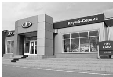
«КРУМБ-СЕРВИС» НЕ УСПЕЛ ликвидироваться до начала конкурсного производства