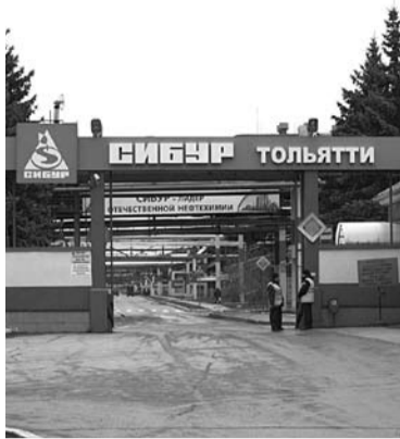
ПРОДУКЦИЮ «СИБУР ТОЛЬЯТТИ» стали закупать в Южной Америке и Эквадоре

Холдинг «СИБУР» в 2017 году расширил географию сбыта на экспорт продукции, произведенной на трех площадках - в Воронеже, Тольятти и Красноярске. Как сообщили «СО» в ООО «СИБУР Тольятти», список направлений, куда поставляется тольяттинский каучук, пополнился Южной Америкой и Турцией. Кроме того, впервые за несколько лет осуществлены поставки в Аргентину, Венесуэлу и Эквадор. В частности, в Эквадор отгружался бутилкаучук производства «СИБУР Тольятти». Всего тольяттинское ООО ежегодно отправляет на экспорт 60% своей продукции,