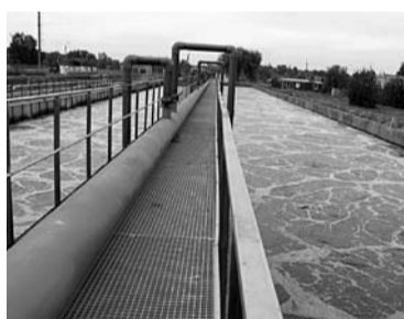
НОВЫЕ АЭРАТОРЫ «СКС» повысят качество и надежность очистки сточных вод

Более 1 млрд рублей планирует вложить ООО «Самарские коммунальные системы» в реконструкцию городских очистных канализационных сооружений (ГОКС). Программа модернизации ГОКС рассчитана до 2019 года и предусматривает несколько этапов реализации. На первом этапе, в 2015-2016 гг., как сообщили «СО» в «СКС», была произведена замена воздухоподушек - оборудования для подачи сжатого воздуха в резервуары (аэротенки) со сточными водами. Там стоки перемешиваются с активным илом, в результате чего происходит биологическая очистка воды.