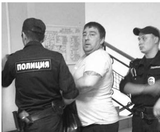
ЧЛЕНЫ «ЗАКОНОВСКОЙ» ОПГ не убивают друг друга, а сажают