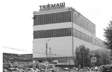
«ТЯЖМАШ» ГОТОВИТСЯ к изготовлению оборудования для «Полиметалла»

«Мельницы имеют стандартный типоразмер: подобные машины неоднократно поставлялись на различные горнорудные предприятия России и стран ближнего зарубежья. Однако для повышения эксплуатационных