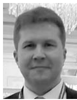
КОНСТАНТИН ПРЕСНЯКОВ, руководитель департамента информационных технологий и связи Самарской области