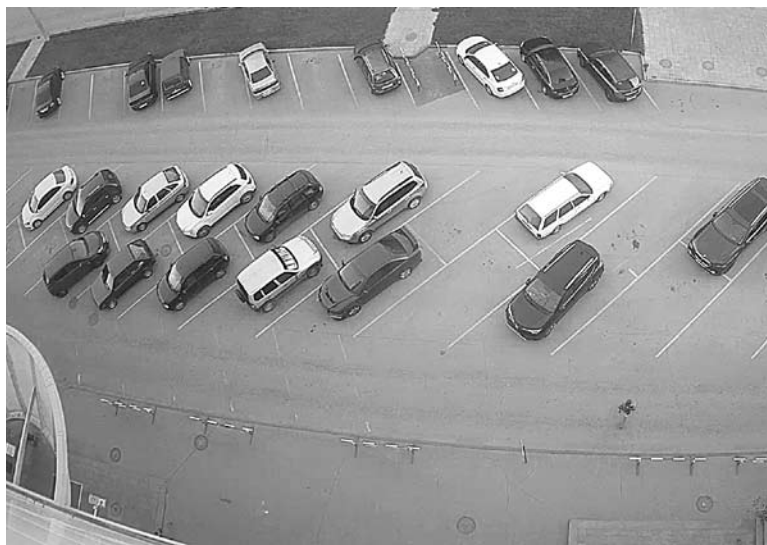
«УМНЫЕ» КАМЕРЫ оповестят автомобилистов об эвакуации или взломе автомобиля

До весны 2020 года SmaSS создавали и продвигали магазины без кассиров в США и Европе вместе с иностранными партнерами. «Делали некий аналог Amazon GO, только в 20 раз дешевле. Магазин работает полностью на камерах, а его настройка производится через обычный планшет, мы решили, что так удобнее. Из-