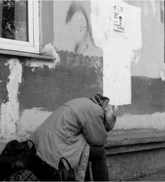
ЗА ПОБЕДИТЕЛЕЙ ВЫБОРОВ в райсоветы проголосовали всего 8,65% от избирателей Самары

Целая батарея примеров - в Октябрьском районе, где при низкой явке победили кандидаты от