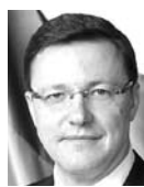
ДМИТРИЙ АЗАРОВ, губернатор Самарской области

«Жилье и городская среда» - по большому счету единственный нацпроект, который дает возможность максимального вовлечения людей в его реализацию. Важно делать людей участниками национальных проектов. Они именно потому являются национальными, что их важность признает абсолютное большинство жителей. Вы должны дать людям возможность, создать условия для их участия в нацпроектах. Это задача, равнозначная той, которую мы решаем, благоустраивая ту или иную территорию. Мы не допустим ошибок при проектировании, при выполнении работ, если будем делать это вместе с людьми.