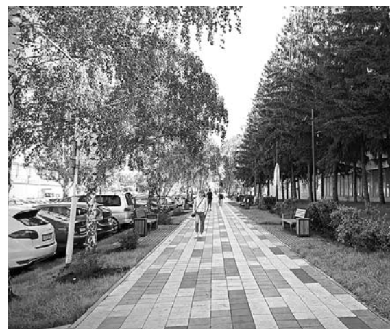
ОБНОВЛЕННУЮ УЛИЦУ МИЧУРИНА теперь совсем не узнать

Скейт-парк в Зубчаниновке (сквер имени Александра Невского)