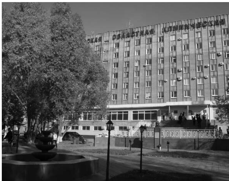
СТРАХ ПЕРЕД COVID-19 побуждает многих людей ехать на анализы и требовать госпитализации, даже если подтверждается только пневмония

Судя по данным, которые были предоставлены «СО» в октябре, в последующие месяцы резкого спада не произошло. Напротив, 2020 год, очевидно, ставит здесь печальный рекорд, так как за 9 месяцев зарегистрировано 1295 случаев заболевания пневмонией на 100 тысяч человек населения. Это в три с лишним раза больше, чем за тот же период прошлого года (тогда показатель