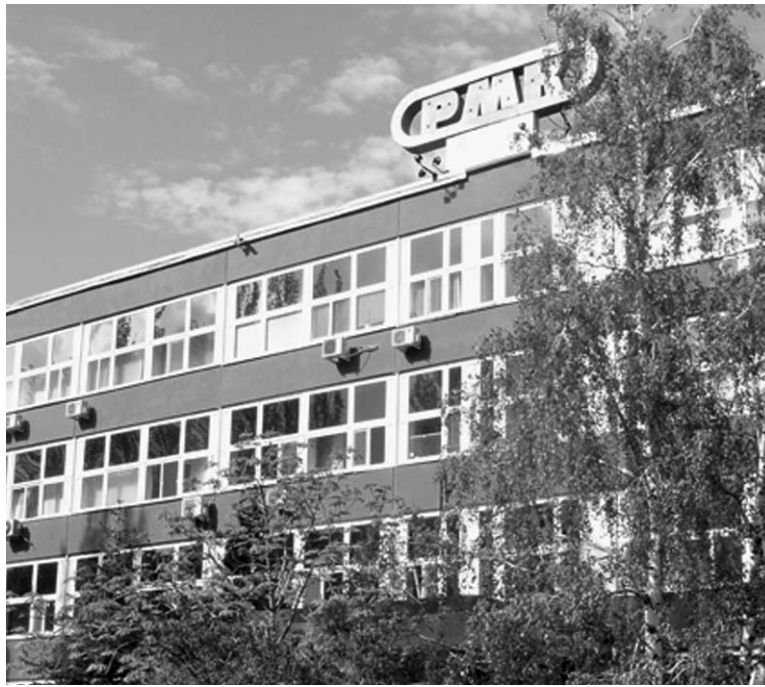
НОВЫЙ САРАТОВСКИЙ бизнес Меньших разделил на равных с новыми самарскими партнерами

По всей видимости, второй раунд саратовской экспансии Меньших проведет не в одиночестве. 12 октября 2020 года зарегистрирована компания АО «Саратовский завод РМК».