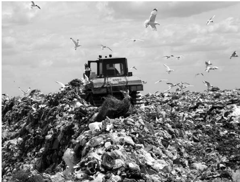
В ПОИСКАХ ценного металла подрядчик нарушил защиту свалки

Администрация Тольятти вышла в Арбитражный суд Самарской области с иском к ООО «Фантом» на 443,2 млн рублей. Причина требования столь несоизмеренной по сравнению со стоимостью контракта суммы - заключенный ООО «Фантом» договор с ООО «Альтэр». Предметом этого соглашения стала выборочная выемка свалочных масс для изучения морфологического состава и экологических исследований с целью разработки проектной документации по рекультивации бывшей городской свалки. В рамках исполнения этого контракта