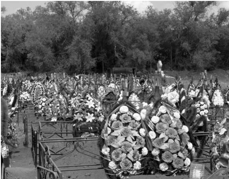
ПО ОФИЦИАЛЬНЫМ ДАННЫМ, смертность от пневмонии в этом году выросла в разы, опередив динамику заболеваемости ею