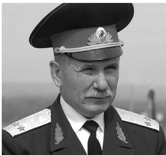
САМАРСКОЕ КАЗАЧЕСТВО VK.COM

Идеологи программы сетуют, что казакам не хватает не только материально-технических и финансовых ресурсов, но и знаний и опыта в привлечении средств на реализацию социальных проектов, а также для развития предпринимательской деятельности. По сути, казаки остаются за рамками деловой активности из-за неподготовленности к работе в условиях рынка, проводят в основном разовые мероприятия (праздники, соревнования и т.д.), используя ограниченные фи-