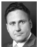
ЕВГЕНИЙ МИНЧЕНКО, политолог, глава коммуника- ционного холдинга «Минченко консалтинг»

Фракция КПРФ будет и дальше планомерно отстаивать всеми возможными законными способами возвращение прямых выборов глав городов Самарской области. И это не только позиция нашей фракции, это в целом позиция КПРФ. Считаем, что волеизъявление народа - единственная легитимная форма установления исполнительной власти в городах, регионах и стране. Все остальные псевдовыборы - это не что иное, как прямое назначение сверху.