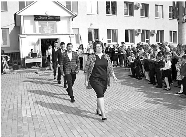
В САМАРСКУЮ ШКОЛУ-ИНТЕРНАТ №117 для слабослышащих пришли полиция и СК - здесь нашли «мертвую душу», которой переплатили из бюджета более 2 млн рублей

Школа-интернат №117 расположена на улице Майской, 49, в Кировском районе. По-