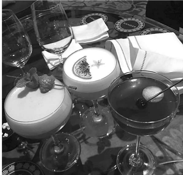
БУДЕТЕ В ПЕТЕРБУРГЕ – непременно за лучшими коктейлями в бар Xander (For seasons)

«Миндаль». Это сеть, но еда там несетевая. К посещению обязательно рекомендую именно «Миндаль» на Английской набережной, 26. Здесь вид на Васильевский, на гранит, Неву. Пространство кафе больше на ресторан похоже. Не возьму в толк - многим в этом городе вообще не лень белые скатерти использовать и хорошие салфетки. Отдельное удовольствие. Открылся этот первый «Миндаль» еще девять лет назад, серьезные люди по сей день почитают. Место про еду. Питерские рекомендуют, а также мои коллеги из Москвы настаивали на моем приходе туда. Безупречно: грузинские и европейские блюда. Приходила дважды, настолько понравилось. Хинкали - лучшие из всех, что я ела в этой жизни. Плюс подача хороша. Прекрасная баранина в красном вине. Нежнейший свежее испеченный штрудель, как в лучших домах у лучших хозяек. Очень хороша долма: и начинка, и славные упругие виноградные листья (к сожалению, в заведениях они чаще всего раскисшие). Сейчас сезон корюшки - и она здесь божественно приготовлена. Огромная хрустящая порция местной радости всех питерцев и при-