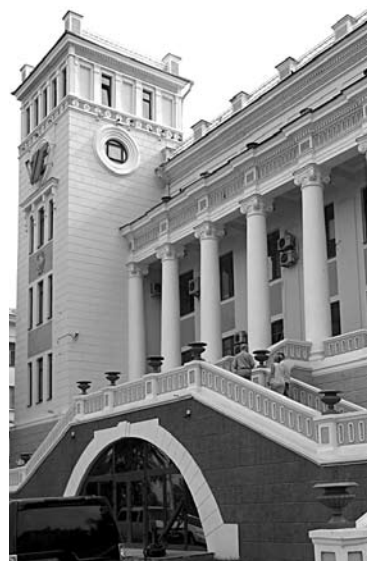
«ВОЛГОТАНКЕР» АККУМУЛИРУЕТ убытки на балансе своей «дочки»

Много лет находящееся в процессе банкротства ОАО «Волготанкер» неожиданно смогло закончить 2020 год с прибылью. По данным системы «СПАРК-Интерфакс», за прошлый год ее размер составил 72,294 млн рублей. В 2019 году «Волготанкер» получил 33,558 млн рублей убытка. При этом его дочерняя одноименная компания АО «Волготанкер», куда были переведены основные активы, закончила год с убытком в размере 276,121 млн рублей. В 2019 году их размер составлял 231,605 млн рублей. Выручка компании сократилась с 154,52 млн до 112,259 млн рублей.