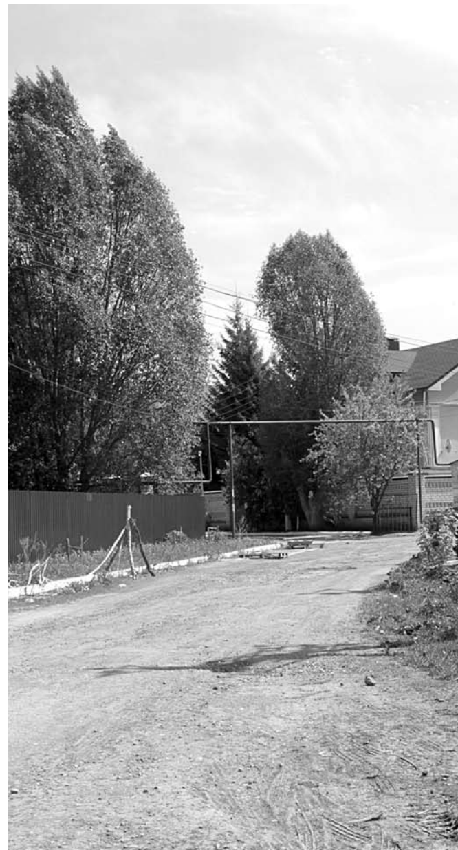
«СТРЕЛКА» ВЛАДИМИРА ГОЛУБКОВА задержали прибывшие на Березовую Аллею по тревожному вызову сотрудники ЧОО «Семерка»

конflikта трактуют ситуацию настолько по-разному, что кажется, будто все случилось в параллельной реальности.