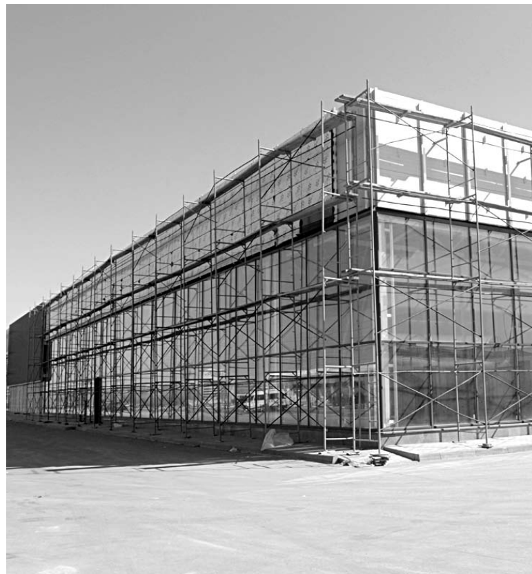
«САМАРА АВТО» откроет третий автосалон Renault в городе

Появление третьей точки в городе, по мнению участников рынка, усилит позиции брен-