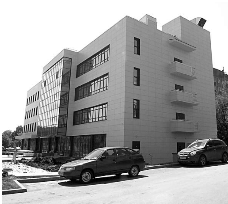
ОБЛАСТНОЙ ЦЕНТР экстракорпоральной гемокоррекции и клинической трансфузиологии признан одним из лучших проектов в сфере здравоохранения

По мнению экспертов, ввод в эксплуатацию нового кор-