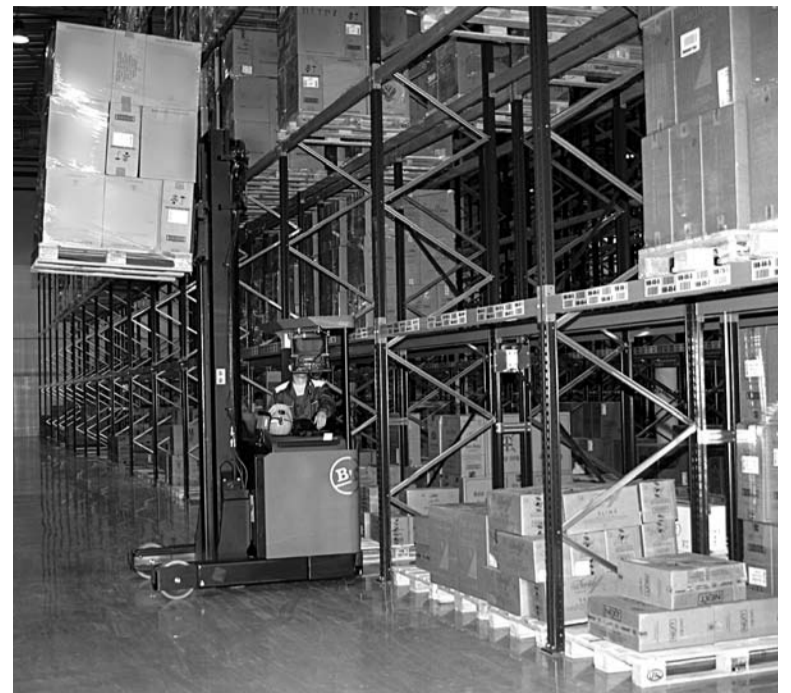
ОБЪЕКТЫ, НЕОБХОДИМЫЕ для производственных целей, сохраняют свою востребованность бизнесом даже после массового перехода на удаленку