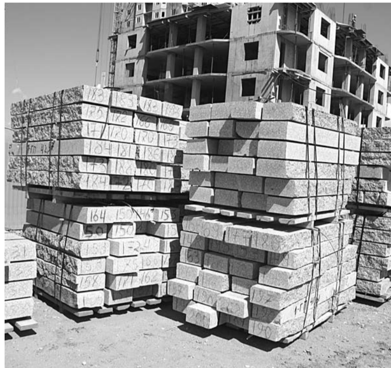
СТРОИТЕЛЬНЫЙ РЫНОК все еще ищет баланс между ценами на стройматериалы и на жилье