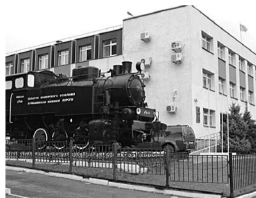
ДО СКАНДАЛА в СГЭУ под уголовное преследование уже попадали ректоры аграрного университета и СамГУПС