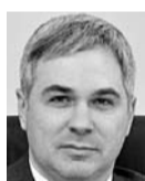
ДМИТРИЙ БОГДАНОВ, министр экономического развития и инвестиций Самарской области

С компанией Ozon это уже вторая сделка по строительству логистического хаба. Первая, на аренду 67 тыс. кв. м в новосибирском «ПНК Парк Толмачево», заключена летом прошлого года. Таким образом, общая площадь наших сделок с Ozon составляет более 470 тыс. кв. м.