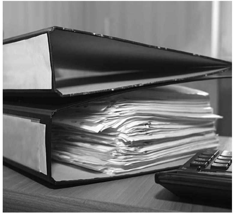
СТРОИТЕЛЯМ ПРИХОДИТСЯ выверять свои проекты, чтобы получить финансирование от банков