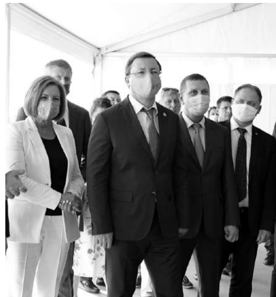
ГУБЕРНАТОР ДМИТРИЙ АЗАРОВ вместе с инвесторами запустили многомиллиардную стройку логистического хаба в Чапаевске

входа в региональный индустриальный парк «Чапаевск». Инвестору понравились не только льготы и условия, которые здесь есть, но и бизнес-климат в целом. Льготы и площадки сейчас предлагают многие, если не все, активные регионы, но доверие зарабатывается конкретными делами, и здесь нам есть что представить действующим и потенциальным партнерам», - прокомментировал «СО» министр экономического развития и инвестиций Самарской области Дмитрий Богданов.