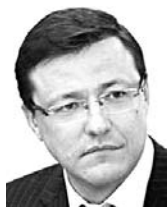
ДМИТРИЙ АЗАРОВ, губернатор Самарской области

Врачи работают круглосуточно, их силы не беспредельны, они и так делают невозможное - сверх человеческих возможностей. Мы должны взвешенно обсудить текущую ситуацию и возможные варианты ее развития, понять, что надо нам вместе сделать. Пришло время серьезных, продуманных, взвешенных и где-то жестких решений. С такой ситуацией никто мириться не собирается. Наша совместная задача - вернуть региону статус свободного от COVID-19, вернуться к привычному образу жизни.