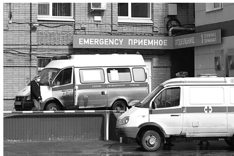
ОБЛАСТНАЯ СИСТЕМА здравоохранения задействовала все свои ресурсы на борьбу с пандемией. Но этого пока оказалось недостаточно

Глава минздрава рассказал, что сейчас идут клинические испытания вакцины для детей. Если в первую и вторую волны дети болели бессимптомно и опасность была в том, что ребенок является разносчиком инфекции, то сейчас обратная картина - дети болеют тяжело, лежат в реанимации. Детские больницы на сегодняшний день практически полностью заполнены. ■