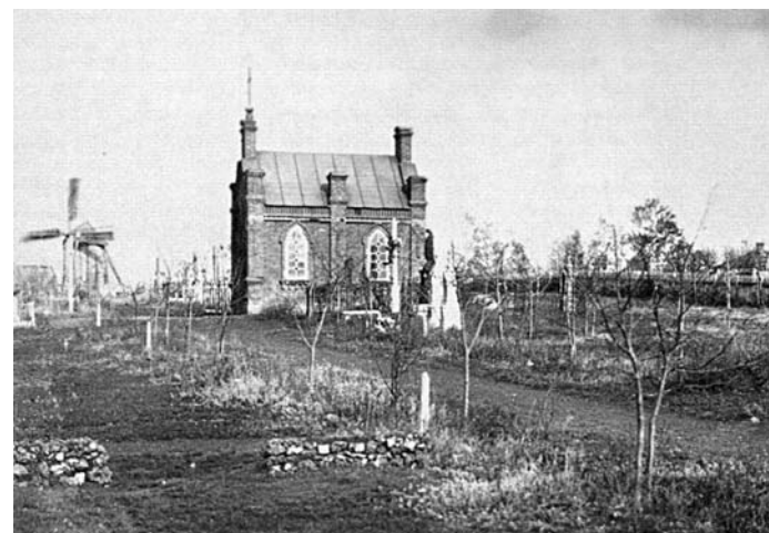
С ВСЕСВЯТСКОГО КЛАДБИЩА вывезли 1886 захоронений, освободив место под новостройку