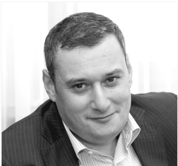
Александр Хинштейн, депутат Государственной Думы РФ от Самарской области