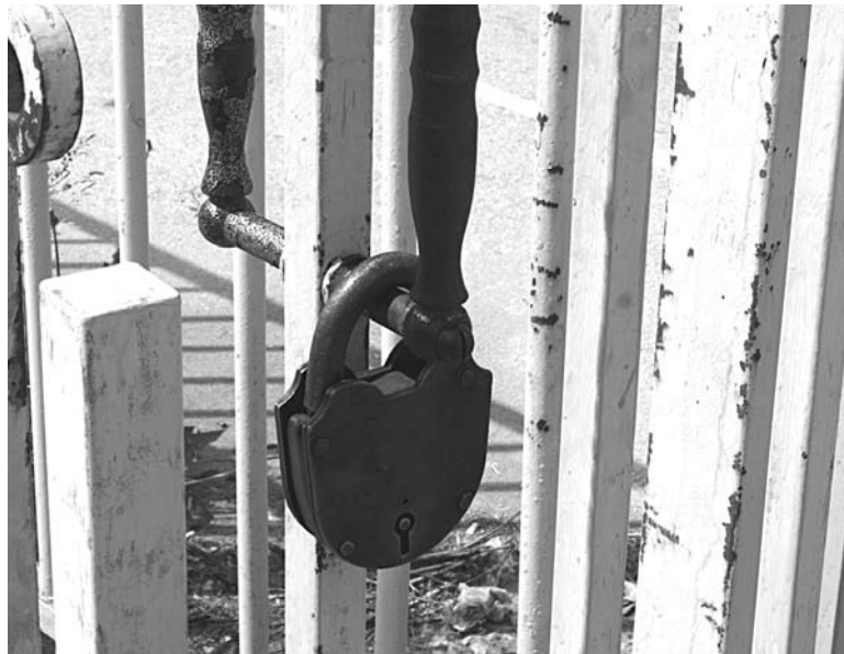
РАСЧИСТКА «МЕРТВОГО ГОРОДА» вблизи села Водино дорого обойдется самарским налогоплательщикам

В сентябре 1992 года все недостроенные поселка по решению Самарского горсовета народных депутатов вошли в реестр муниципального имущества Самары. С тех пор объект, находящийся более чем в 30 км от города, де-юре является муниципальной собственностью