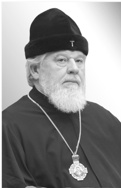
Сергий, Митрополит Самарский и Новокуйбышевский