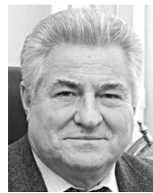
ГЕННАДИЙ КОТЕЛЬНИКОВ, председатель Самарской губернской думы

Объективной причиной заболевания и смертности является позднее обращение пациентов за медпомощью из-за опасений заражения COVID-19. Отсюда и те усилия и меры, которые необходимо принять в текущем и следующем годах по снижению уровня смертности населения. Первое - по возможности максимальное расширение диспансеризации граждан. Второе - приобретение нового медицинского оборудования для лечебных учреждений губернии. Наконец, третье - обеспеченность заведений здравоохранения врачебными кадрами. Для решения этих задач нужны значительные финансовые средства - в проекте бюджета Самарской области на 2022 год расходы на сферу здравоохранения планируется увеличить.