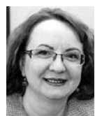
ИРИНА НИКИШИНА, министр труда, занятости и миграционной политики Самарской области

Министерство строительства Самарской области