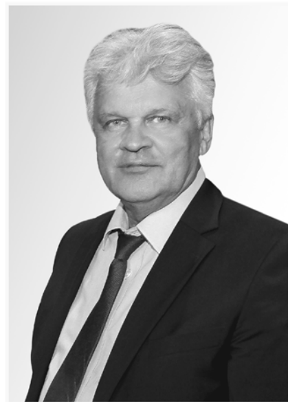
Виктор Казаков, Депутат Государственной Думы ФС РФ

От всей души благодарю коллектив завода за весомый вклад в развитие Самарского региона и желаю всем сотрудникам предприятия крепкого здоровья, семейного счастья, благополучия и новых трудовых свершений для нашего Отечества.