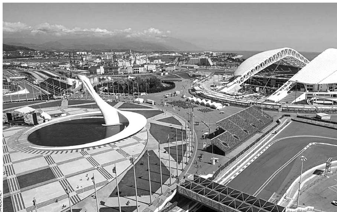
СРЕДИ КЛИЕНТОВ «обнальной» группировки обнаружилась и компания «Атмосфера», активно осваивавшая деньги, выделенные на содержание и благоустройство сочинских олимпийских объектов

Среди клиентов компании г-на Церцвадзе - непубличное акционерное общество «Центр