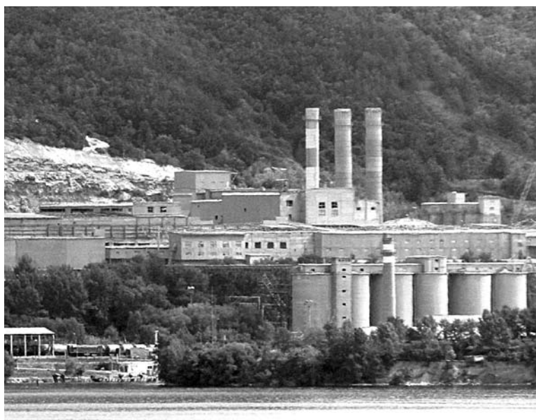
«ЖИГУЛЕВСКИЕ СТРОЙМАТЕРИАЛЫ» признались в нарушении промышленной безопасности, но пытаются не останавливать при этом своей работы

Есть вопросы и по персоналу. Выяснилось, что к работе на опасных производственных объектах допускаются работники, не прошедшие аттестации в сфере промышленной безопасности. Мастера горного цеха, работающие со взрывными материалами, не имеют обязательной «Единой книжки взрывника». Особо отмечается, что «на каждом объекте ведения горных работ не созданы условия, позволяющие работникам объекта и подрядных организаций в случае аварии беспрепятственно покинуть участок, на котором не исключена возможность нанесения вреда их здоровью» и «не созданы условия, позволяющие осуществить своевременную, безопасную для